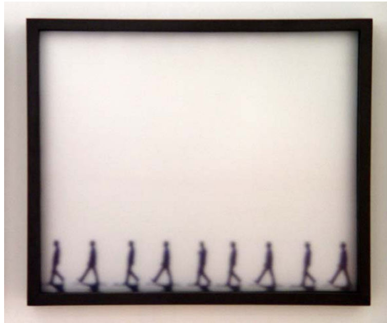
Serie Narciso I