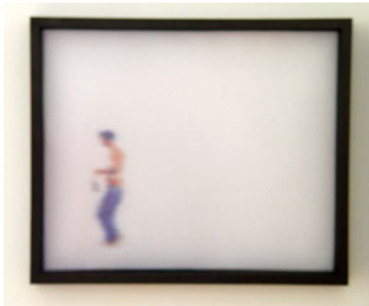
Serie Urbanos 1