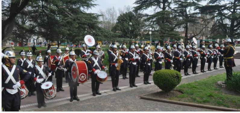
Nota: Banda Militar, ( Banda Militar "Ituzaingó" | Gestión Cultural Defensa, n.d. )