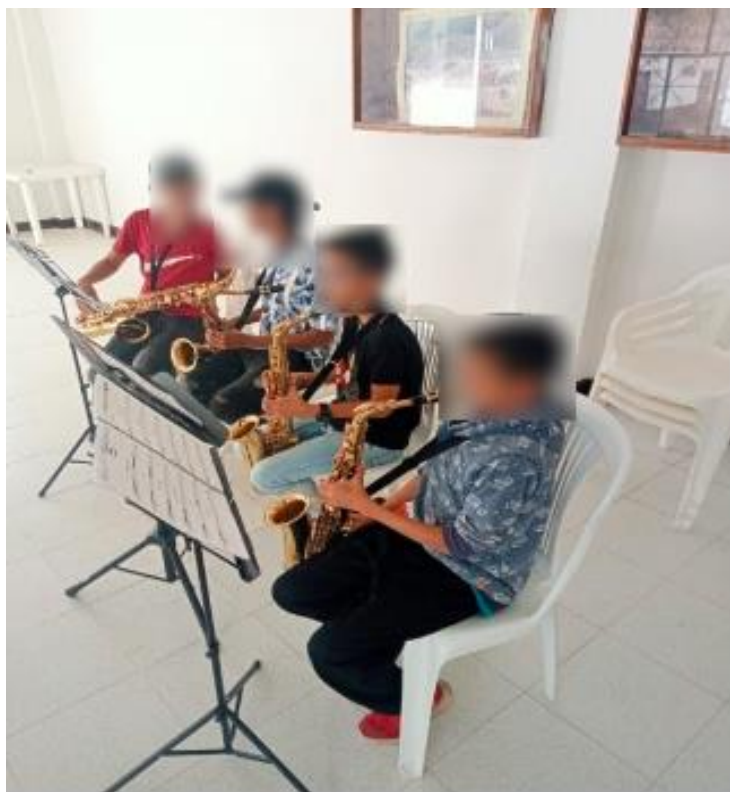
Grupo de Saxofonistas