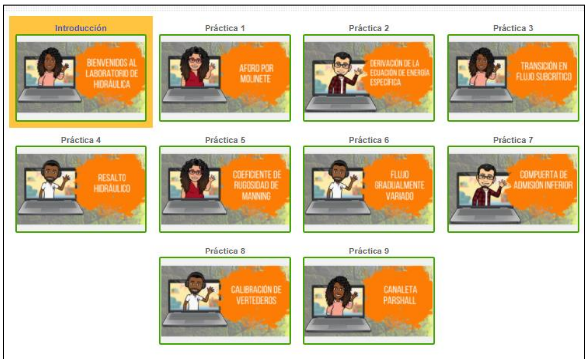
Figura 1: Presentación tipo rejilla de las prácticas en Moodle

El módulo de aprendizaje fue organizado en una estructura de rejilla con el objetivo de entregar al estudiante una panorámica de las diferentes prácticas que realizará a través del semestre. En su versión actual, la plataforma ofrece una sección de introducción y nueve prácticas de laboratorio. Se agregaron ilustraciones haciendo que el módulo sea más amigable con el estudiante (Figura 1). El vínculo de acceso al módulo desarrollado es https://tic.uis.edu.co/ava/course/view.php?id=35543 .