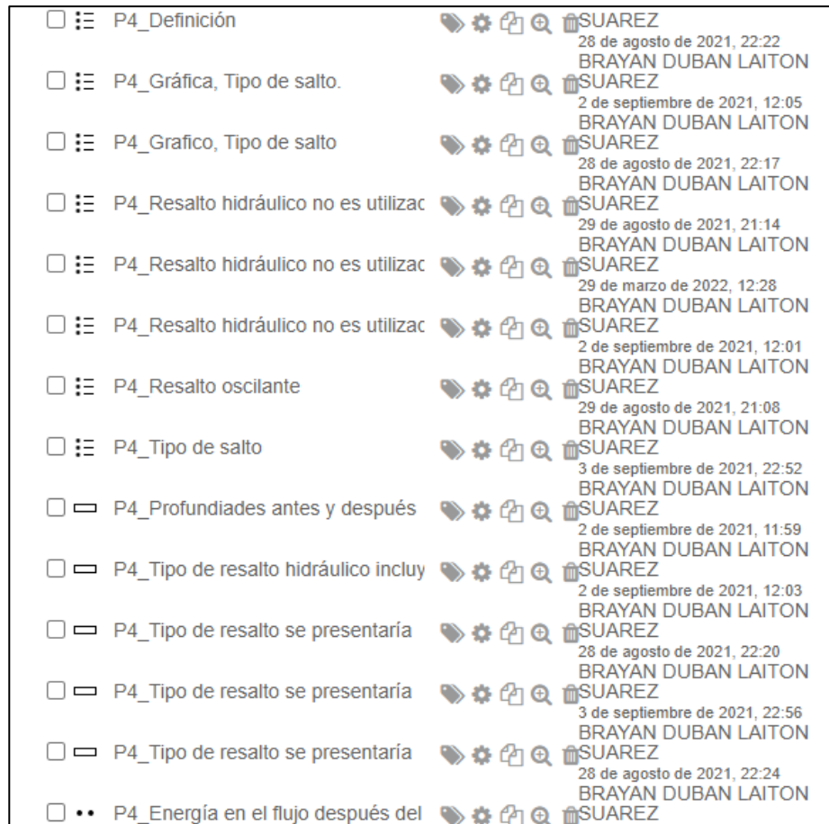
Figura 7: Banco de preguntas tipo teórico