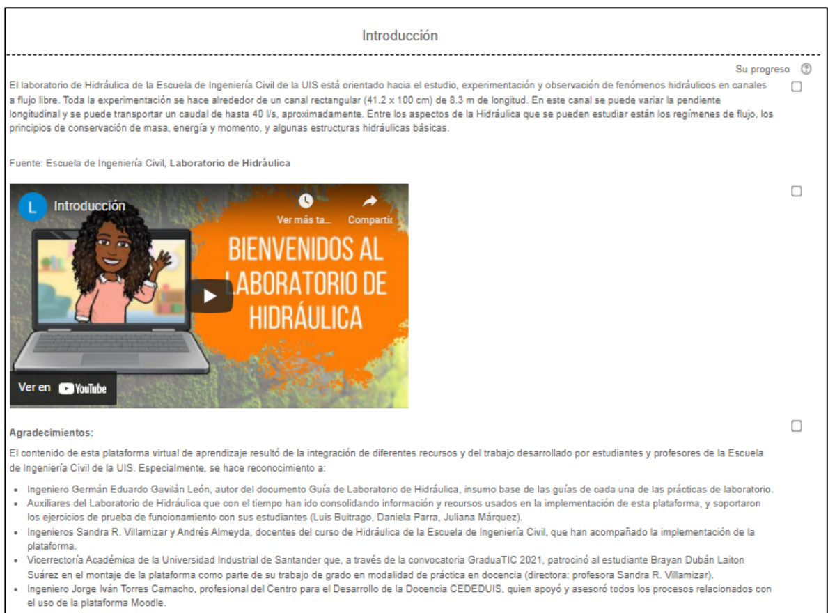
Figura 2: Introducción al módulo de laboratorio de hidráulica

La sección de introducción general al laboratorio busca que el estudiante se familiarice con la información básica del origen del laboratorio, su estructura, y los elementos típicos que el estudiante va a encontrar durante la realización de las prácticas; adicional a esta información se hace reconocimiento a algunas personas que hicieron un aporte significativo para la consolidación del presente trabajo y se presenta la bibliografía más relevante (Figura 2).