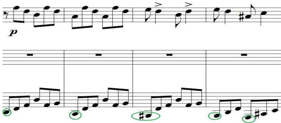
Figura 9. Arpeggio con bajo descendente diatónicamente (compases 13 al 16)