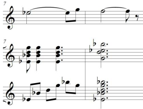
Figura 5. Acorde IIIb (compases 7 y 8)