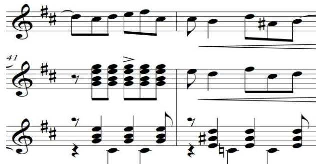
Figura 10. Acordes IIIm7b5-IIb7 (compases 41 y 42)

La sección A comienza en el compás 29 con Bm7 como acorde de tónica, luego hace un giro armónico II-V-I (C#m7b5- F#7(b13)-Bm7) dominante secundaria de la dominante, dominante y tónica respectivamente. En el compás 32, comienza una progresión con el bajo descendente cromáticamente Bm7/A-E7/G#-Gm6, buscando la dominante F#7(b13) y la tónica Bm7 hasta el compás 36. La repetición de la primera frase que comienza en el compás 37 con el acorde de primer grado Bm7, presenta una variación armónica utilizando los acordes C#m7b5 y Em7b5 como sustitutos de la dominante en el compás 38, que resuelven en el 39 con los acordes Bm9 y Bm7. Ver figura 10. En el compás 40 hay una progresión de VII grado (de la escala menor natural) A7/C# -VI grado G/B que pasa, del compás 41 al 42, a IIIm7b5-IIb7 (C#m7b5-C9) sustitutos de la dominante y Bm7 en el compás 43 como resolución. Ver figura 10.