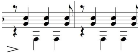
Figura 8. Acorde Fadd9(omit3)