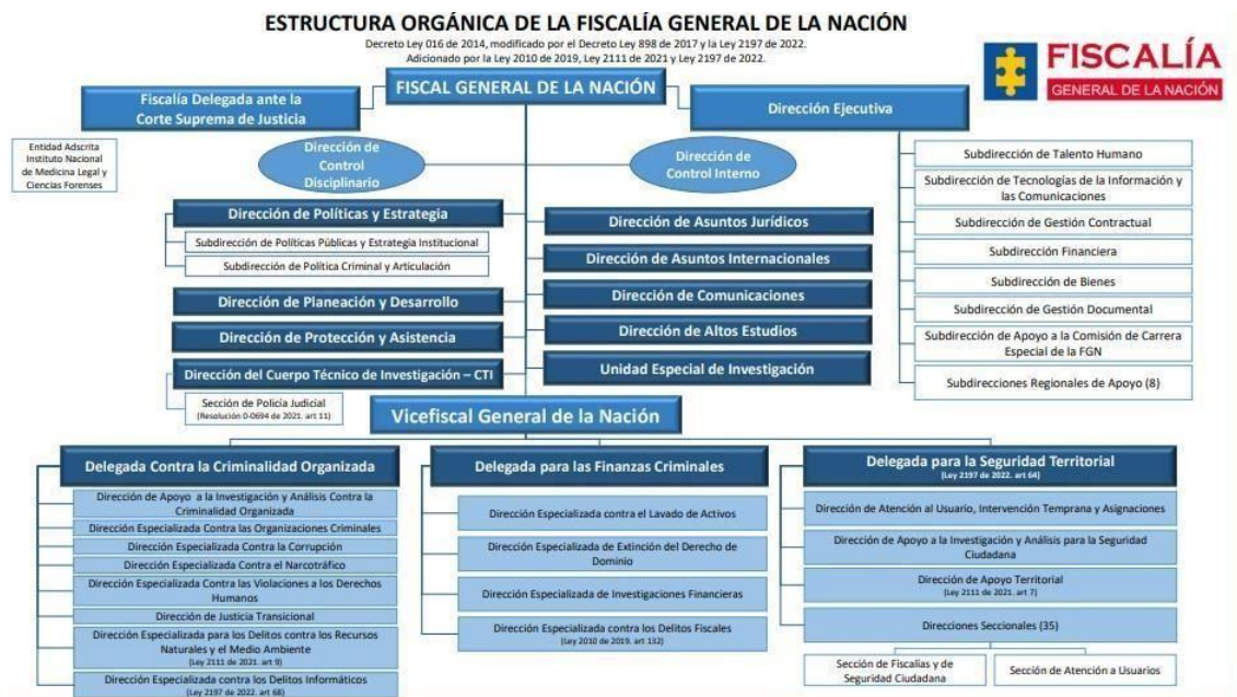
Figura 1. Estructura orgánica de la Fiscalía General de la Nación.