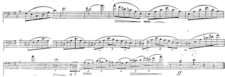
Figura 27. Vals Miniatura para Contrabajo y Piano, Opus 1, No. 2.

Fuente: KOUSSEVITZSKY, Serge. Vals Miniatura para Contrabajo y Piano, Opus 1, No. 2. Por Fred Zimmermann.