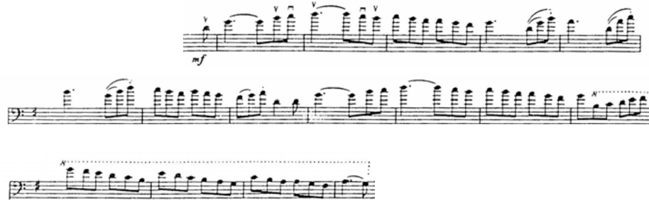
Figura 17. Concierto en La Mayor para Contrabajo y Orquesta.

Fuente: Dragonetti, Domenico. Concierto en La Mayor para Contrabajo y Orquesta. Reducción o versión para Piano y Contrabajo de Edward Nanny