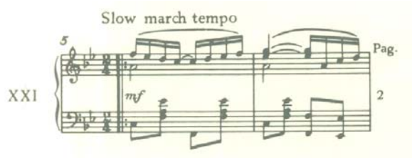
Figura 28. Ejemplo de la música hecha por Scott Joplin (Compuesta y pianística).

Fuente: JOPLIN, Scott. Ragtimes Für Klavier – For Piano. Band – Volumen II. New York: C.F. Peters.