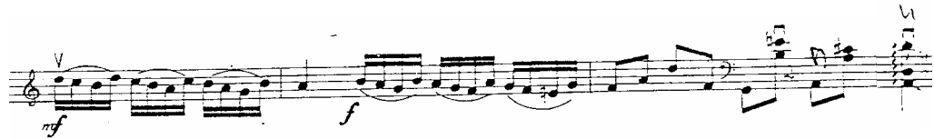
Figura 5. Sonata en Sol Menor – Episodio C – Compás 21 al 24

Fuente: HÄNDEL, Georg Friedrich.. Sonata en Sol Menor. Adaptación hecha por W. Sliwinski del Concierto para oboe, orquesta de cuerdas y chémbalo.