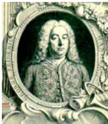
Figura 1. Georg Friedrich Händel (1685 – 1759)

Fue director de la Royal Academy of Music, en 1719 donde estrena muchas de sus operas italianas. En estos dos géneros la ópera y el oratorio alcanza su máximo esplendor, y con el oratorio El Mesías, se convierte en el máximo exponente de este género.