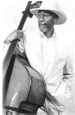
Figura 33. Ronald Levin Carter (1937- )