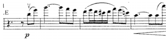
Figura 20. Concierto Andante. Compás 2 al 5.