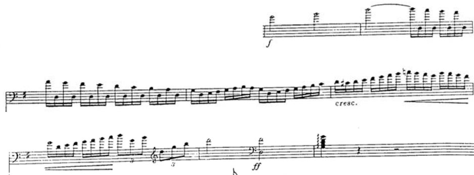
Figura 13. Concierto en La Mayor para Contrabajo y Orquesta. Compás 12 – Primer tiempo del 19.

Fuente: Dragonetti, Domenico. Concierto en La Mayor para Contrabajo y Orquesta. Reducción o versión para Piano y Contrabajo de Edward Nanny