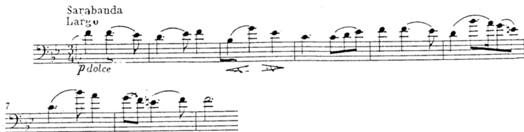
Figura 6. Sonata en Sol Menor – Sarabanda – Compás 1 a 9.

Fuente: HÄNDEL, Georg Friedrich.. Sonata en Sol Menor. Adaptación hecha por W. Sliwinski del Concierto para oboe, orquesta de cuerdas y chémbalo.