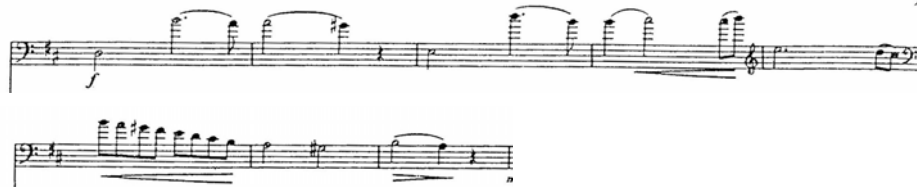
Figura 16. Concierto en La Mayor para Contrabajo y Orquesta. Andante