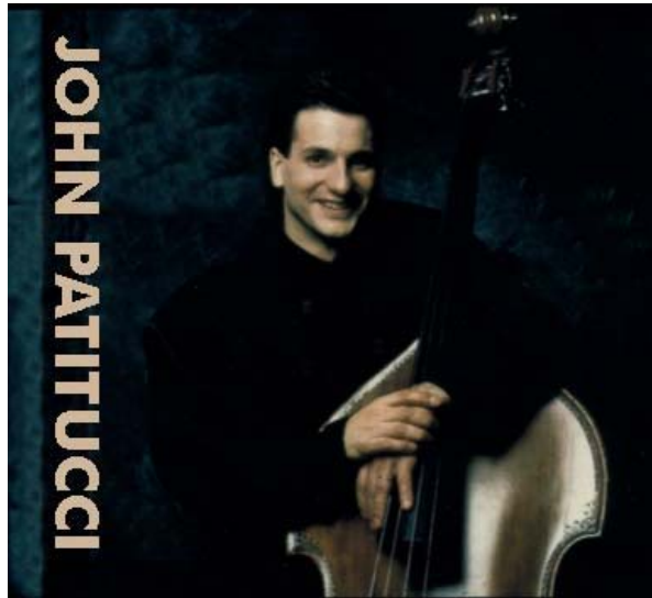
Figura 35. John Patitucci (1959 - )