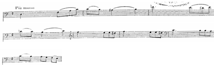
Figura 23. Concierto Chanson Triste. Op. 2. Compás 20 al 27.

Fuente: KOUSSEVITZSKY, Serge. Chanson Triste. Op.2. Por Fred Zimmermann.