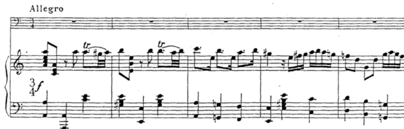
Figura 8. Sonata en Sol Menor – IV Allegro – Compás 1 - 5

Fuente: HÄNDEL, Georg Friedrich.. Sonata en Sol Menor. Adaptación hecha por W. Sliwinski del Concierto para oboe, orquesta de cuerdas y chémbalo.