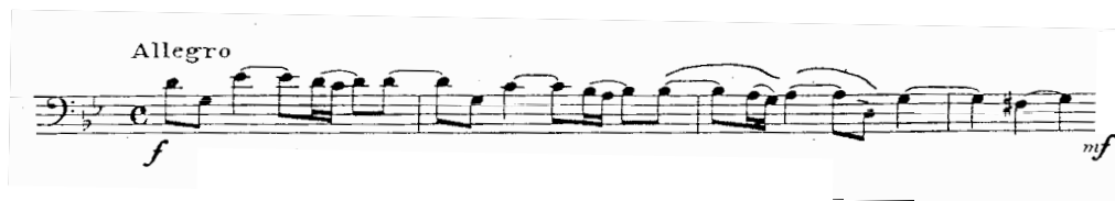
Figura 3. Sonata en Sol Menor – Allegro - Compás 1 - 4

Fuente: HÄNDEL, Georg Friedrich. Sonata en Sol Menor. Adaptación hecha por W. Sliwinski del Concierto para oboe, orquesta de cuerdas y chémbalo.