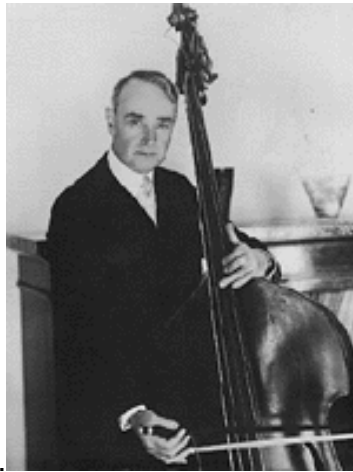
Figura 19. Serge Alexandrovitch Koussevitzky (1874 - 1951)