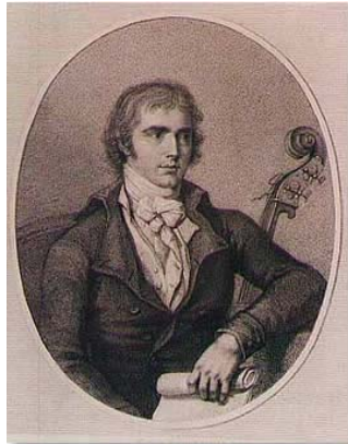
Figura 12. Domenico Dragonetti (1763 – 1846).