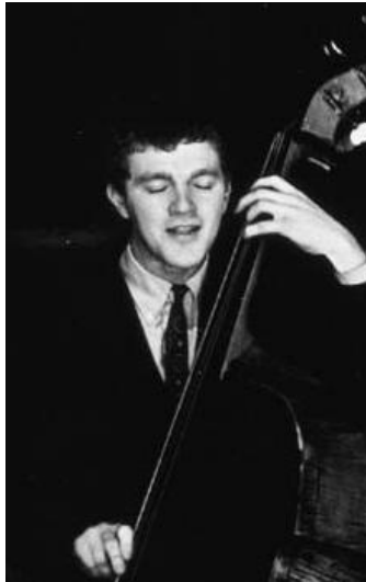
Figura 32. Scott LaFaro (1936 – 1961)