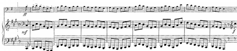
Figura 18. Concierto en La Mayor para Contrabajo y Orquesta.

Fuente: Dragonetti, Domenico. Concierto en La Mayor para Contrabajo y Orquesta. Reducción o versión para Piano y Contrabajo de Edward Nanny