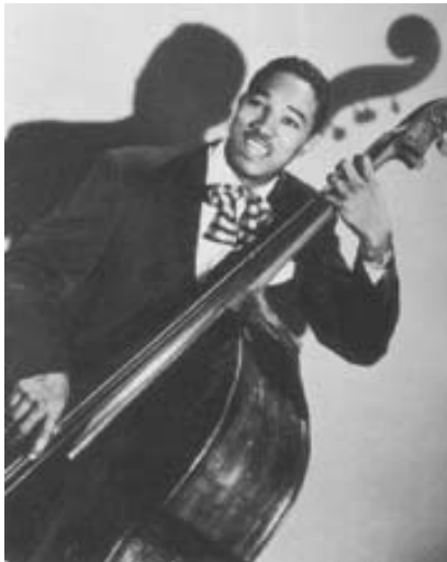
Figura 30. Jimmy Blanton (1918 – 1942)