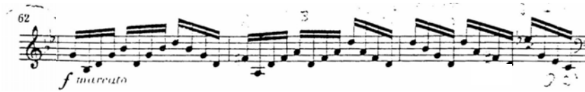
Figura 10. Sonata en Sol Menor – IV Allegro – Compás 63 - 65 Contrabajo.