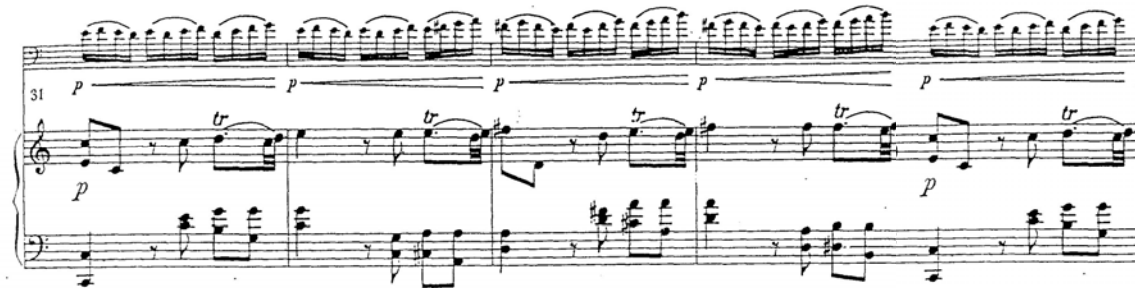
Figura 9. Sonata en Sol Menor – IV Allegro – Compás 31 – 35 Contrabajo y Piano.