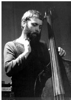
Figura 34. Dave Holland (1947 - )