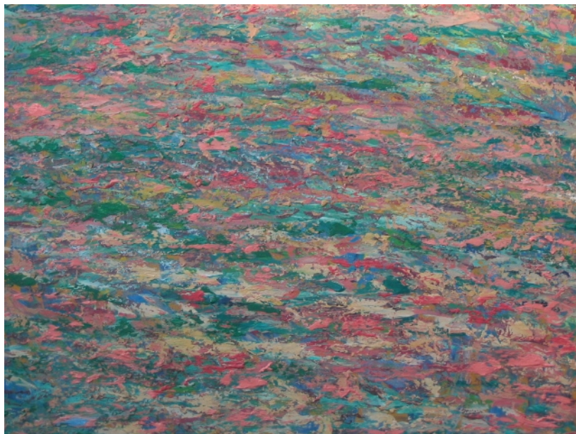
Figura 11. Fusión (Felipe Jerez) Tamaño 100 cm x 90 cm.

Técnica empaste con espátula y pincel, material utilizado acrílico sobre lienzo, en esta obra se aprecia la impregnación de la naturaleza muerta, se aprecia una superposición de colores, de fondos fuertes y llevados a las últimas capas con colores claros para darle más sutileza a la textura y la forma del empaste.