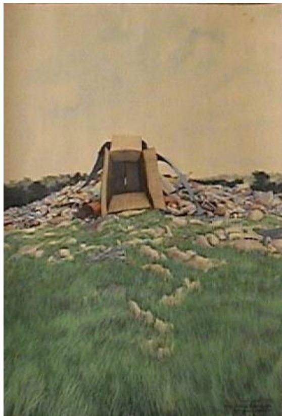
Figura 4. El basurero (Tomás Sánchez) 50 x 30 cm