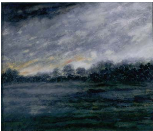
Figura 2. Paisaje clima frío (Antonio Barrera) 80 x 50 cm