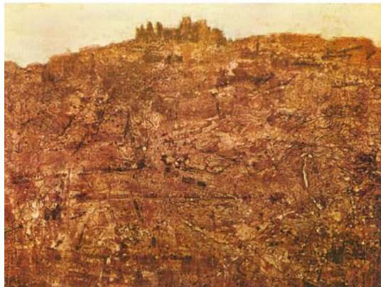
Figura 7. El Pueblo Devastado Tela 1952 (Jean Dubuffet) Museo Royaux del Beut

Pintura monocroma mezcla arenas, alquitrán, uno de los más audaces renovadores de la técnica pictórica del siglo XX. Expresa con gran sencillez cromática el misterio dramático del suelo, la mancha ocre se recorta sobre un espacio claro como si quisiera sugerirnos el contraste entre el cielo y la tierra. A