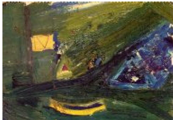
Figura 6. Oleo y lápiz sobre papel (Joseph Beuys) 22.5 x 32.5pulg.

Era ecologista afilado, y también estuvo implicado en política., en 1979 él hizo un miembro fundador del partido verde alemán, movimiento ecologista, en su trayectoria fue influenciado por el entorno y trabaja los desechos que en esa época por la guerra abundaban las demoliciones causadas por el impacto, por eso lo incluyo como apoyo a mi anteproyecto, también manejo la parte pictórica