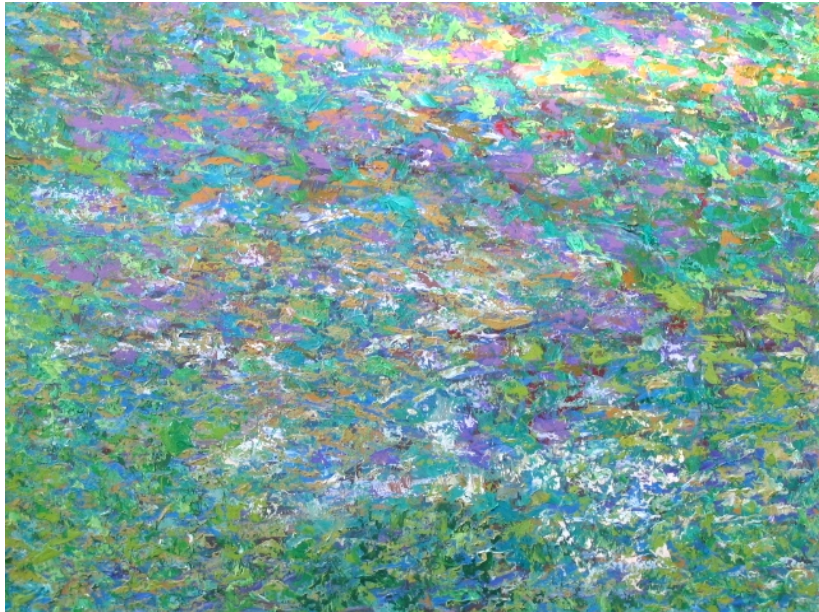
Figura 12. Tapiz (Felipe Jerez) Tamaño 69 cm x 50 cm.

Técnica empleada espátula, con una mezcla cromática de colores que se van superponiendo, dando la idea de una colcha de retazos o un tapiz, en sentido figurativo se superponen, en sentido figurativo, se ve movimiento y plasticidad en la aplicación de la textura.