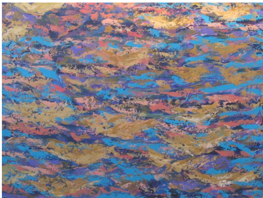
Figura 10. Señales (Felipe Jerez) Tamaño 100 cm x 90 cm.

Técnica empaste con espátula, material utilizado acrílico sobre lienzo, es la representación de un ritmo que trasciende en los espacios abiertos naturales, cuando hay algo en descomposición, su tamaño casi métrico es querer describir un lleno total.