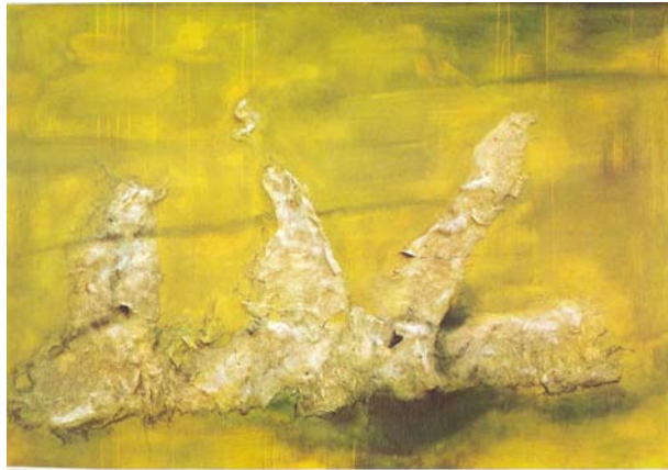
Figura 8. Eso (Rene Guiete) Técnica Mixta sobre tela, 1958

veces tenemos la impresión de hallarnos frente a una tierra fósil donde los pueblos han sido desvastados por su acción misma contra la naturaleza.