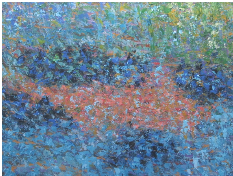
Figura 9. Desolación (Felipe Jerez) Tamaño 100 Cm x 90 Cm