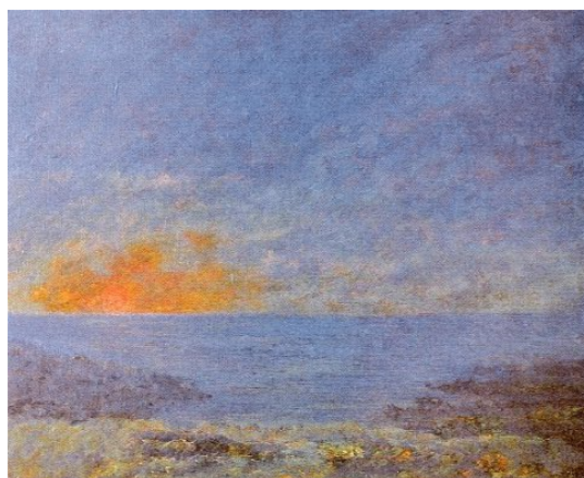
Figura 3. Amanecer clima frío (Antonio Barrera) 80 x 50 cm