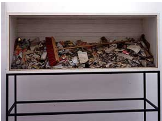
Figura 5. Instalación con desechos (Joseph Beuys) 1.50 x 1.80 cm.