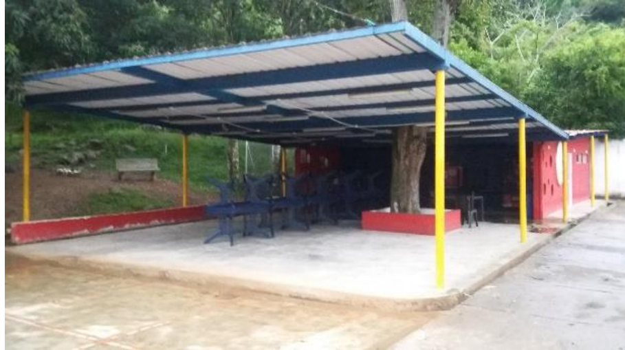
Figura 9. Cafetería y zonas verdes.