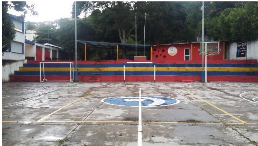
Figura 10. Cancha múltiple y gradería.

El terreno donde está ubicado el inmueble cumple con los parámetros reglamentarios para el uso a nivel educativo, terreno urbanizado, vías vehiculares, peatonales y zonas verdes. La infraestructura está en buenas condiciones, sin presencia de fisuras, grietas o hundimientos que afecten su vulnerabilidad.