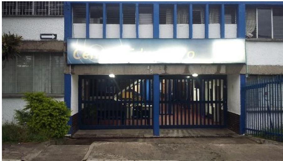
Figura 7. Entrada principal colegio tejados Cajasan.