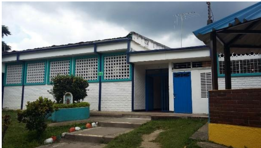
Figura 15. Fachada principal interna, Jardín Infantil Colonitas Cajasan.

algunos deterioros en acabados que requieren de mantenimiento correctivo. El Jardín Infantil Colonitas consta de un solo nivel, con zonas verdes, área de juegos infantiles, quiosco, piscina, mini plazoleta, siete salones, dos salones con cuarto de baño, salón de informática, comedores, bodega, cuarto de aseo, cocina, enfermería, oficina de dirección con cuarto de baño, patio, solárium, patio con lavadero, batería de baños con seis unidades para niños y una unidad para adultos. En el apéndice E, se puede observar el presupuesto de obra civil de la sede Jardín Infantil Colonitas Cajasan, con ítems de actividades, cantidades, valor unitario y valor total.