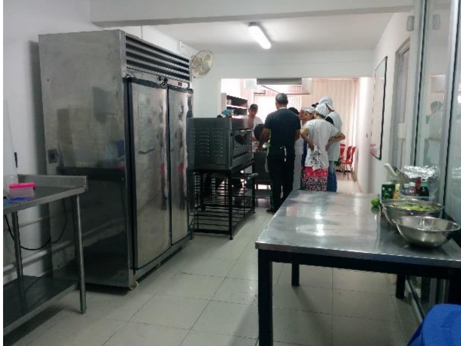
Figura 16. Cocina de Instituto Técnico Laboral Cajasan Sede Diamante.

3.7.3. Impacto Social Cajasan Sede Diamante. EL inmueble Impacto Social, localizado en la Cra. 23 No. 87-16, Diamante II. La estructura se encuentra en buen estado ya que no presenta deterioro en sus elementos estructurales, presenta algunos deterioros en acabados que requieren de mantenimiento correctivo. Las oficinas de Impacto Social Cajasan sede Diamante, consta de dos niveles. Primer nivel con acceso a la oficina de recepción, sala de espera, salón de clase utilizado por el Instituto Técnico Laboral, un baño, área de bodega, acceso al segundo nivel por escaleras. Segundo nivel con cinco áreas de oficina, un área de reuniones, área de archivo, salón de gerencia, dos cuartos de baño. En el apéndice G, se puede observar el presupuesto de obra civil de la sede.