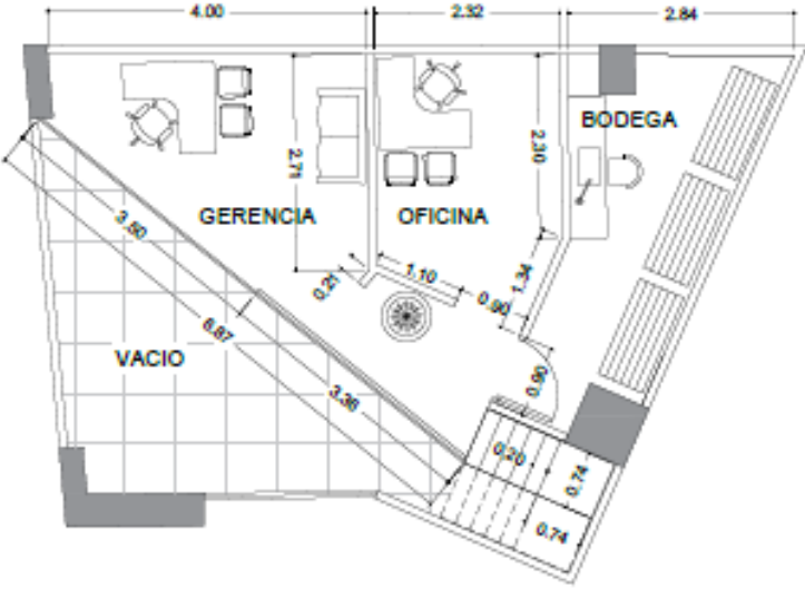
Figura 14. Planta segundo nivel, diseño arquitectónico óptica.