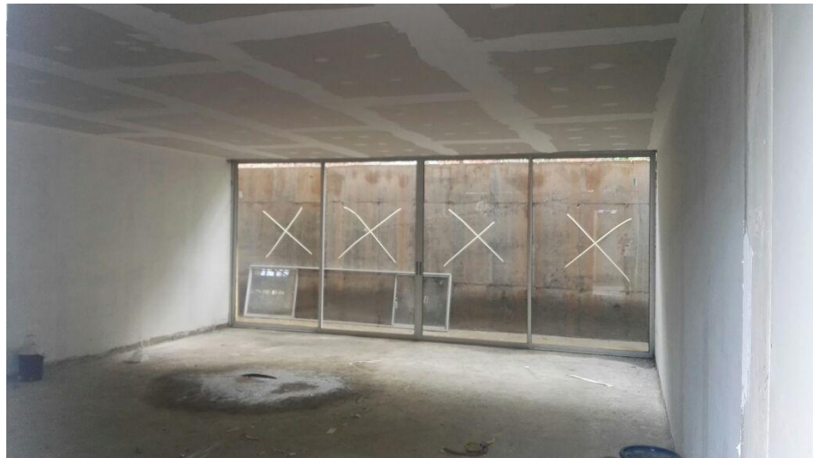
Figura 4. Instalación drywall, cableado eléctrico, de red y puertas.