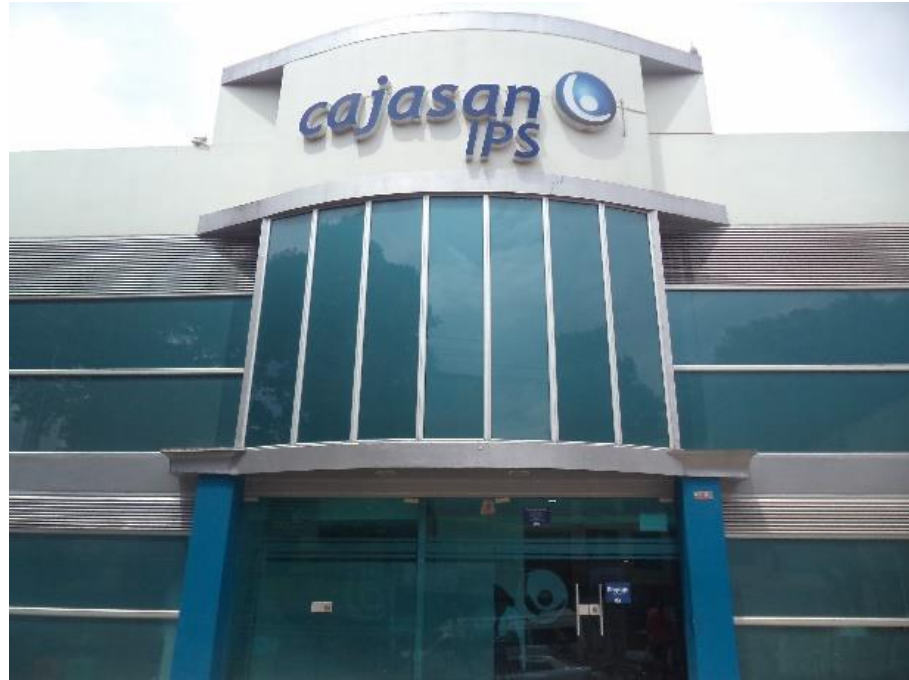
Figura 12. Fachada principal IPS Ciudadela CAJASAN.