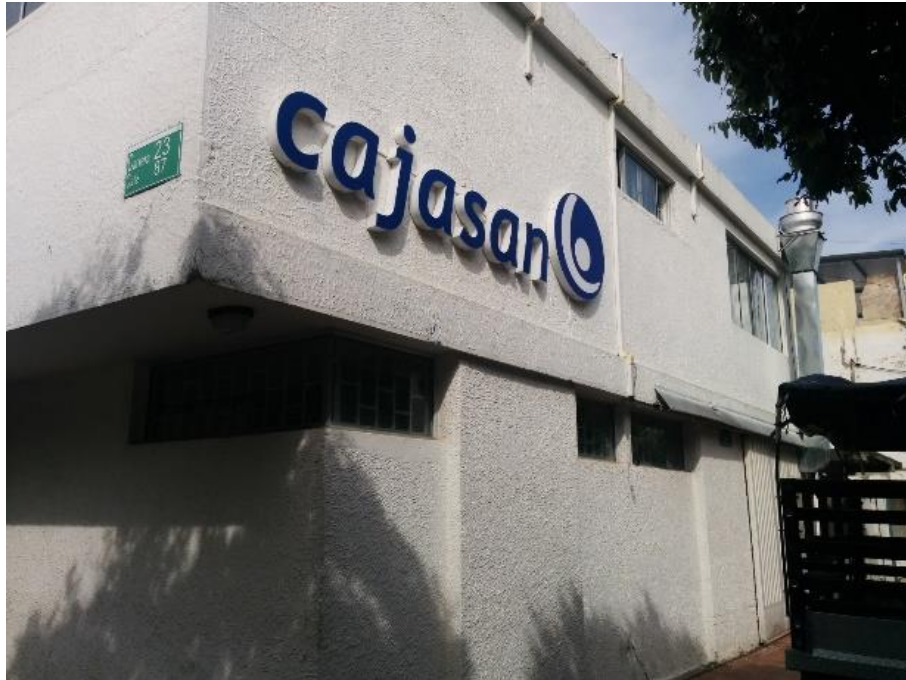
Figura 17. Fachada lateral, Impacto Social Cajasan Sede Diamante.

3.7.4. Supermercado Cajasan Puerta del Sol. El terreno donde actualmente funciona el Supermercado Cajasan se encuentra ubicado en la Cra 27 No. 61-78, Puerta del Sol, municipio de Bucaramanga. Consta de un inmueble propio. El establecimiento presenta problemas de iluminación debido al gran número de luminarias fundidas. Se recomienda actualizar el tipo de iluminación fluorescente por LED. El Supermercado de Puerta del Sol consta de dos niveles. Primer nivel, bodega, batería de baños, cafetería, área de ventas y zona de parqueo. Segundó nivel, área administrativa. En el apéndice H, se puede observar el presupuesto de obra civil de la sede.