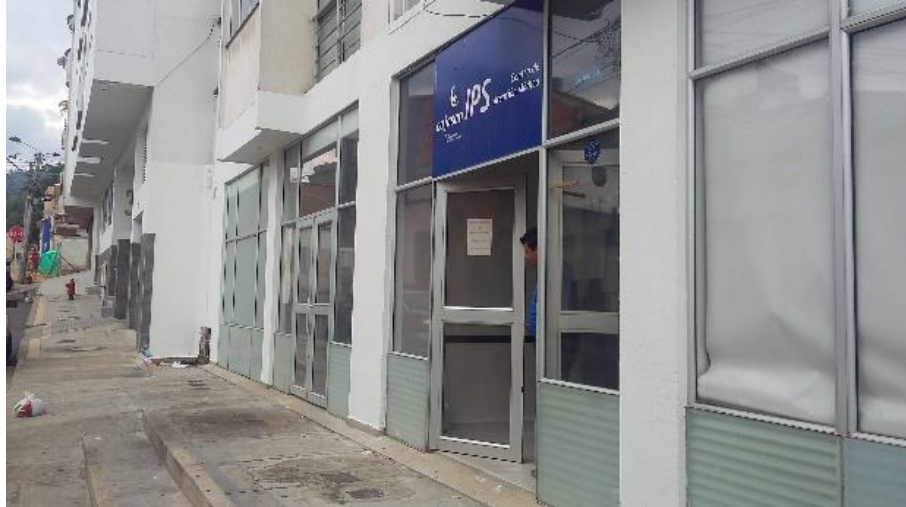
Figura 11. Fachada principal IPS Parque Condominio CAJASAN.

La IPS Ciudadela Cajasan, localizada en la diagonal 16 nomenclaturas 59-56 Ciudadela Real de Minas, municipio de Bucaramanga. Debido a la visita realizada por de la Secretaria de Salud municipal, hubo la necesidad de modificar la rampa de absceso al segundo piso, por una escalera y adicional una salva escalera para el uso de personas en condiciones de discapacidad, también hubo necesidad de construir una ruta de evacuación para solo residuos hospitalarios y similares. Se realizó visita con contratista para programar actividades y realizar arreglos. Así mismo se realizó una evaluación entre tres propuestas de salva escalera para dar un criterio técnico sobre las propuestas.