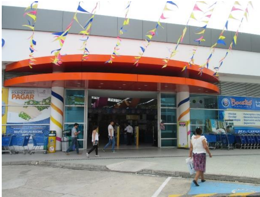
Figura 18. Fachada, Supermercado Cajasan Puerta del Sol.