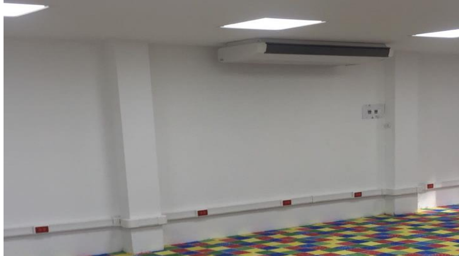
Figura 5. Terminado de acabados e instalación de piso linóleo.

Se observaron algunos atrasos en el desarrollo de las actividades, debido a la falta de material para el desarrollo de la obra y del personal dispuesto para cumplir a tiempo con las mismas. Se recomienda al contratista mejorar en la planeación y organización de las actividades. Se hace verificación que todas las actividades contratadas fueron ejecutadas con calidad y se recibe satisfactoriamente todas las obligaciones adquiridas por el contratista. Por lo tanto, se recibe la obra ampliación de la infraestructura donde opera el jardín infantil pinocho y se hace liquidación del contrato celebrado entre Santiago Sánchez Vesga y Cajasan.