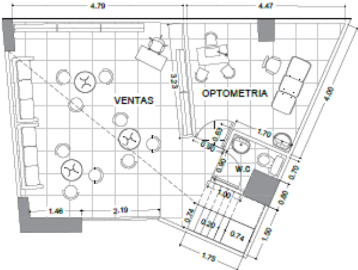
Figura 13. Planta primer nivel, diseño arquitectónico óptica.