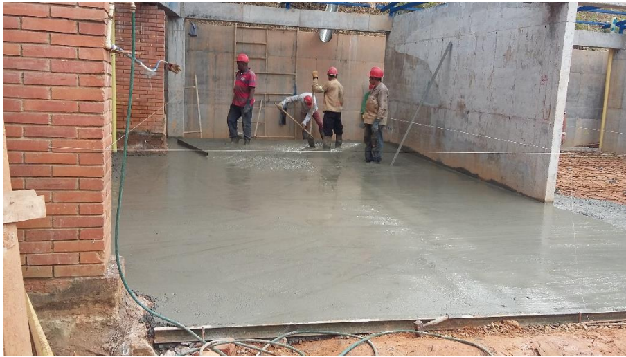
Figura 3. Fundida de pisos en concreto premezclado.

En las siguientes figuras, se muestra el avance de la obra desde el inicio de la supervisión hasta la entrega y cumplimiento de las actividades contratadas. Registro fotográfico de las visitas realizadas periódicamente, cada semana.