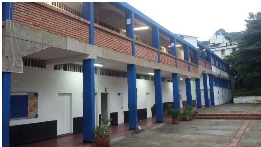
Figura 8. Patio y corredores bloque 1.