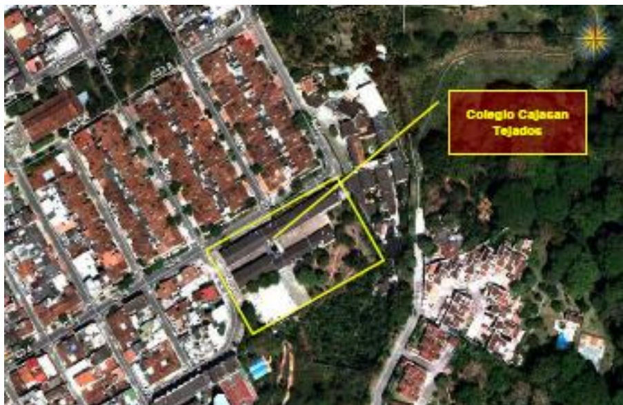
Figura 6. Ubicación del colegio tejados Cajasan.

El centro educativo colegio tejados Cajasan, se encuentra localizado en la calle 34 con nomenclatura 45-38, propiedad del municipio de Bucaramanga, cedido en comodato a Cajasan. Debido a que el contrato comodato por un periodo de 5 años se ha cumplió, Cajasan debe entregar la propiedad al municipio de Bucaramanga, para esto se solicita a la USE Servicios Administrativos un informe gerencial y detallado del estado actual de la infraestructura del inmueble.