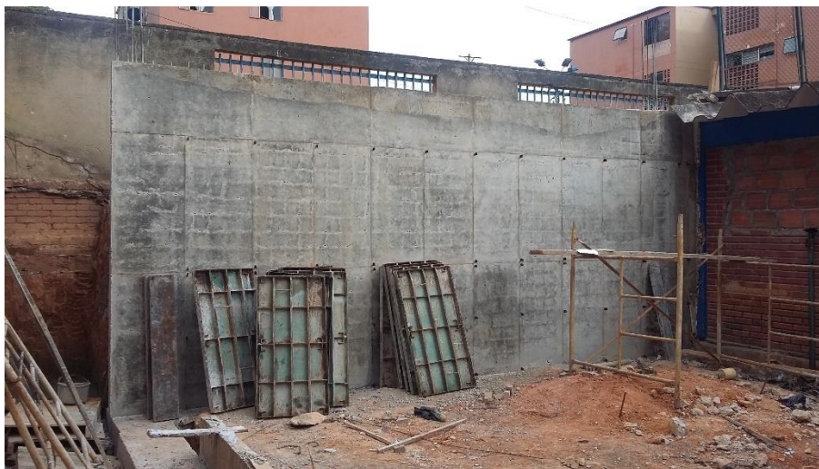
Figura 2. Placa muro P1 e= 12 cm.

En la figura 2, se puede observar el estado actual de la obra al momento de la primera visita realizada, donde se dieron compromisos por parte del contratista en aumentar la mano de obra e incluir laborar los fines de semana.