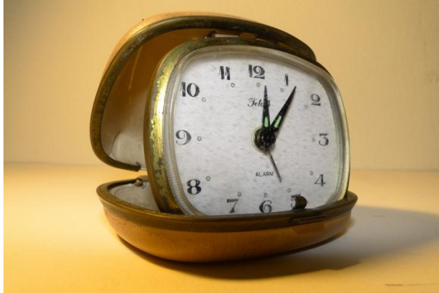
Figura 17. Reloj de uso personal de Hugo Ospina