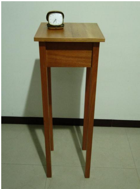
Figura 18. Mesa que se usa en la acción.