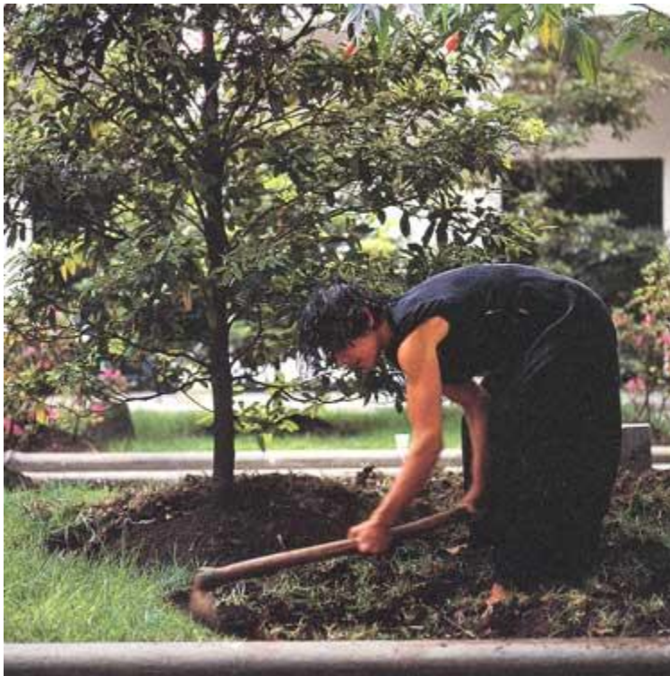
Figura.4 María Teresa Hincapié, Esta tierra es mi cuerpo... , Performance, 1992.

Sus acciones son de carácter gestual y poético, nos plantea las acciones como actos cotidianos que se revelan como metáforas que generan emoción y reflexión, en mi acción Desvaneciendo en la memoria surge la metáfora como elemento que me dará la posibilidad de hacer el duelo inconcluso de la desaparición forzada de mi padre y a través de la misma transmitir mis emociones y permitir al espectador y a otras víctimas reflexionar sobre este acontecimiento. Hincapié incorpora dentro de su obra ritmos y movimientos que permiten transmitir serenidad, esto lo logra por medio de ejercicios que son orientados al dominio del cuerpo, logrando en el espectador sentir la fuerza que transmite a través de su riguroso manejo; fusionando la actividad física con la transformación artística, haciendo del cuerpo una entidad psicológica que permite la semiosis entre el arte y la vida. Es así como reconozco la importancia de yoga (unión), dentro del proceso, permitiéndome generar unión entre la mente y el cuerpo.