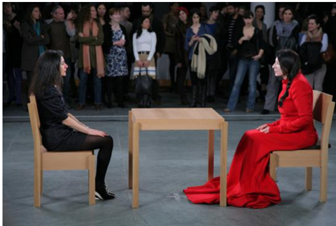
Figura 2. Marina Abramovic, “THE ARTIST IS PRESENT”, New York, MOMA

Fuente: http://www.moma.org/explore/multimedia/audios/190/2017