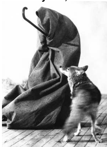
Figura 1. Joseph Beuys, “Acción coyote”, 1974

El término “acción catártica” me ha permitido reconocer que durante muchos años he hecho catarsis a través de la acción de dibujar. O, cuando he realizado performance, comprendí que el dolor que me ha generado mi experiencia personal ha sido el que me ha guiado en este proceso de búsqueda, introspección y creación.