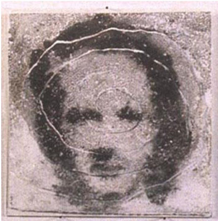
Figura 5. Oscar Muñoz, Narcisos, 1994

En sus obras una de las constantes es invitar a indagar acerca de la capacidad del arte para reflexionar sobre la memoria del individuo, en su trabajo trata de descomponer lo instantáneo, aquello que dura y que puede desaparecer en un instante. Recurre a diversas e innovadoras técnicas en el manejo de la imagen, permitiendo al espectador reflexionar sobre la capacidad que tienen las imágenes para retener en la memoria, como se puede ver en su obra Narcisos (1994), donde muestra tres etapas del proceso de manera alegórica, la creación, los cambios que se dan durante el proceso y la muerte; Desvanecer en la memoria , tiene tres etapas, materializar la imagen de mi padre, revivir su imagen, para lijarla, reconociendo el proceso en el que se desvanece en la memoria y por último nos enfrentamos a la muerte, a las cenizas (polvo) que fue apareciendo a medida de que se fue lijando la imagen.