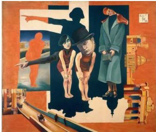
Hannah Hoch, Roma (1925).