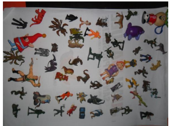
Objetos para el ensamble