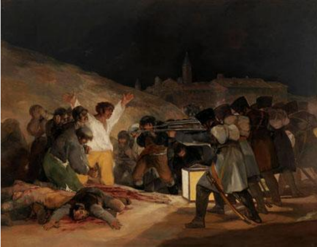
Imagen 4. "Los Fusilamientos en la Montaña del Principe Pio" 1808, oleo sobre lienzo.

Dice el artista Pablo Picasso, "No, la pintura no está hecha para decorar las habitaciones. Es un instrumento de guerra ofensivo y contra el enemigo." La mayoría de los artistas pintores se manifestaban ante los hechos violentos que ocurrían durante las guerras, un ejemplo de esto es "El Guernica", obra de Picasso de carácter histórico, que muestra la crueldad con que bombardearon la ciudad durante la guerra civil española en 1937.