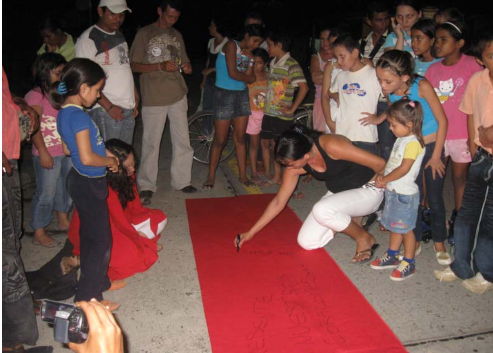
Imagen 18. Performancia, mayo de 2009 "Memoria" Barrancabermeja.

La curiosidad de los niños fue muy importante en esta noche, ya que muchos en busca de saber lo que ocurría, observaban muy atentamente, tratando de adivinar la palabra que se iba formando con los objetos, muchos de ellos preguntaban :¿Esos objetos significan los huesos de los muertos? ¿Todo eso son muertos? ¿Eso son los recuerdos de los muertos? Y así como estas muchas más preguntas que me hicieron una vez terminado el trabajo.