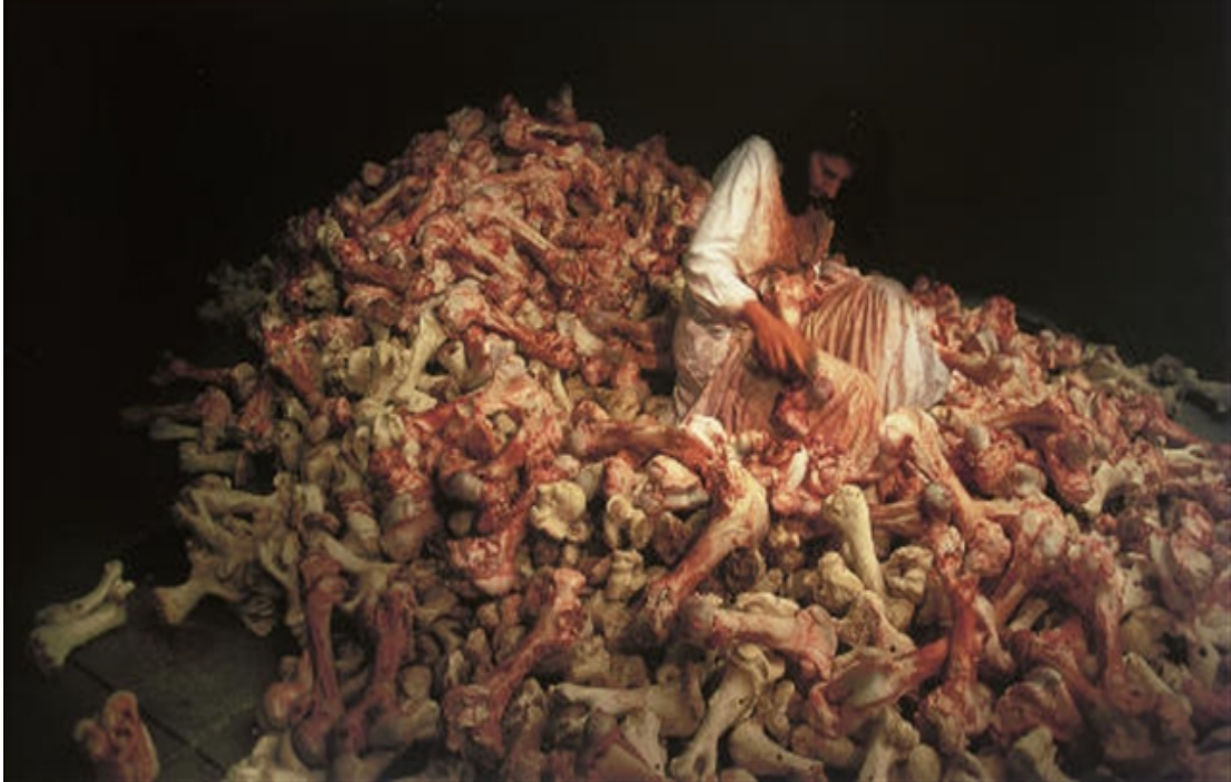
Imagen 6. PERFORMANCIA "BALKAN BAROQUE" MARINA ABRAMOVIC, 1999.

Esta performance, llamada "Balkan Baroque", es una obra visual bastante fuerte debido al aspecto sangriento de los huesos, la actitud y el atuendo de la artista y las canciones que canta, canciones que la población yugoslava entonaba para enfrentar las pérdidas, apaciguar el dolor ocasionado por la guerra, y manifestarse contra los atropellos a la dignidad humana.