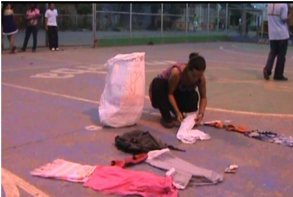
Imagen 17. Registro fotográfico, abril 18 de 2009, ensayo en el Barrio Arenal Barrancabermeja, tomadas por John Aleman