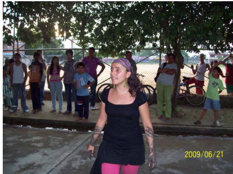
Imagen 21. Performancia, junio de 2009, "Memoria" Barrancabermeja.