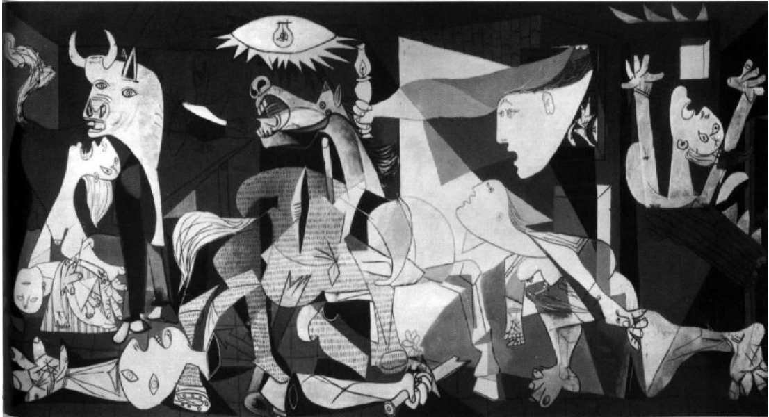
Imagen 5. "El Guernica" Pablo Picasso, 1937 oleo sobre lienzo. http://www.ewan.es/includes/spaw2/uploads/images/el-guernica.JPG

En esta obra, representativa del cubismo, hay una fuerte carga simbólica en cada uno de sus personajes, quienes transmiten intensamente el dolor, la desesperación y el sufrimiento.