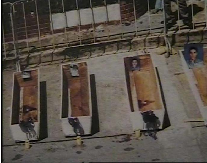
Imagen 2. Fotografía. 5 de junio de 1998, protesta de los familiares víctimas del 16 de mayo en Barrancabermeja.