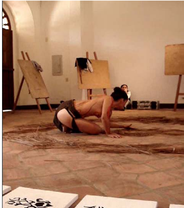
Imagen 22. Performance, "Ritual al Hambre" junio de 2007, Bucaramanga.

Estos son registros de ejercicios de la performance, algunos trabajos académicos que he venido desarrollando durante la carrera de Bellas Artes y expresiones plásticas a partir del cuerpo como elemento principal, con las que he explorado o diferentes espacios y materiales que me llevaron al desarrollo de cada uno de ellos.