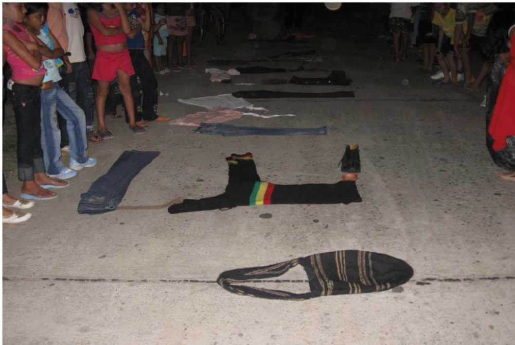
Imagen 19. Performancia, mayo de 2009 “Memoria” Barrancabermeja.