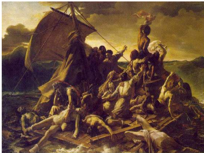
Imagen 3. La balsa de la Medusa. Teodoro Géricault, 1818, óleo sobre lienzo.

Algunos de los ejemplos más sobresalientes se ilustran a continuación. Teodoro Géricault (Théodore Géricault) pintó, en 1818, “La Balsa de la Medusa” cuadro insignia del movimiento Romántico francés. En él plasmó la crueldad con la que un capitán inexperto, ante el naufragio y el poco número de botes salvavidas, embarcó a 149 personas de bajo rango social en una balsa improvisada y los lanzó a la deriva sin comida ni bebida. Los viajeros restantes, de mayor estatus económico, fueron privilegiados al acceder a los botes salvavidas que garantizarían su supervivencia.