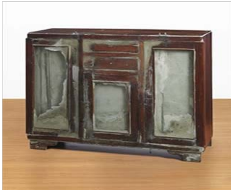
Imagen 7. Instalación “La Casa Viuda”, Doris Salcedo

En una de sus obras, muy conocida, “Casa Viudas” los “...muebles lloran la pérdida de los antiguos ocupantes aferrándose a huesos, los restos de un vestido...” 22 . Así registra la forma en la que las personas se aferran a los objetos utilizados por los ausentes, como único recuerdo de los desaparecidos o muertos, y el anhelo de tener por lo menos los restos de aquellos que se llevaron y que no han regresado.