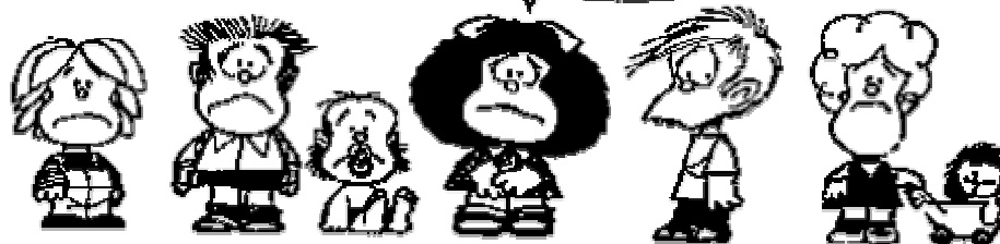
Mafalda y sus amigos, de Joaquín Lavado "Quino"

¿O ALGÚN ZANAHORIA NOS PERDIÓ LOS PLANOS?