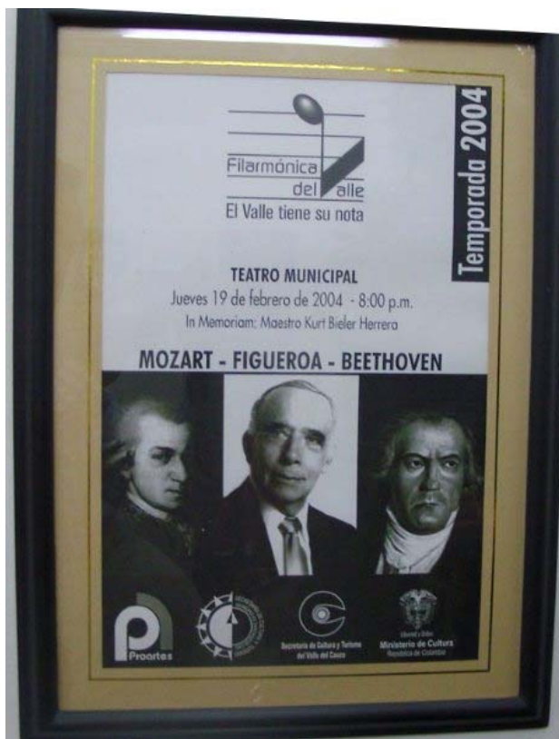
Figura 8. Afiche Temporada 2004 de la Orquesta Filarmónica del Valle