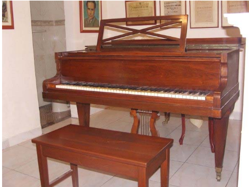
Figura 13. Su Piano