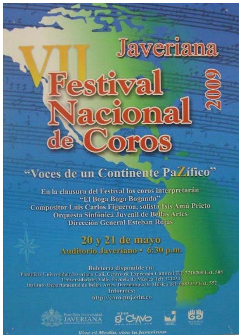
Figura 11. Afiche VII Festival Nacional de Coros 2009