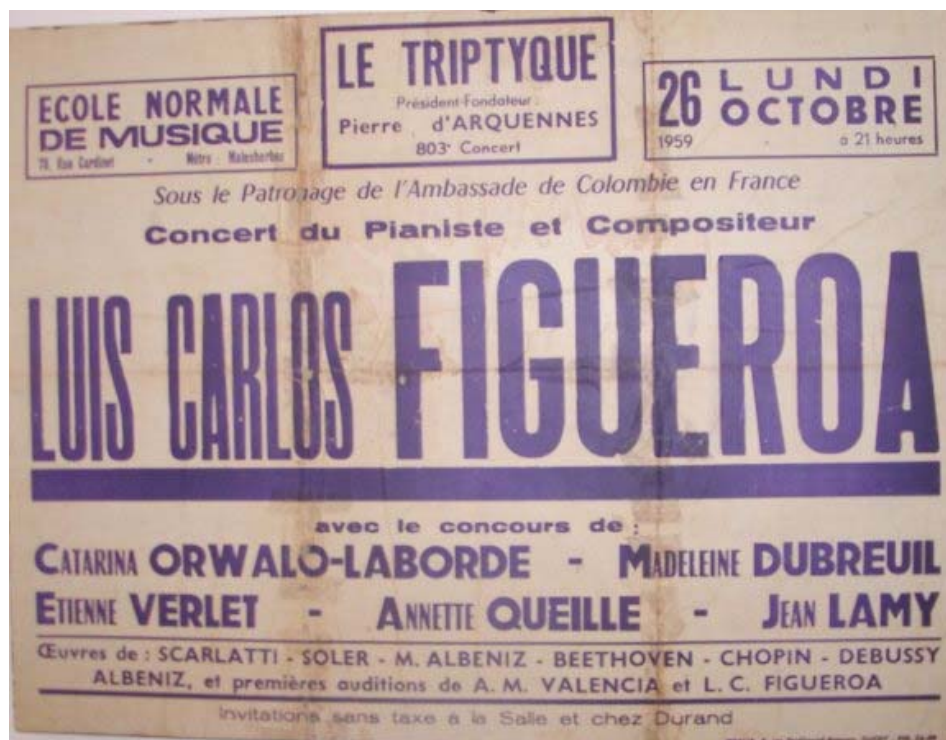
Figura 3. Afiche Concierto en Francia