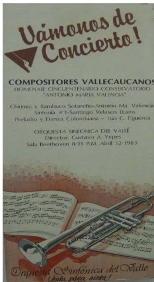
Figura 4. Afiche “Vámonos de Concierto” 1983

En 1981 el Instituto Departamental de Bellas Artes le otorga un pergamino en reconocimiento de sus 30 años de servicio en el Conservatorio de Música de Cali.