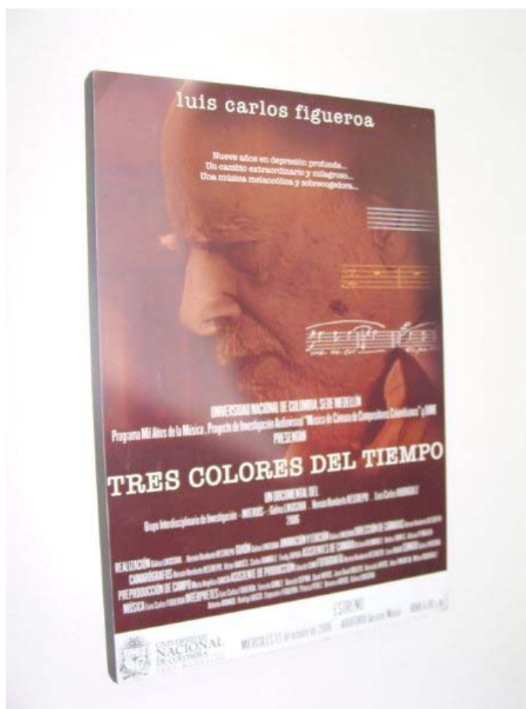
Figura 10. Afiche “Tres colores del tiempo”