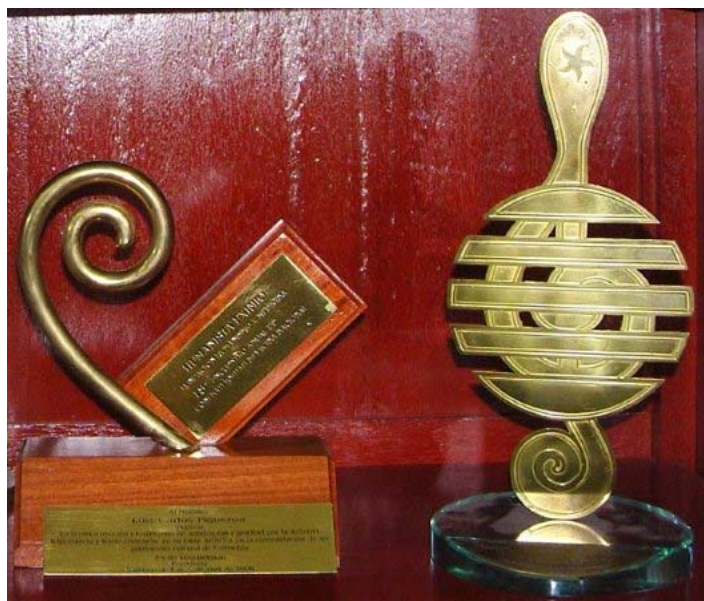
Figura 7. Reconocimientos al maestro Luis Carlos Figueroa