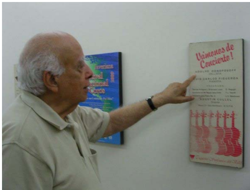
Figura 14. El Maestro hablando de los eventos en los que ha participado