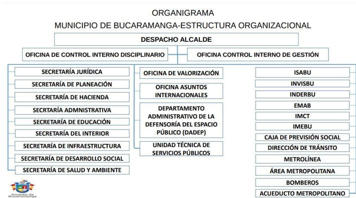
Organigrama de la Alcaldía de Bucaramanga

Nota: se presenta la estructura organizacional de la Alcaldía de Bucaramanga (Alcaldía de Bucaramanga, 2024)