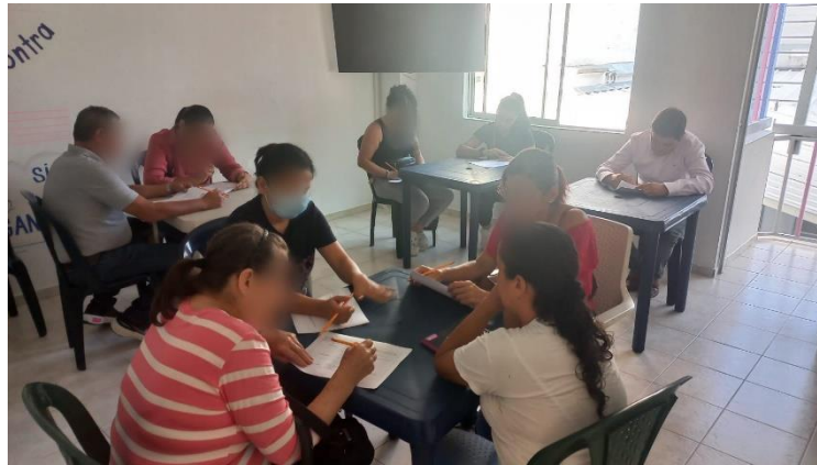
Evidencia de la sesión