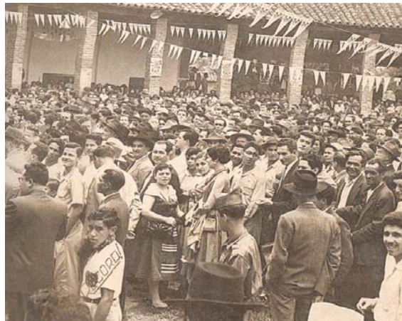
Plaza de ferias en la década del 50

Algunos estudios sobre migración en la ciudad informan los rasgos de los migrantes en el periodo anterior a la violencia que se caracterizaron en su mayoría por ser jóvenes en edad económicamente activa, con obligaciones familiares menores que le permite una mayor posibilidad de buscar nuevas oportunidades en la ciudad, mientras que los años que siguieron a la violencia se caracterizaron por inmigraciones masivas de familias enteras procedentes de las zonas del departamento que sintieron con mayor rigor el impacto de la violencia política de los 48 en adelante.