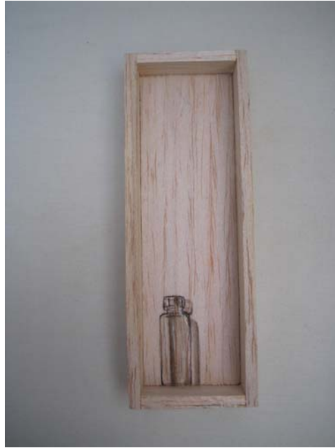
Figura 20. De la Obra Nodriza