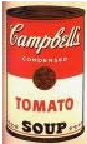
Figura 7. Soup Campbells