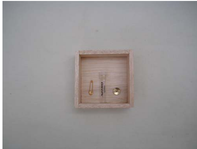
Figura 17. De la Obra Nodriza