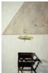
Figura 11. Ilustración Tàpies

Esta visión de Tàpies refuerza la intención de limitar mi grupo de objetos y lo que pueden representar psicológicamente, buscando que no se mienta con lo que evocan y el sentido de verse identificado a través de ellos (Ver figura 11).