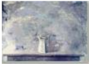
Figura 14. Jarra