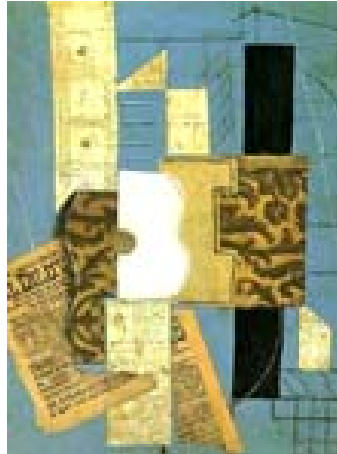
Figura 6. Collage Cubista Picasso

metálicos... También es frecuente que el collage se combine con otras técnicas de dibujo o pintura, como el óleo, el grabado o la acuarela.