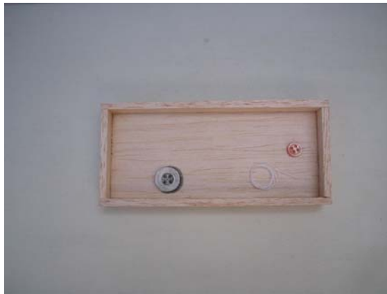
Figura 8. De la Obra Nodriza