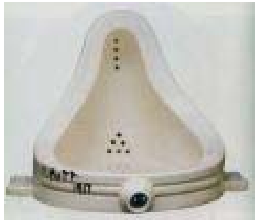
Figura 5. La Fuente.

elección de los objetos, se basaba en una reacción de indiferencia visual, con la total ausencia de buen o mal gusto.