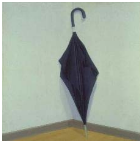
Figura 13. Paraguas

la pintura llega a verse como una abstracción Lo que aprovecha Cárdenas. En seguida, se establece un equilibrio entre el objeto y el espacio (Ver figura 13). Generalmente un rincón o una pared sirven de fondo a la cosa pintada. Para mi obra el interés recae en mirar el manejo del objeto que busco representar lo más real posible; En esto Cárdenas me ayuda a despejar el camino reconociendo que al simplificar las formas y detalles que pueden distraer y la relación con las cajas de madera en que habitan mis objetos son los detalles que forman el conjunto de importancia objetos y modo de hacer. El enriquece su obra con paraguas, sacos, chalecos de sombras que aparecen nítidas.