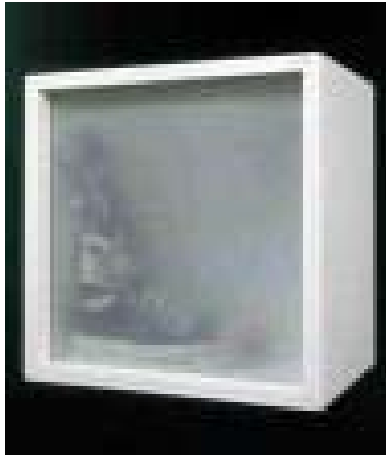
Figura 15. El Mundo en Caja