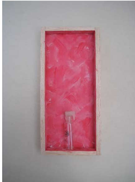
Figura 22. Proceso Nodriza