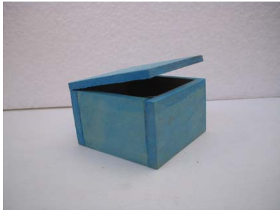
Figura 2. Proceso Nodriz