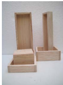
Figura 18. Proceso Nodriz