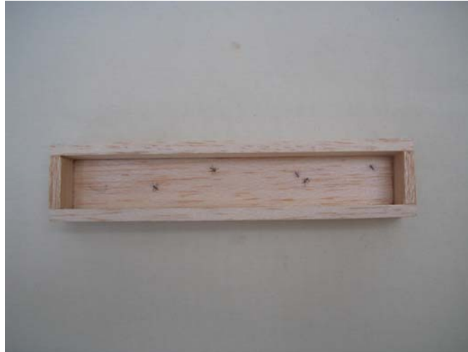
Figura 19. Proceso Nodriza