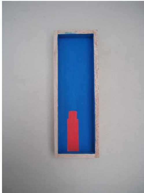
Figura 21. Proceso Nodriza