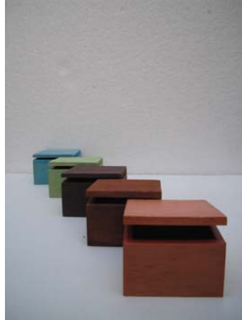
Figura 23. De la Obra Nodriza