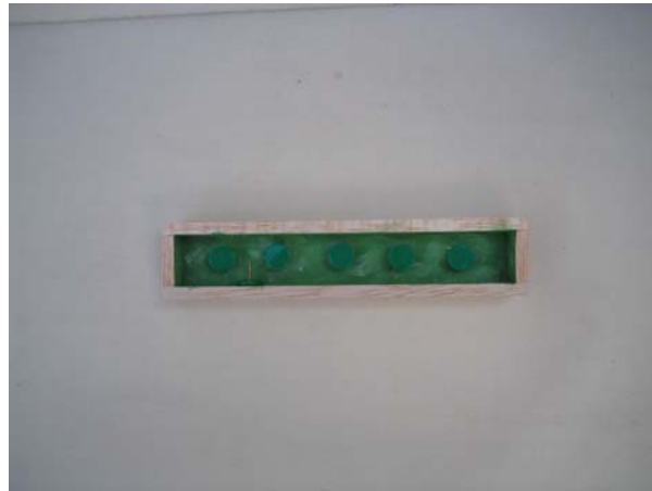
FIGURA 1. De la Obra Nodriza