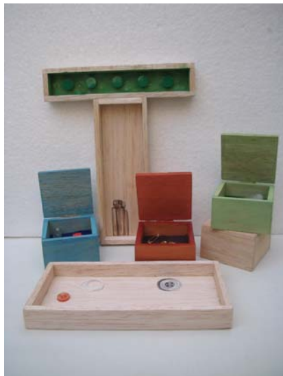
Figura 25. De la Obra Nodriza

Fuente: Banco de Imágenes Daniel Mejía Morón 2.005