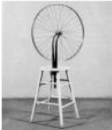
Figura 10. Ready – Mades Duchamp

supone un cambio radical respecto a la concepción de obra de arte como algo a lo que se puede poner punto final al acabar su realización.