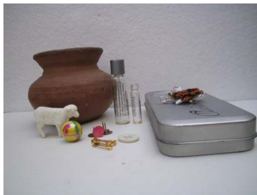
Figura 16. Colección Objetos Daniel