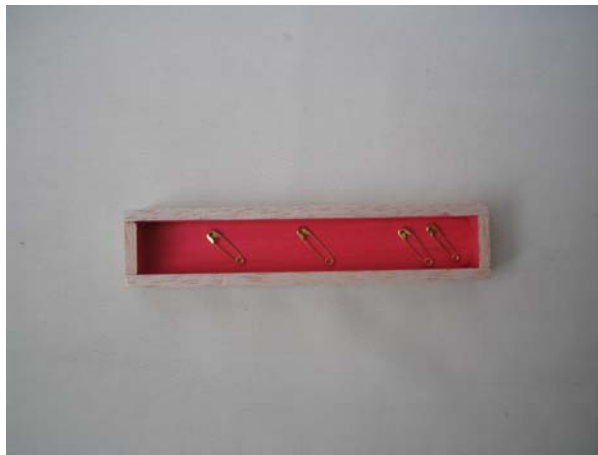
Figura 9. De la Obra Nodriza