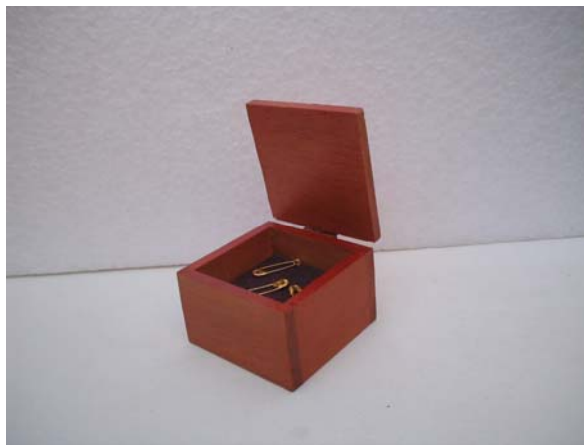
Figura 24. De la Obra Nodriza