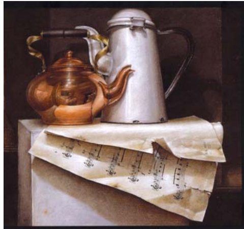
Figura 12. Autorretrato

Fuente: Manzur. Ediciones Gamma. Bogotá, 1.995