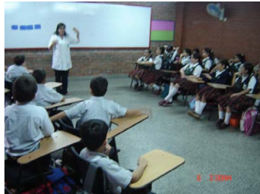
Fotografía 4, se observa el tipo de pupitres y la estructura del salón, así como la posición en que por lo general está ubicada la profesora con respecto a los estudiantes.