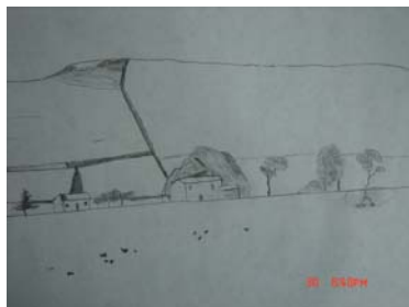
Figura 5. Ejercicio realizado por niños de ocho años

Sin embargo, a pesar de ser el dibujo un instrumento eficaz para la expresión de las ideas, la concepción de la representación gráfica como medio de comunicación que trasciende las barreras lingüísticas no ha sido asimilada por la mayoría de instituciones. Sus sistemas y métodos limitan este desempeño, pues como se señaló con anterioridad, al manejar un libro como guía limitan sustancialmente el desarrollo de experiencias. Como lo plantea Pevsner: “Dibujar de dibujos, dibujar de modelos, dibujar del natural: estas tres etapas son las mismas en Leonardo, Zuccari, Le Brun o los neoclásicos” 104