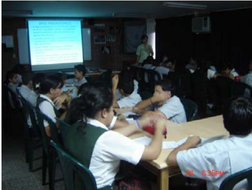
Fotografía 1, se observa una clase de historia del arte, para la cual, los niños se desplazan a la biblioteca, en donde se les proyecta imágenes por medio del Video Bin.