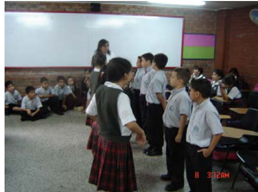
Fotografía 2, se observa una clase de artes y el espacio del salón, el cual es igual en todos los grados y es compartido por primaria y secundaria en distintas jornadas.