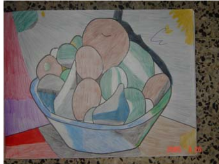
Figura 2. Ejercicio contenido en el libro de artes y realizado por un niño de Basica Primaria