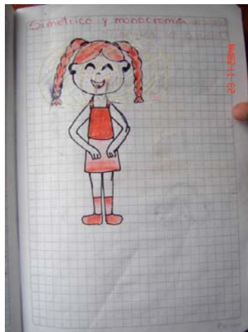
Figura 15. Dibujo realizado por un niño de básica en donde se observa la influencia de los medios masivos de comunicacion en su forma de expresion