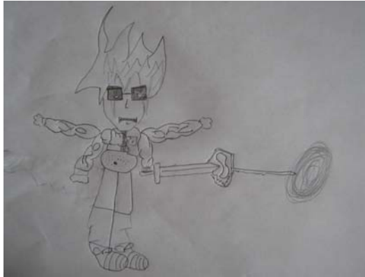
Figura 17. Dibujo realizado por un niño de básica en donde se observa la influencia de los medios masivos de comunicacion en su forma de expresion