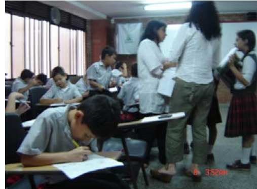
Fotografía 5 y 6, dinámica de una clase de artes plásticas.

Imágenes de trabajos realizados por niños y niñas de primaria y básica secundaria.