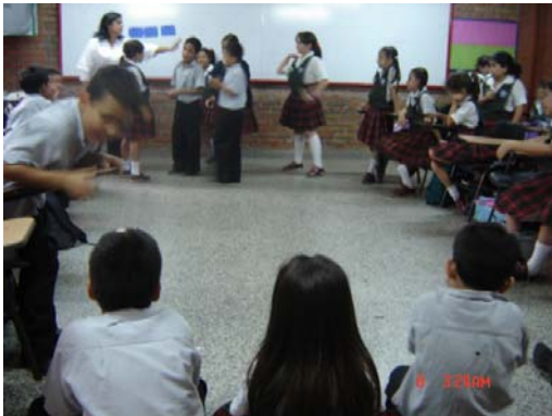
Fotografía 3, se observa cómo suelen organizarse los estudiantes para la clase de artes: en medio círculo.