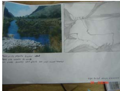
Figura 7. Ejercicio realizado por niños de nueve años