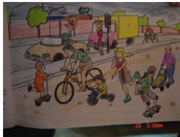
Figura 8. Ejercicio realizado por niños de doce años