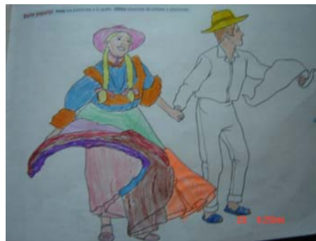
Figura 10. Dibujo realizado por un niño de Basica primaria en donde el color es punto de partida para la libertad de expresion.