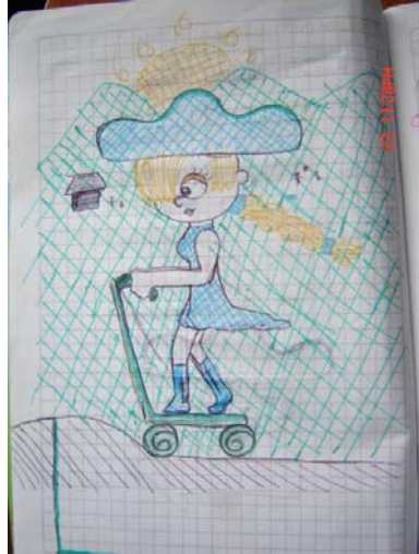
Figura 13. Dibujo realizado por un niño de basica en donde se observa la influencia de los medios masivos de comunicacion en su forma de expresion