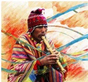
Foto 20. Quena

Fuente: http://www.fundacionbat.com.co/noticia.php?idnot=536