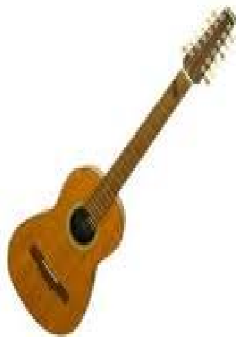
Foto 11. Tiple Requinto

Fuente: http://www.lacolonial.com.co/catalogo.cfm?PageNum_Guitarras=13&Categoria=2