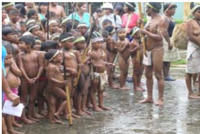
Foto 2. Comunidad indígena.

Fuente: http://www.laprensaus.com/interna.php?cont=3512