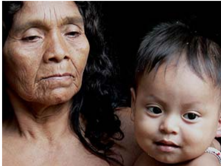
Foto 4. Generaciones indígenas.