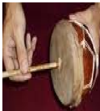
Foto 22. Zambombia

Fuente: http://kuntur_huasi.en.eresmas.com/instrumentos/bombo.htm