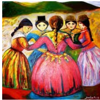
Foto 31. Danza