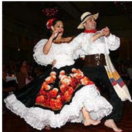
Foto 26. Bambuco