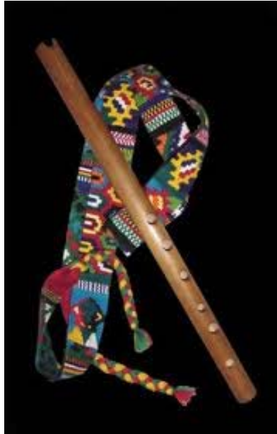
Foto 15. Flauta de Carrizo

Fuente: http://www.andeansoul.net/portal/index.php?option=com_content&view=article&id=51&Itemid=64&layout=default&date=2011-01-01