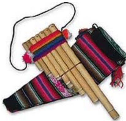
Foto 18. Zampoña