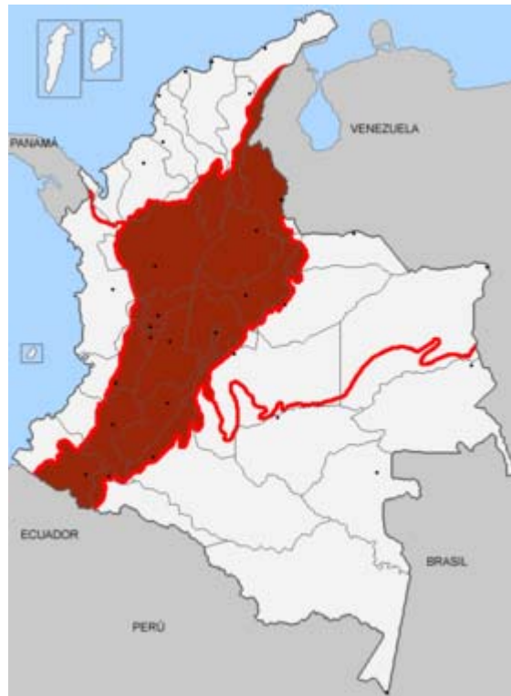
Foto 9. Zona Andina.