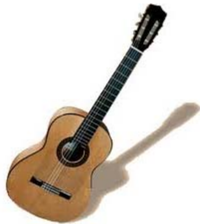
Foto 13. Guitarra

Fuente: http://www.taringa.net/posts/offtopic/6421468/Lo-que-tenes-que-saber-del-Dia-del-Nino_.html