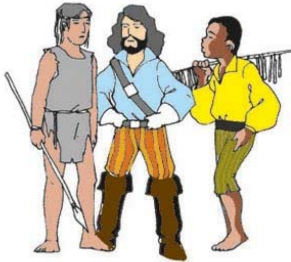
Foto 7. Razas.

Fuente: http://www.fundacionbataller.org.a