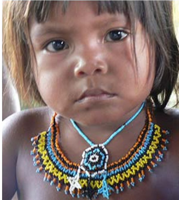
Foto 3. Niño indígena.