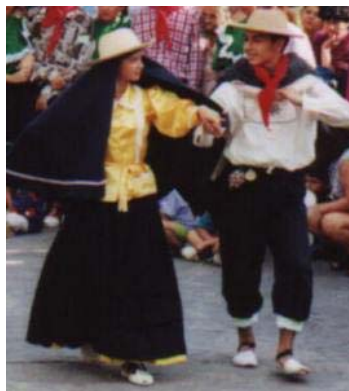
Foto 32. Bunde Tolimense

Fuente: http://www.calabria.nu/colombia/santander/Giron/tabacco.htm