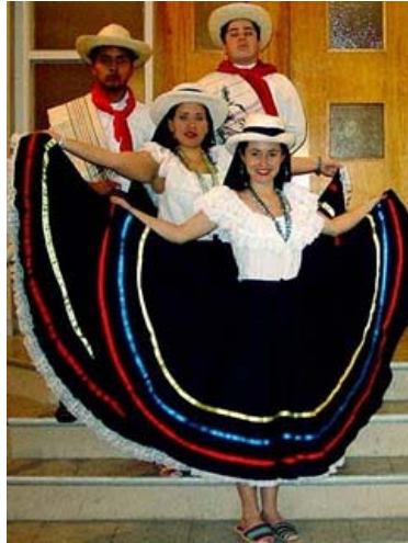
Foto 28. Pasillo Fiestero