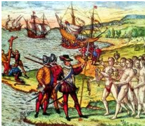
Foto 6. Lucha de razas.

Fuente: http://www.farinez.com/labels/Mayas.html