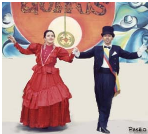
Foto 27. Pasillo Lento

Fuente: http://www.google.com.co/imgres?imgurl=http://usuarios.multimania.es/elfolklorcolombiano