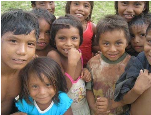
Foto 1. Niños indígenas.

Fuente: http://www.laprensaus.com/interna.php?cont=3512