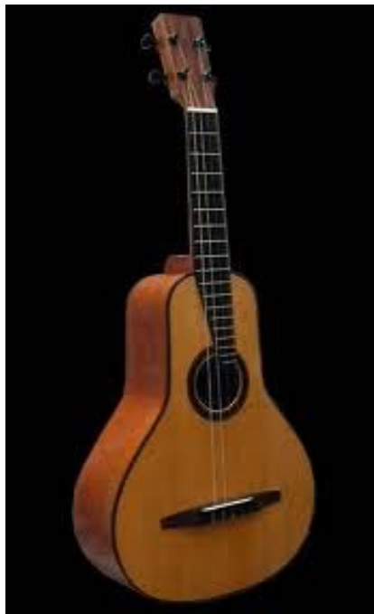
Foto 14. Bandola

Fuente: http://www.elescaparate.com.ve/category/sonidos-venezolanos/