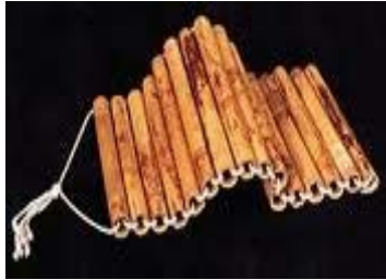
Foto 23. Esterilla