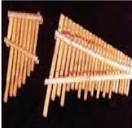
Foto 17. Capador o Rondador

Fuente: http://www.fundacionbat.com.co/noticia.php?idnot=530