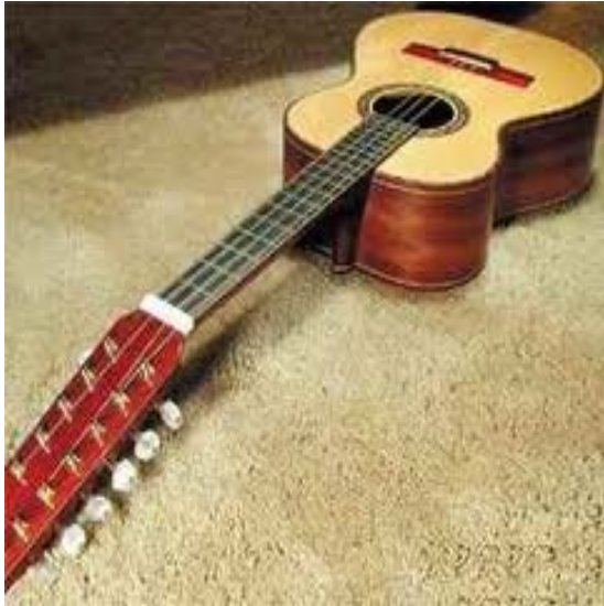
Foto 10. Tiple

Fuente: http://www.trovapaisa.com/r/i/i.php