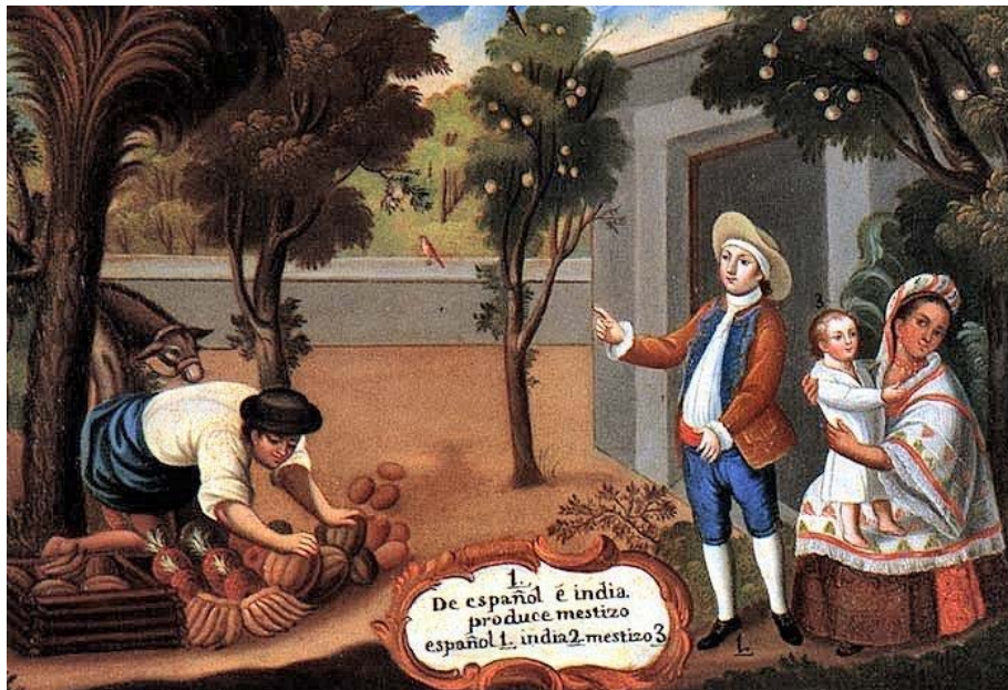
Foto 8. Amalgama de razas.

Fuente: http://www.fundacionbataller.org.a