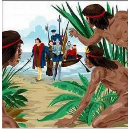
Foto 5. Invasión Española.