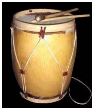
Foto 21. Bombo Andino

Fuente: http://kuntur_huasi.en.eresmas.com/instrumentos/bombo.htm