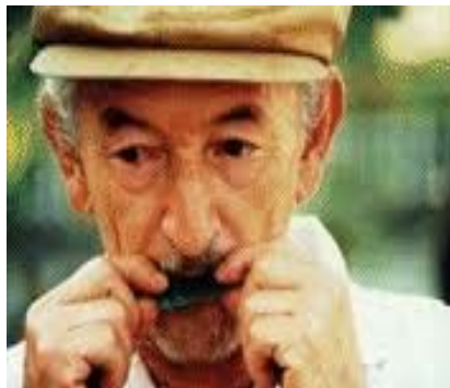
Foto 19. Hoja Vegetal

Fuente: http://www.fundacionbat.com.co/noticia.php?idnot=536