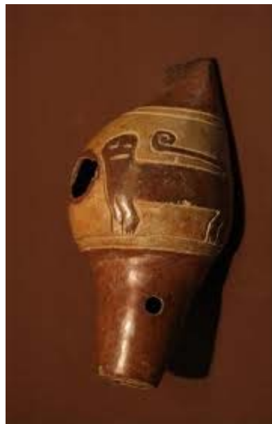
Foto 16. Ocarina

Fuente: http://www.andeansoul.net/portal/index.php?option=com_content&view=article&id=51&Itemid=64&layout=default&date=2011-01-01