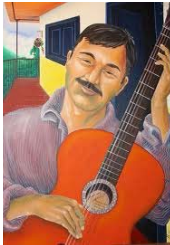
Foto 12. Guitarra