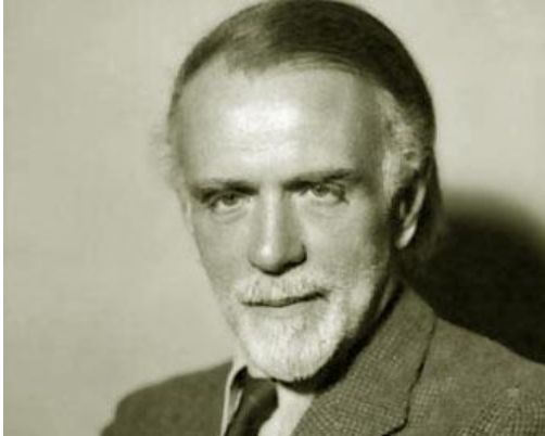
Figura 3. Zoltan Kodaly