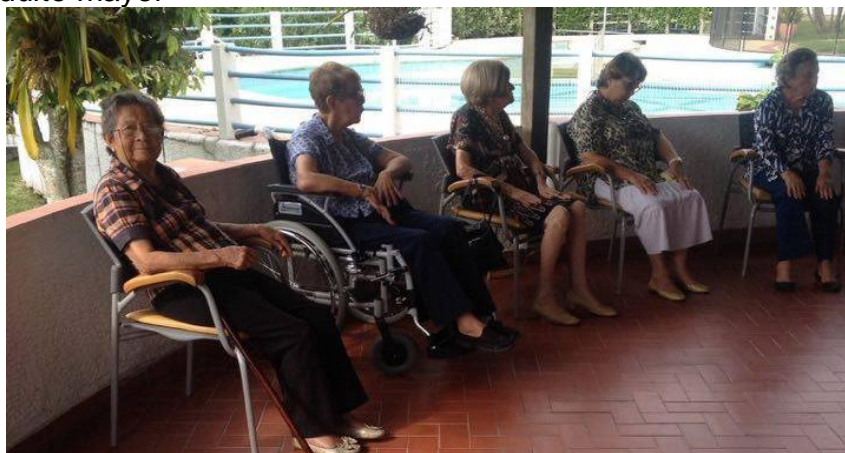
Figura 1. Adulto mayor

2.1.1 Adulto mayor. Según la (OMS) Organización Mundial de la Salud es la Población mayor de 60 años o más, según los especialistas pueden ingresar en este grupo las personas mayores de 55 años que su decadencia, física, psicológica o vital así lo determinen.