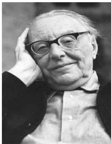
Figura 4. Carl Orff