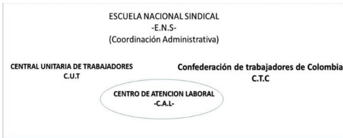
Figura 1. Descripción de la empresa

Dentro de la descripción previa de la organización en la cual desarrollaré la práctica social, cabe mencionar que el centro de atención laboral (CAL), hoy es un proyecto pensado por las principales centrales sindicales de nuestro país, como lo es la Central Unitaria de Trabajadores (CUT) y la confederación de trabajadores de Colombia (CTC), así como del direccionamiento de organizaciones no gubernamentales como la Escuela Nacional Sindical (ENS), quienes preocupados por las diversas problemáticas laborales que aquejan nuestro país, así como la continua violación de derechos colectivos de los trabajadores asociados han decidido unirse con el fin único de proteger los derechos laborales.