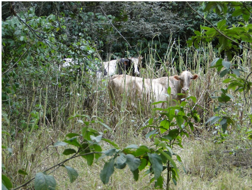
Figuras 1 y 2. Estas vacas lecheras son ordeñadas temprano en la mañana, y su leche se vende a la ciudad de Bucaramanga por un precio muy bajo comparado con el precio del mercado. Son llevadas de un potrero a otro a medida que consumen el pasto del lugar.