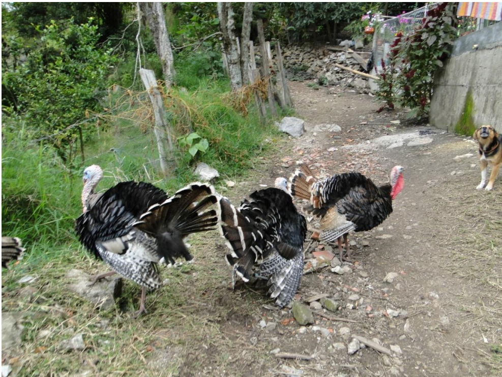
Figuras 7 y 8. Los pavos también son criados para consumo, y pasan su vida en condiciones naturales o en establos, en que pueden satisfacer a cabalidad sus necesidades básicas, similares a las de las gallinas y gallos.