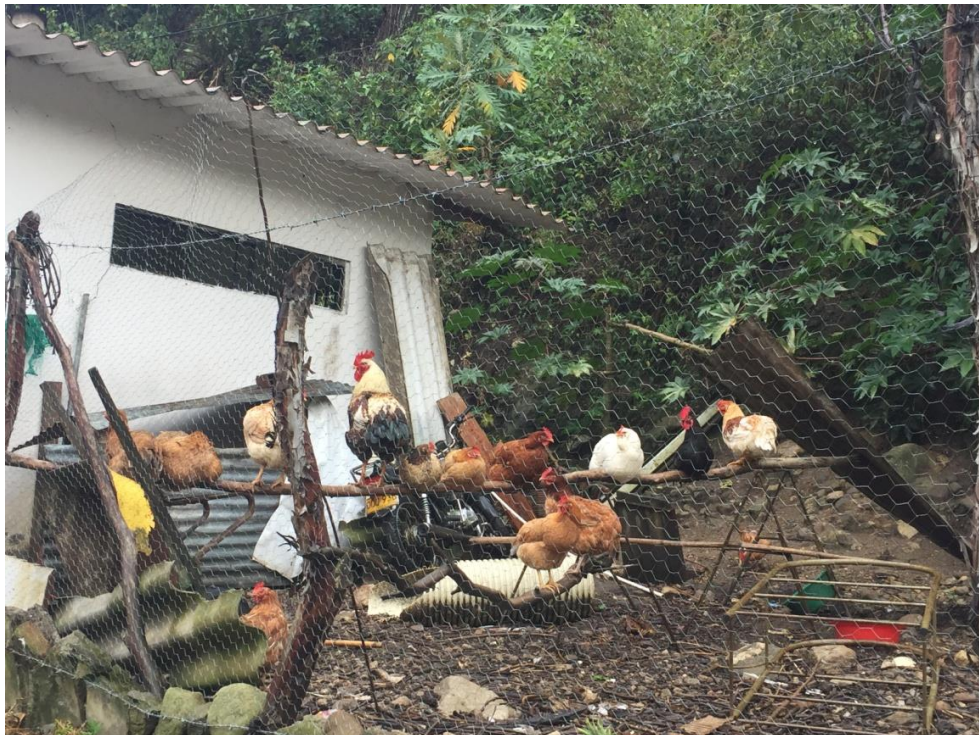
Figuras 4 y 5. Las gallinas y gallos son mantenidos en un estado muy parecido al natural, en el que pueden acicalarse, escarbar y reposar. Son alimentados con maíz, pasto y cáscaras de verduras, y los huevos puestos en nidos de paja u hojas secas de helecho.