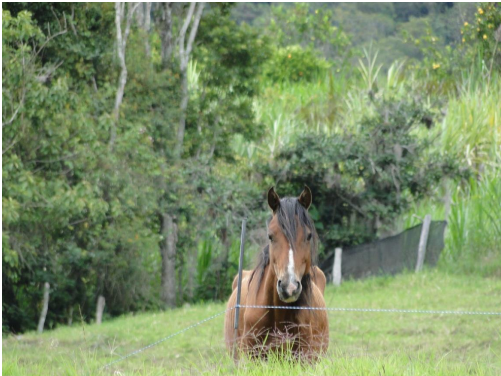
Figuras 9 y 10. Los caballos, yeguas y mulas habitan comúnmente en las condiciones naturales de las fincas de sus dueños. Pastan y reposan según sus necesidades, como una parte de sus vidas.