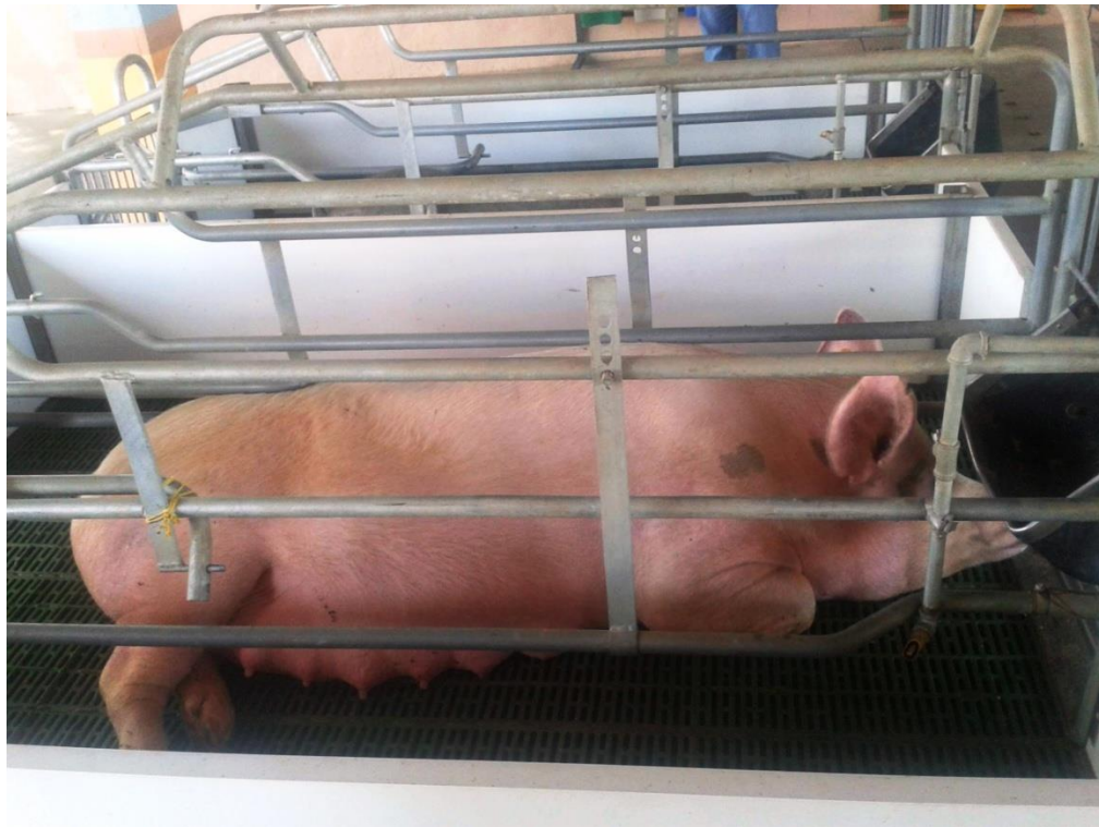
Figura 12. Fotografía tomada en el Parque Nacional de la Cultura Agropecuaria (PANACA), que muestra a una cerda inmovilizada para proporcionar leche a sus crías. Puede permanecer en ese estado durante horas, sin ninguna paja que le permita recostarse cómodamente. Muerde los barrotes como señal de aburrimiento.