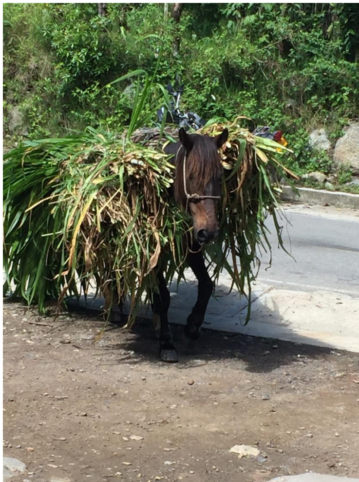
Figura 11. La otra parte de sus vidas se les va transportando pesadas cargas, puestos al servicio del humano, quien a veces no considera su cansancio y los expone a fracturas o malestares musculares.