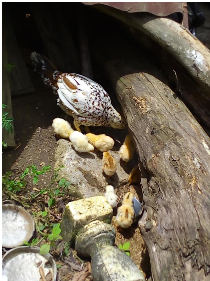
Figura 6. También las gallinas suelen compartir con sus polluelos hasta que estos han aprendido el comportamiento básico para sobrevivir, ayudados también por sus instintos heredados.