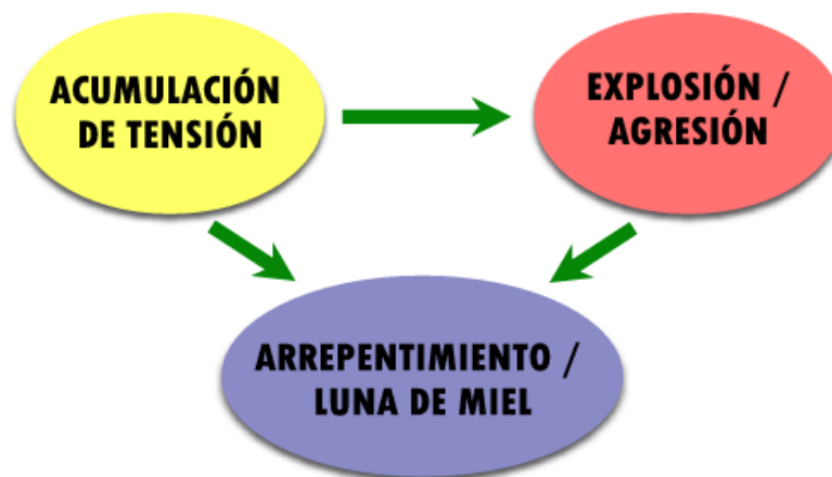
Figura 3. Fases del Ciclo de la Violencia