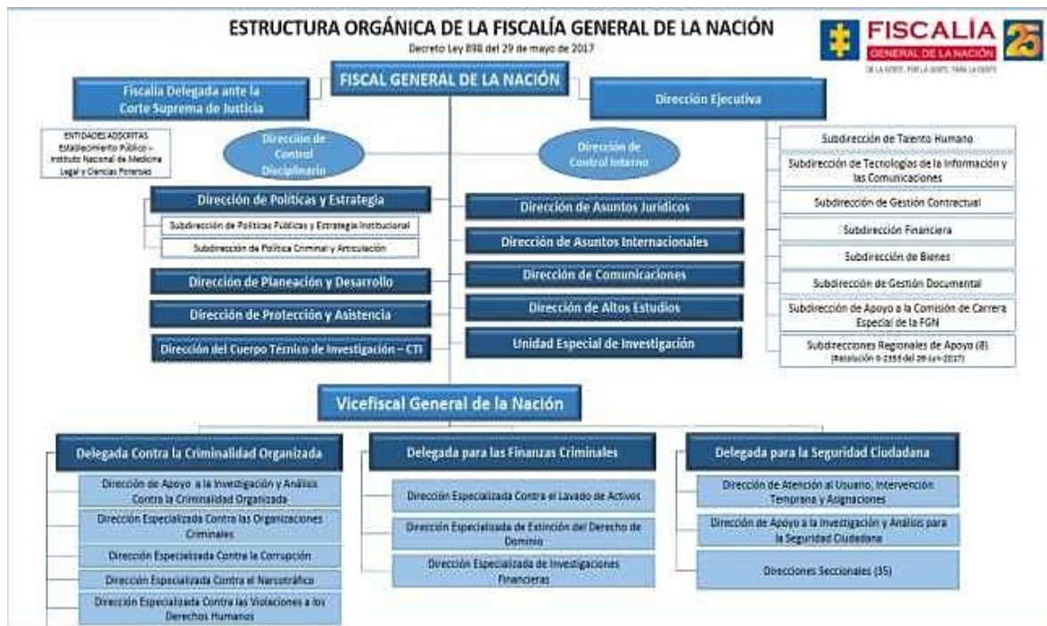
Figura 2. Organigrama