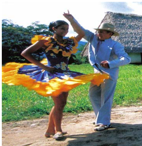
Foto 8. Pareja danzando Joropo, baile típico llanero (Casanareño).