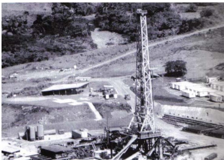
Foto 5. Inicios complejo petrolífero de Cusiana, Casanare.

Fuente: Documental, Casanare, Memorias y Destino. 2005