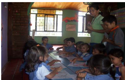
Foto 3. Madre Comunitaria desarrollando momento pedagógico en el HCB