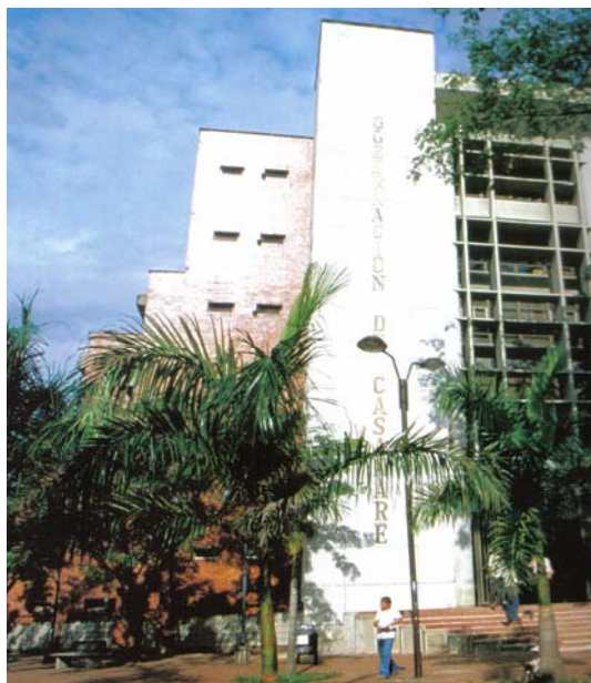
Foto 4. Edificio Administrativo, Gobernación de Casanare

Fuente: Documental, Casanare, Memorias y Destino. 2005