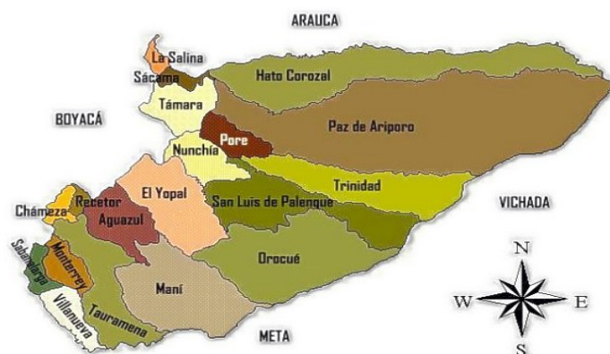
Mapa 2. División Política de Casanare