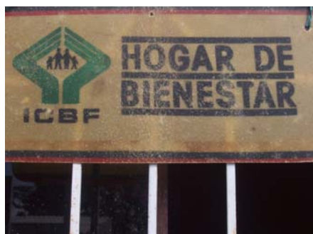
Foto 1. Placa identificativa de los Hogares Comunitarios del ICBF