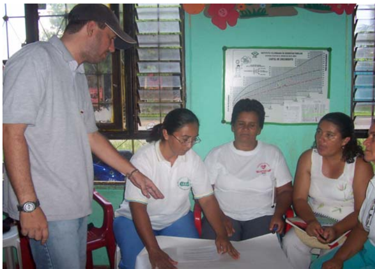
Foto 17. Planeación del Trabajo a Desarrollar, Chámeza

Segunda Fase: se lleva a cabo la programación en la cual se estructura el proceso de intervención teniendo como base los resultados del diagnóstico, la población y el contexto, implementando para este proceso la planeación estratégica, teniendo como base la matriz Dofa, aplicada en la primera Fase de Diagnóstico.