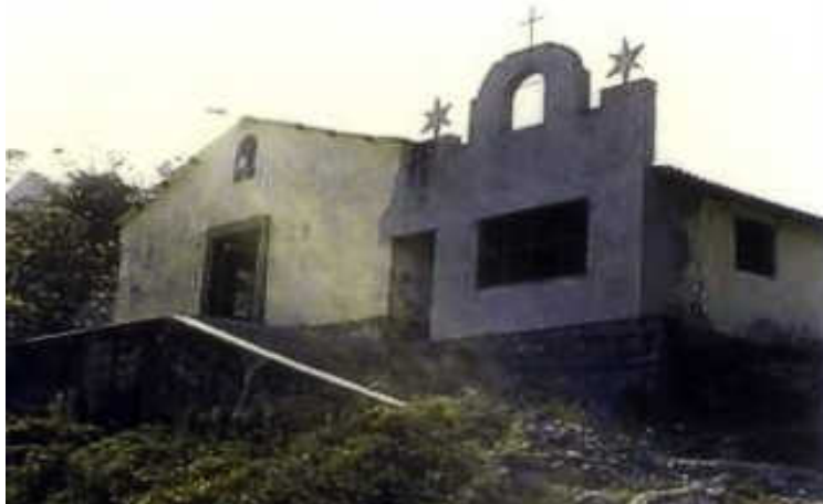
Foto 11. Panorámica iglesia de Recetor.

Fuente: Oficina de Planeación, Recetor 2005