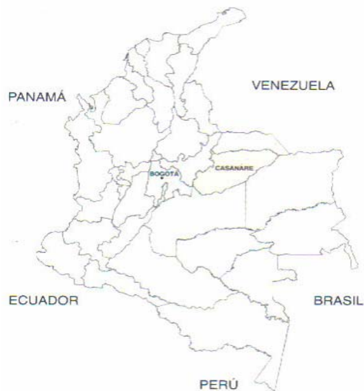
Mapa 1. Ubicación geográfica de Casanare