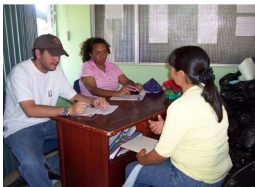
Foto 16. Entrevista con Madres Comunitarias, Chámeza

Fuente: Oficina de Acción Social, Chámeza. 2006