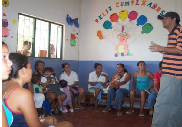
Foto 15. Grupo de Padres de Familia Hogar Comunitario, Recetor

Fuente: Secretaria de Desarrollo Social, Recetor. 2006