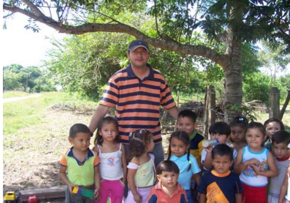
Foto 14. Grupo de beneficiarios Hogar Comunitario, Chámeza

Fuente: Oficina de Acción Social, Chámeza. 2006