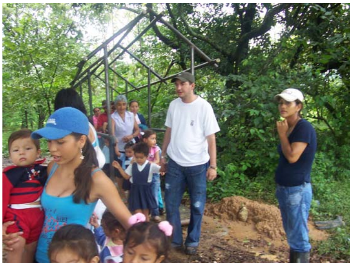
Foto 18. Salida Pedagógica con Hogar Comunitario, Recetor