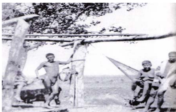
Foto 6. Asentamiento de Indígenas Guahibos.

Fuente: Documental, Casanare, Memorias y Destino 2005