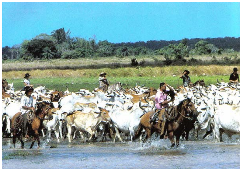
Foto 7. Llaneros arriando ganado, sabanas del Casanare.

Fuente: Documental, Casanare, Memorias y Destino. 2005