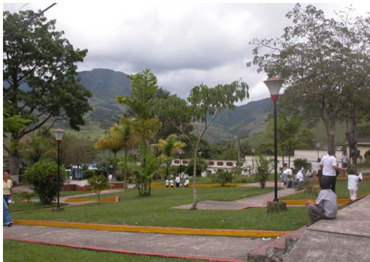
Foto 10. Panorámica del parque principal de Chámeza.

la variadísima fauna y flora, es una invitación para ir a recorrer el enigmático territorio 53 .