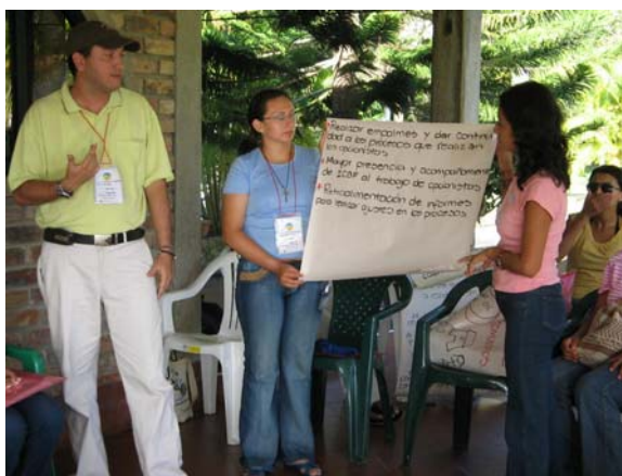
Foto 19. Reunión de Evaluación Final, Yopal

Fuente: Corporación Opción Colombia. 2006