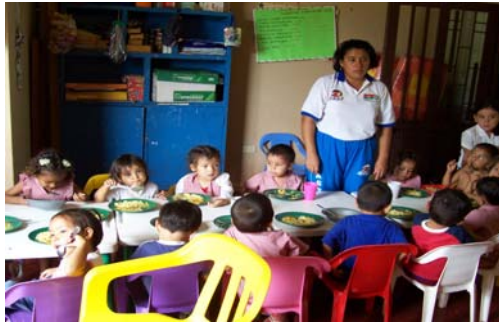
Foto 2. Madre Comunitaria acompañando a los niños a tomar sus alimentos