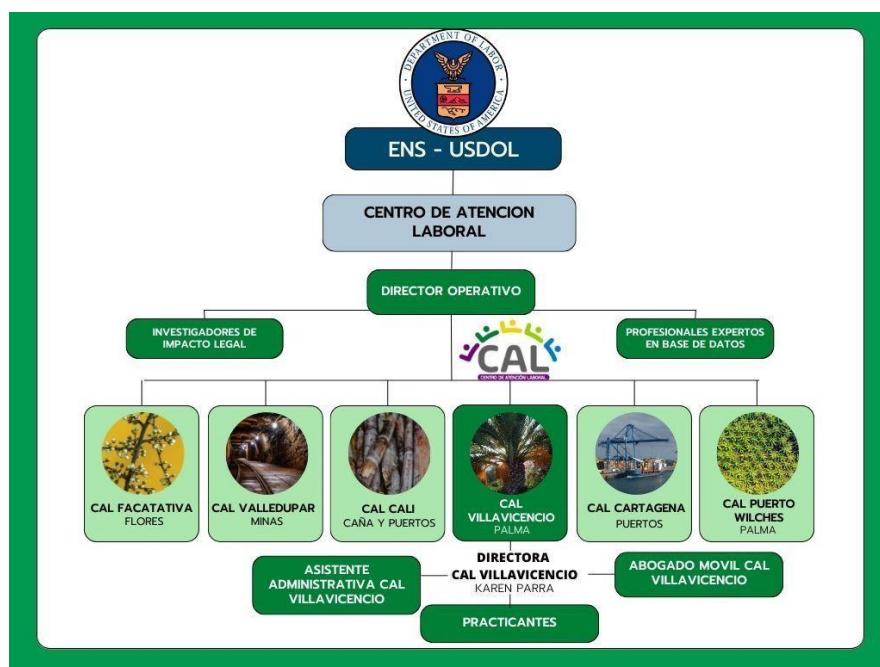
Figura 2. Organigrama de la entidad.