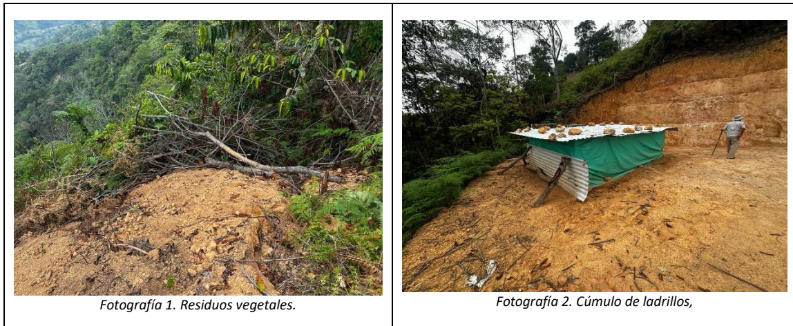
Fotografía 1. Residuos vegetales.