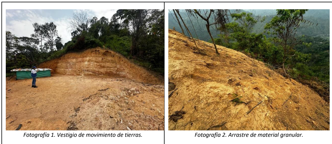
Fotografía 1. Vestigio de movimiento de tierras.

A continuación, se presenta registro fotográfico como resultado de lo evidenciado al momento de la visita técnica: