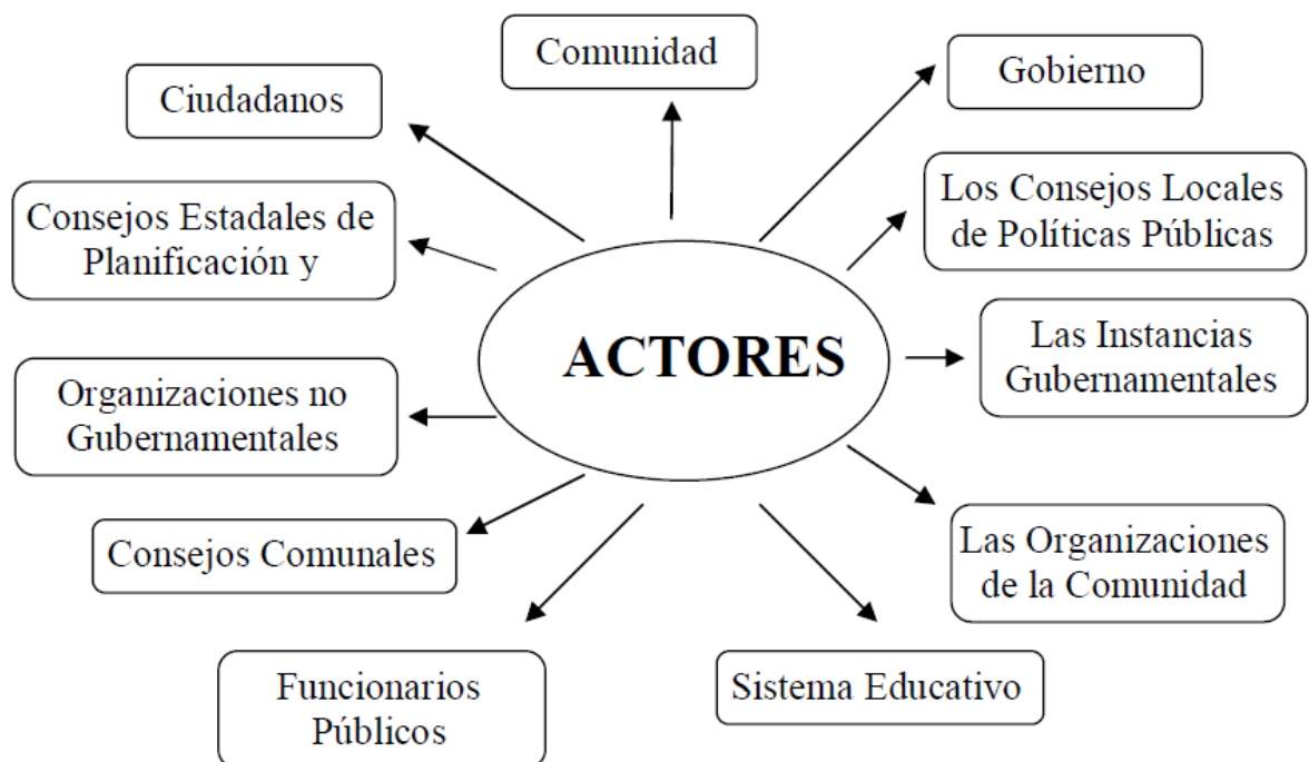
Figura 2: Diagrama de participación de los actores sociales