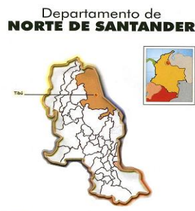
Mapa 1. Departamento Norte de Santander

Para lograr una mayor ubicación en el contexto local del Corregimiento de Campo Dos, Municipio de Tibú, Norte de Santander, es necesario circunscribir los aspectos más relevantes de su dinámica en el ámbito regional del cual hace parte importante: La Región del Catatumbo.