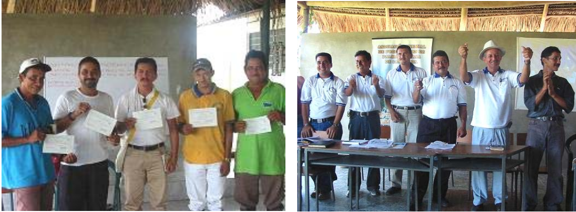
Fotografía 7. Grupo de líderes que iniciaron su proceso de capacitación

Con este plan de capacitación se pretende: