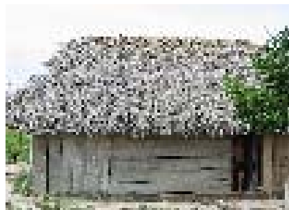
Foto 4. Vivienda en tabla y paja

La gran mayoría son construcciones pequeñas con uno o dos dormitorios, siendo una limitante para la intimidad de las personas que la habitan, por pasan a