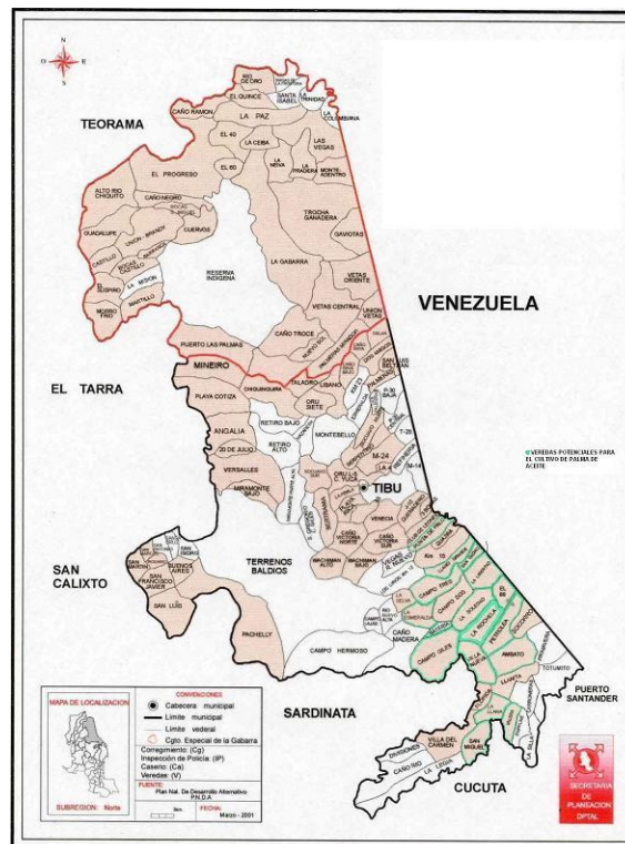
Mapa 2. Municipio de Tibú – Departamento Norte de Santander

El proceso organizativo de la referencia se está llevando a cabo en el Corregimiento Reyes Campo Dos, el cual esta conformado por 37 veredas y los miembros de la Asociación Gremial de Productores de Palma Africana de Campo Dos – ASOGPADOS se encuentran ubicados en nueve de éstas veredas: Villa Nueva, La Soledad, La Libertad, Puerto Reyes, La Batería, Campo Giles, La Galicia, Los Naranjos y Llano Grande.