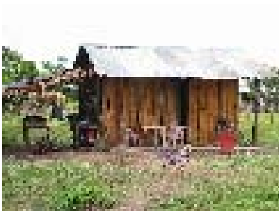
Foto 3. Vivienda en tabla y zinc

3.4.7 Vivienda y Servicios Públicos. Las condiciones climáticas y el nivel económico de la zona han impulsado la construcción y el mantenimiento de viviendas hechas en paredes de tabla y/o bahareque, techo en paja y piso en tierra; en algunos casos se encuentra la vivienda construida en ladrillo, teja de zinc y piso en cemento.