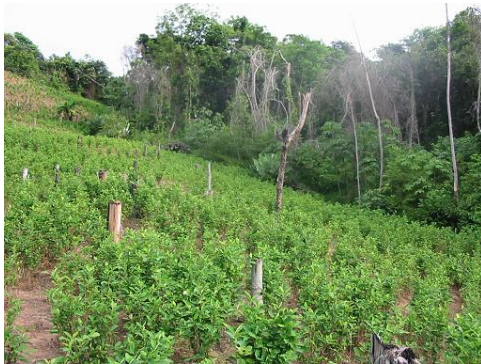
Foto 1, Cultivos de cocaína

3.4.4 Aspecto socio – económico. En la región del Catatumbo predomina la economía campesina minifundista con una producción destinada básicamente al autoconsumo, sin generar excedentes económicos representativos.