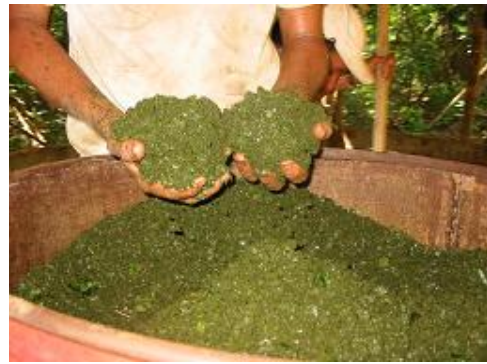
Foto 2. Hoja de coca procesada

Los cultivos tradicionales de la economía regional como el plátano, el cacao, el maíz y el arroz entre otros, poco a poco han ido perdiendo su estabilidad en el