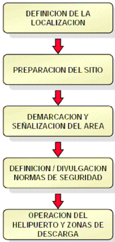
Figura 2. Construcción y operación de helipuertos.

A continuación se sugieren las preguntas básicas que se deben tener en cuenta durante el desarrollo de esta actividad: