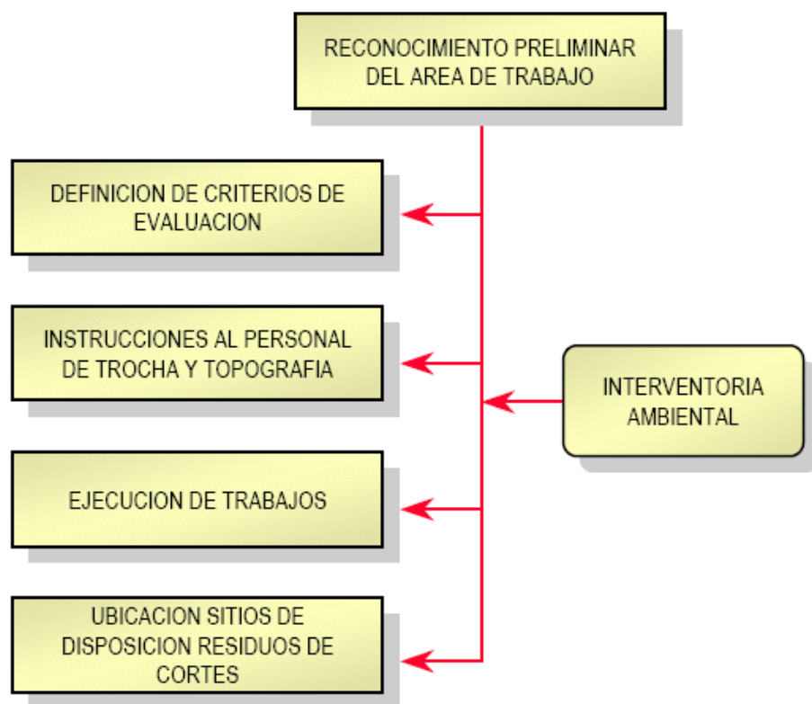
Figura 3. Gestión Ambiental para la apertura de Trochas.

Esta actividad está contemplada en las guías ambientales de Exploración sísmica terrestre con el objetivo de Definir normas mínimas recomendables para la apertura de trochas, de conformidad con las buenas prácticas de manejo ambiental. Incluye también el manejo y disposición de los residuos (cortes de vegetación) generados al realizar esta actividad.