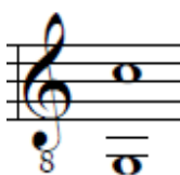
Figura 7. Rango de la canción Llévate