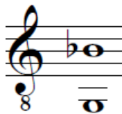
Figura 15. Rango de la canción A nadie