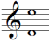
Figura 1. Rango de la canción A mi abuelo