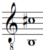
Figura 12. Rango de la canción Aunque el tiempo pase