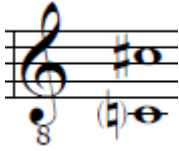
Figura 4. Rango de la canción Inventario