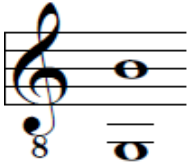
Figura 8. Rango de la canción Hasta el final de mi tiempo .