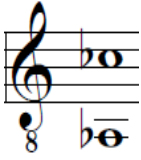
Figura 13. Rango de la canción Si vuelvo a enamorarme