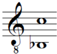
Figura 6. Rango de la canción Sin Testigos