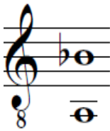
Figura 10. Rango de la canción Capricho Juvenil