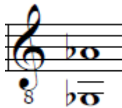
Figura 3. Rango de la canción Bambuquero