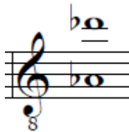
Figura 5. Rango de la canción Rumores