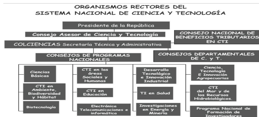
Figura 1. Organismos del Sistema nacional de ciencia, tecnología e Innovación en Colombia