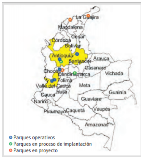
Figura 2. Localización de parques tecnológicos en Colombia según su estado de desarrollo