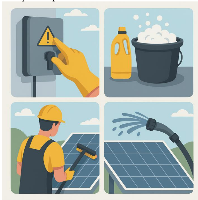
Figura 3. Limpieza paso a paso de paneles solares.

Nota. Imagen elaborada por inteligencia artificial con asistencia de ChatGPT (OpenAI, 2025).