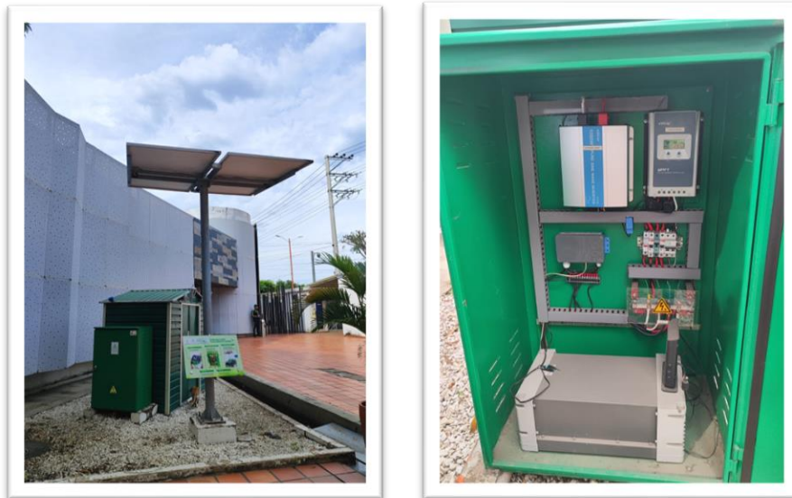
Figura 2. Esquema de conexión solución solar fotovoltaica aislada

A continuación, se presenta un prototipo de conexión usado en 282 soluciones solares fotovoltaicas que fueron instaladas por el gobierno nacional en ZNI del área de influencia de CENS, donde se evidencian las partes que componen el módulo solar.