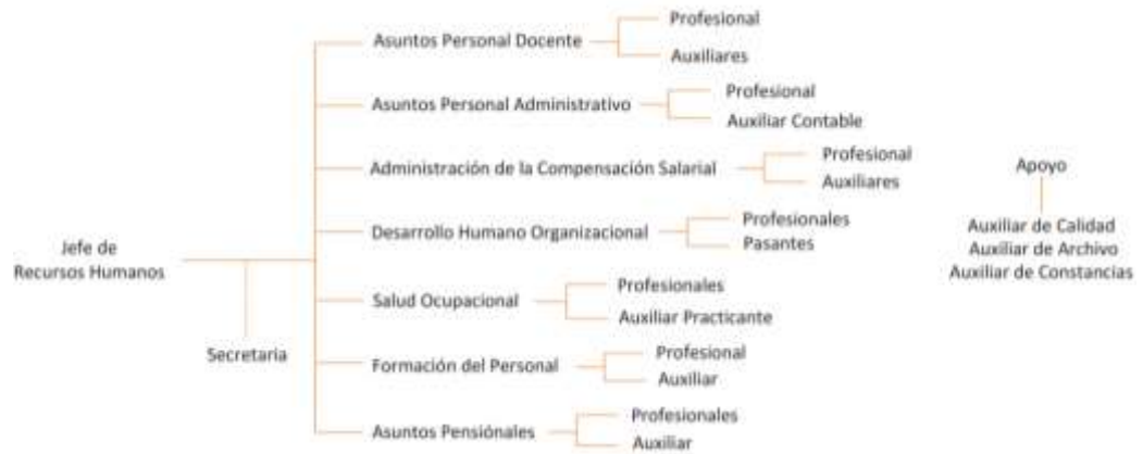
Gráfica 3. Estructura organizacional de la división de recursos humanos