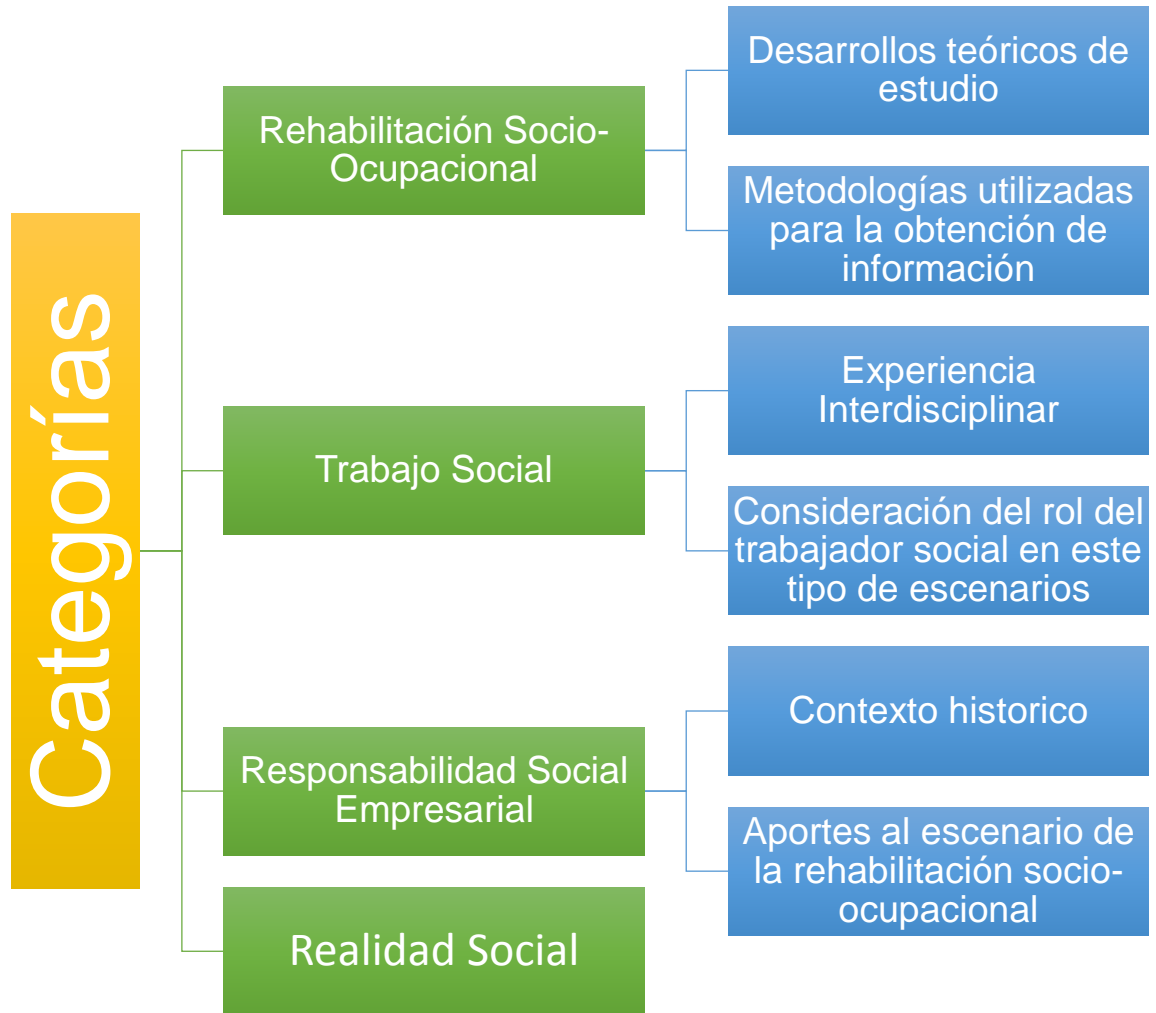
Figura 2. Matriz Categorial

Respecto a las categorías de estudio se propone la investigación desde tres ejes centrales: Rehabilitación Socio Ocupacional, Trabajo Social y Responsabilidad Social Empresarial, de los cuales se emanan seis subcategorías, que describen, analizan y sintetizan la información obtenida de las distintas fuentes referenciadas en este informe.