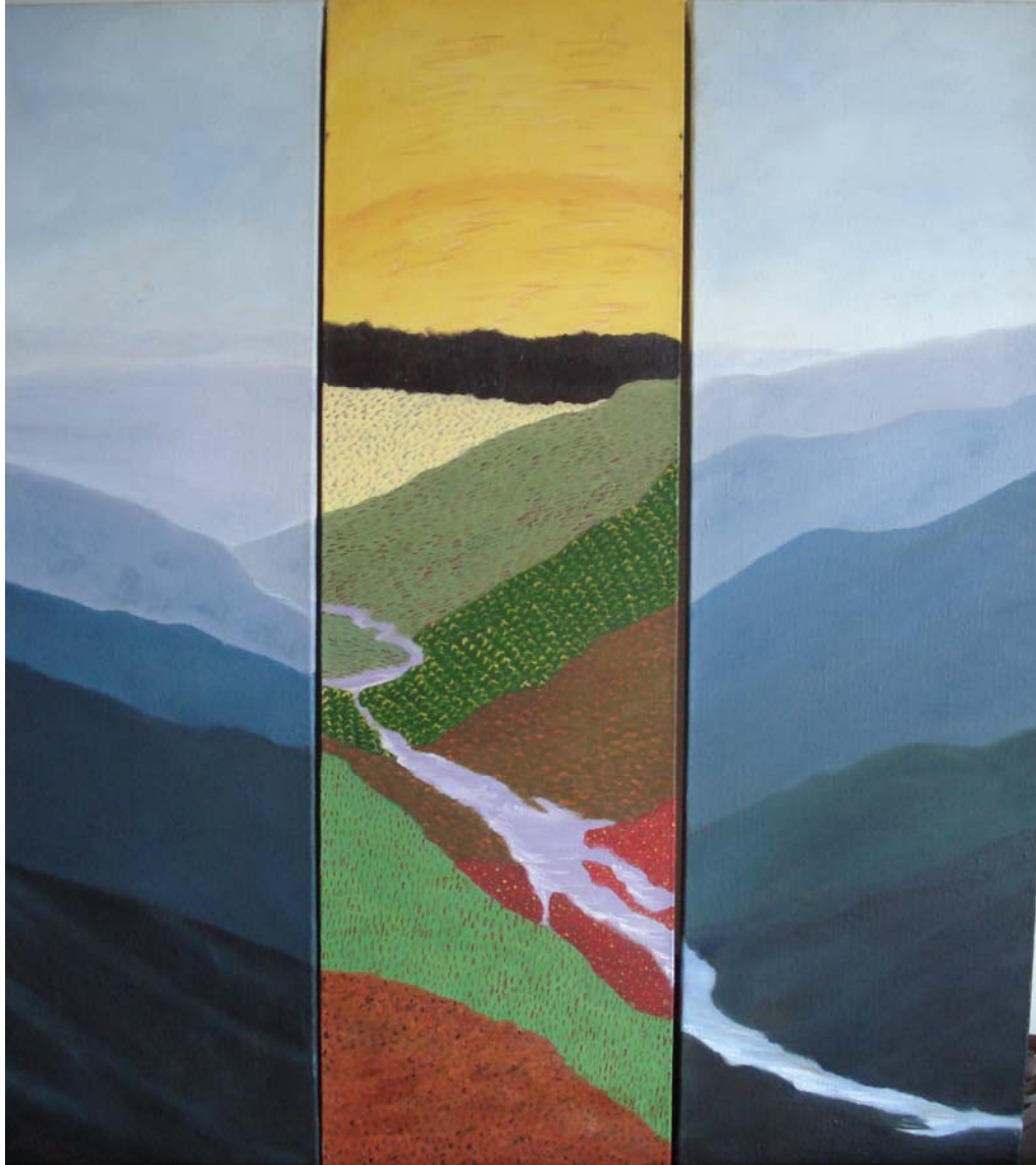
Figura 4. Vivientes en el Corazón del Chicamocha. 2004