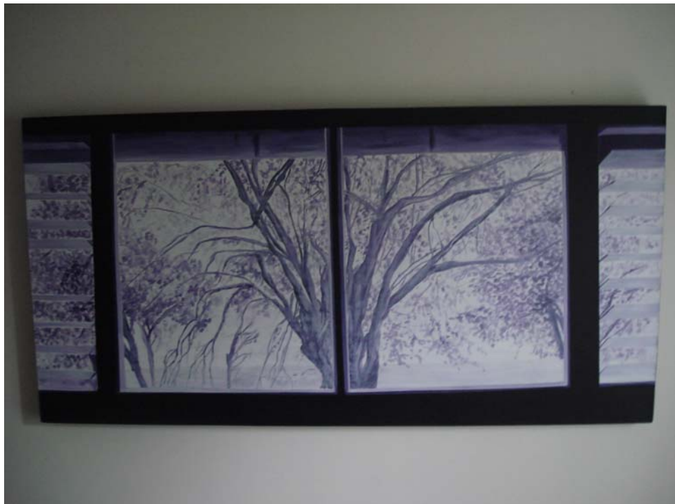
Figura 6. Espíritu. 2006

En ese semestre la clase fue dada en un salón de Diseño y un gran árbol se podía contemplar a través de la ventana; como un gigante nos observaba, dándonos su frescura y su sombra, en forma silenciosa. Sus ramas extendidas como brazos nos saludaban dando una tranquilidad protectora.