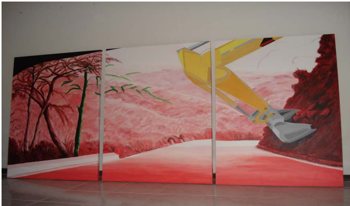
Figura 9. Recordando el camino a California. 2008

que producirá un sabor agrio, marcado por su negro sello de muerte y luto, al destruir la montaña. Los diferentes matices del rojo se apoderan de la obra; con el blanco para embellecer especialmente la montaña y volver el recuerdo casi un sueño; en tanto que al afianzar su pureza resalta su posición agresiva.