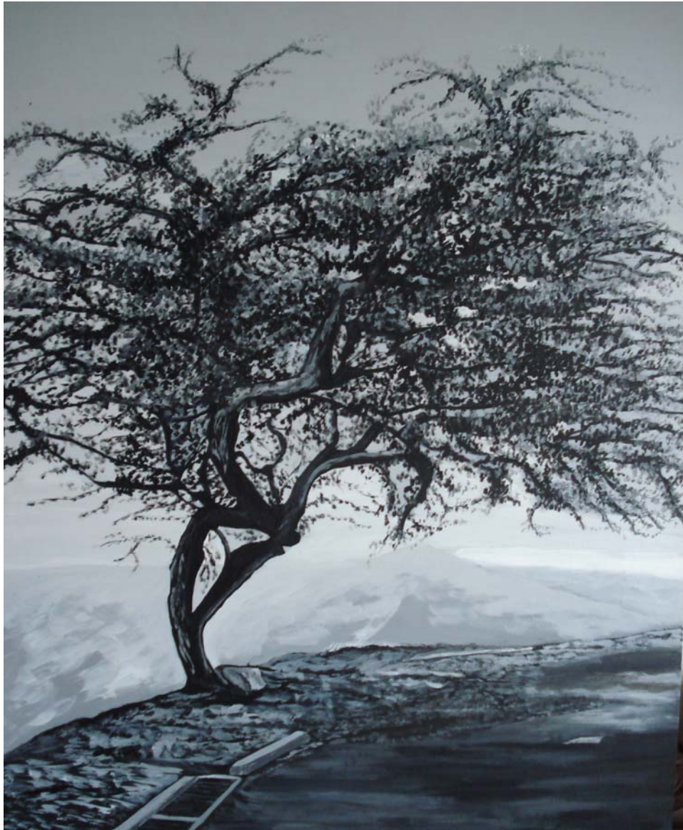
Figura 7. El invisible. 2006