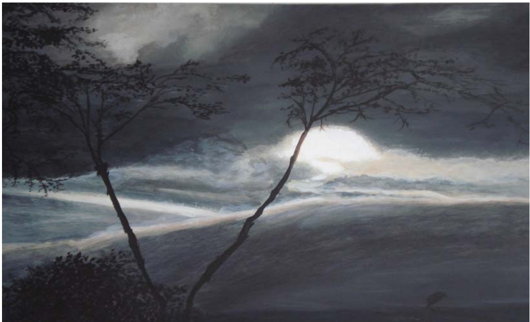
Figura 5. Adiós al día. 2006

Particularmente en este semestre la influencia del paisaje se manifestó al seleccionar la temática. Al caer la tarde mientras nos dirigíamos a salir de la universidad, la belleza del paisaje que en forma casi unicolor se dibujaba frente a los ojos del espectador para despedirlo, ratificó la cercanía de la autora con la naturaleza y los sentimientos que ella despertaba; de allí surgió el primer trabajo de expresión pictórica.