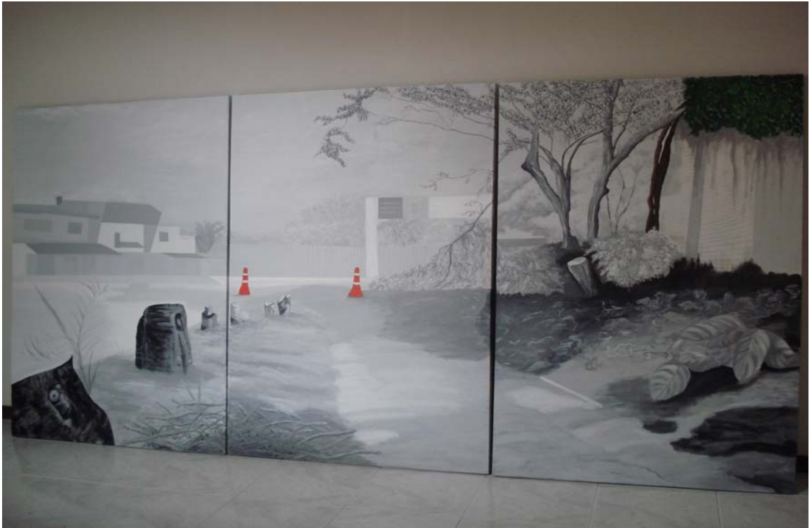
Figura 11. Recordando a Bucaramanga. 2008