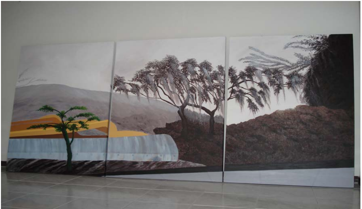
Figura 8. Recordando a Matanza. 2008

color de lo marchito y lo descompuesto, pero también el color del sabor mas fuerte, como el café, el te y el cacao. La exuberancia del paisaje que enriquece las montañas, árboles y arbustos contrasta con la magnitud de la cuchilla que con su color y poderío actúa como verdugo de la naturaleza para decapitar hasta el último sobreviviente. El color amarillo y las manchas en su cuerpo mecánico, hablan del peligro que acecha, pero la desolación es la única respuesta.