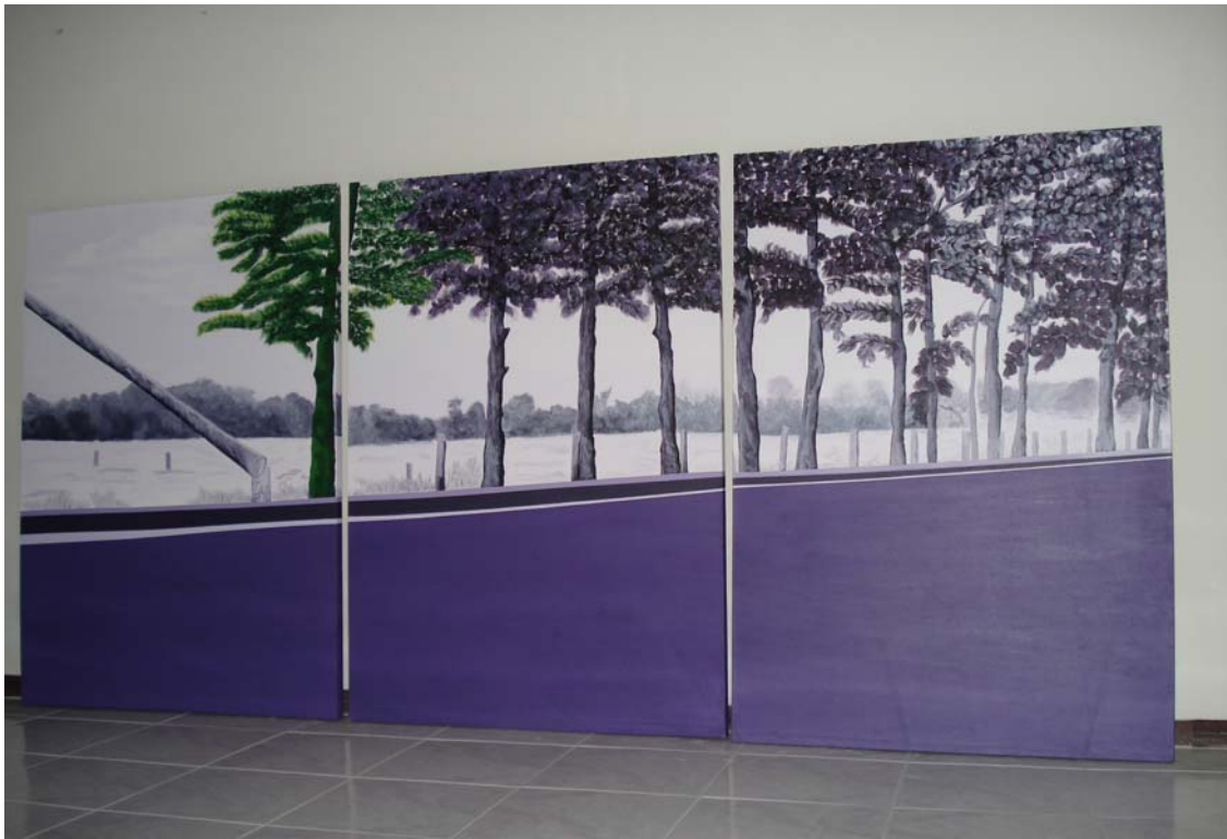
Figura 10. Recordando a Barranca. 2008