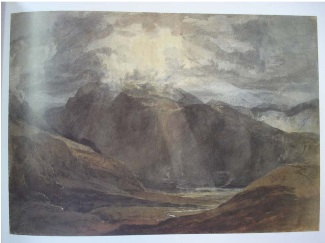
Figura 2. William Turner: Paisaje con río y bahía al fondo. Entre 1840-1850

John Ruskin, importante crítico de arte del romanticismo inglés y defensor de la pintura de Turner, considera que el artista, hace ver el mundo de un modo nuevo. En 1843, escribió: “Todo el efecto de la pintura descansa, en cuanto a la técnica, sobre nuestra capacidad de recuperar ese estado que pudiéramos llamar la inocencia de los ojos, ese modo de ver infantil que percibe las manchas