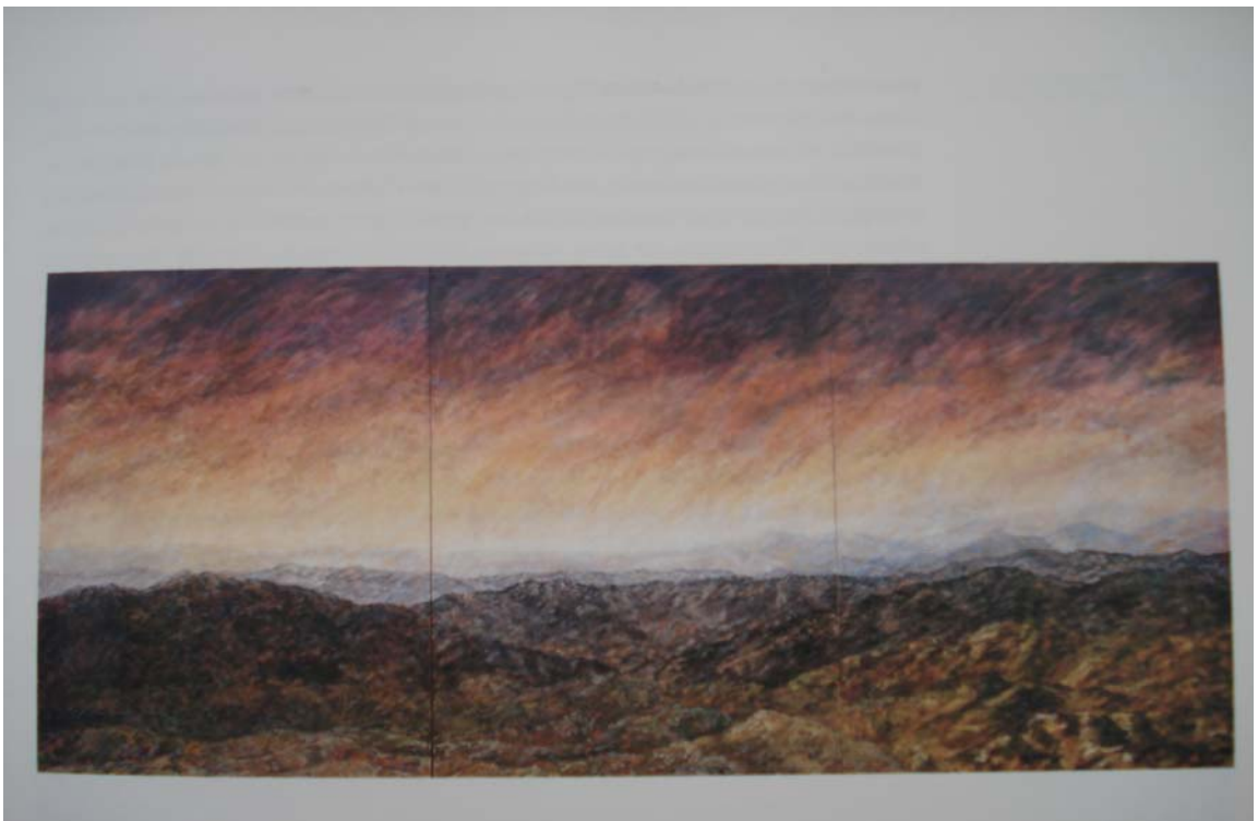
Figura 3. Antonio Barrera: Andes. 1984

Su interés por el paisaje fue empleado para hacer referencia a la presión y a la muerte; cielos oscuros, alambres de púas y figuras maniatadas estaban presentes. Abarca la topografía nacional; las llanuras, las costas caribe, pacífica, la cordillera de los Andes, son paisajes que forman parte de su abundante obra pictórica, la cual es de gran intensidad poética y de gran riqueza cromática. También dio gran importancia al espacio, la luz y la atmósfera. Se consideró a si mismo un neo-romántico, pero trascendió el romanticismo, se aproximó al realismo y al post-impresionismo.