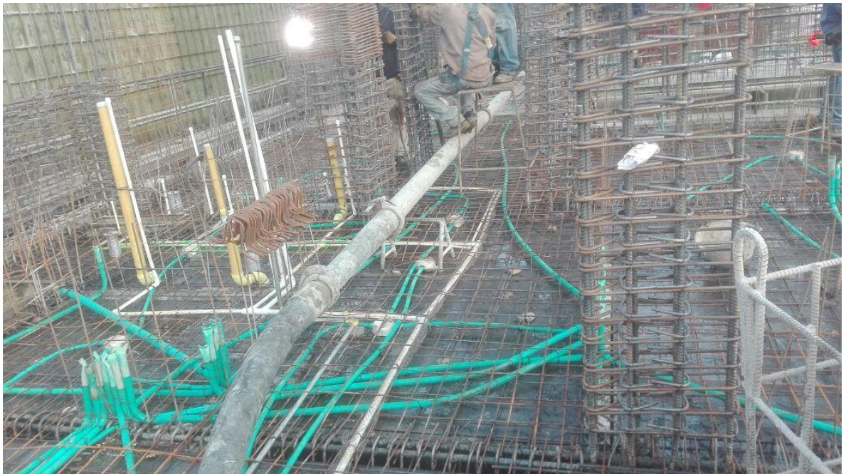
Foto 13. Revisión armada de placa apartamento 1009