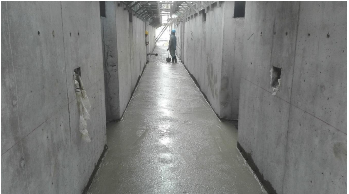
Foto 19. Seguimiento al proceso de fundida del pasillo del piso 7.