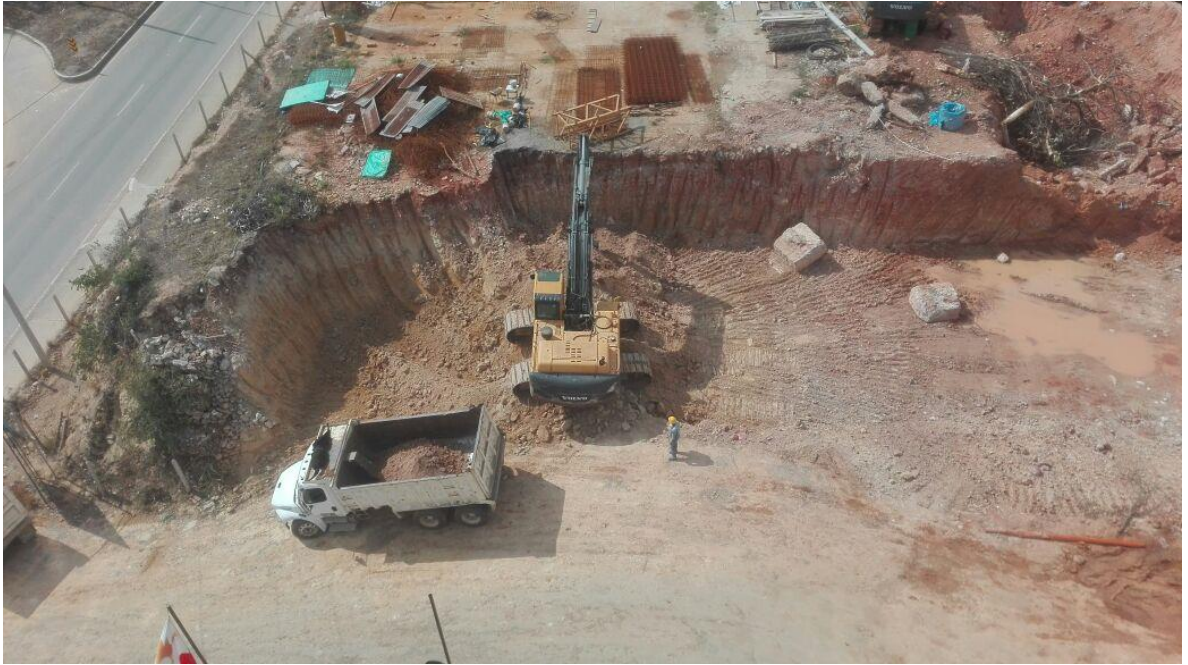
Foto 8. Seguimiento al avance de excavación de la torre de parqueaderos.