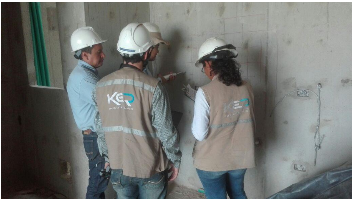
Foto 7. Acompañamiento al ensayo de Esclerometría.