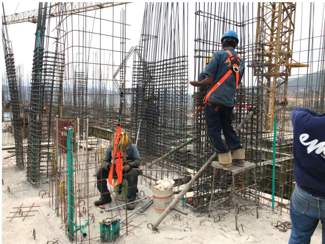
Foto 15. Armado de pantallas apto 1103.