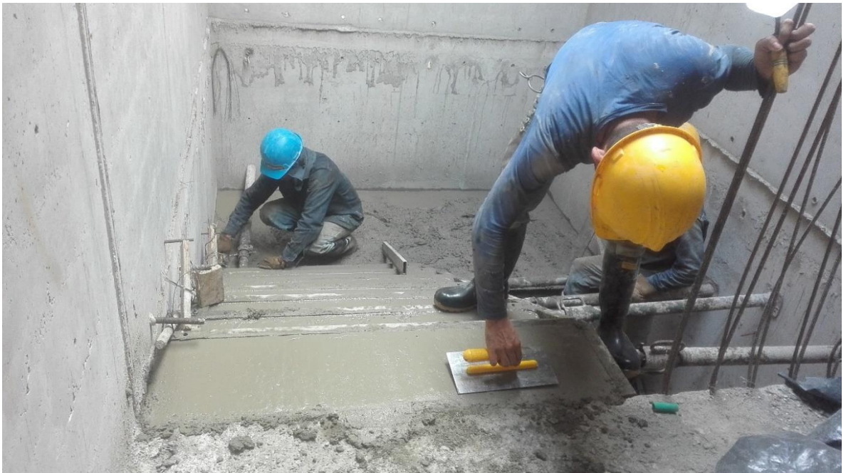
Foto 9. Seguimiento al proceso de fundida de la escalera que conduce del piso 7 al 8.