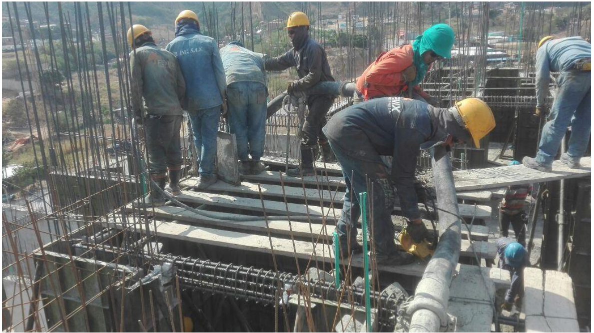
Foto 12. Fundida pantallas apartamento 1003.