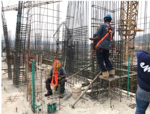
Figura 3. Seguimiento al proceso de armado de pantallas de los apartamentos de la torre.

3.1.4 Encofrado El proceso de encofrado y apuntalamiento de la formaleta se debe realizar correctamente para garantizar que las dimensiones de los elementos estructurales cumplan de acuerdo a lo estipulado en los planos, ubicándolas de manera correcta sobre las marcas de cimbra colocadas por el topógrafo de la constructora.