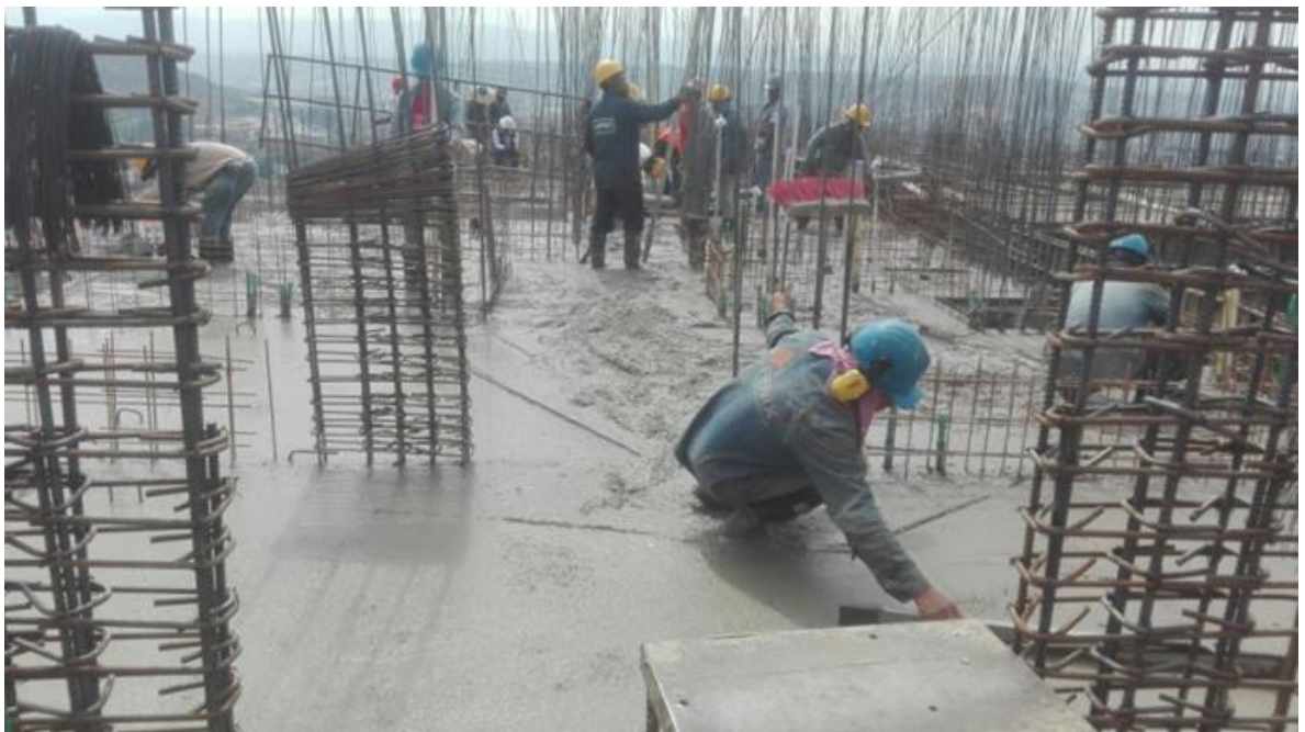
Foto 25. Seguimiento al proceso de fundida de la placa de entepiso del apartamento 1002.