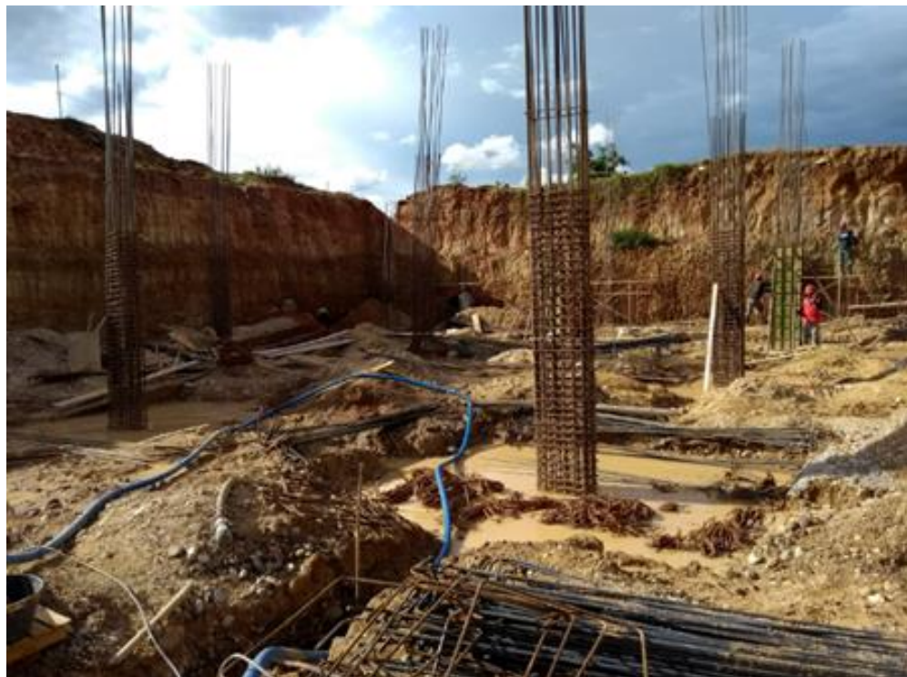
Foto 23. Seguimiento al proceso de armado de columnas sótano 2 torre de parqueaderos.