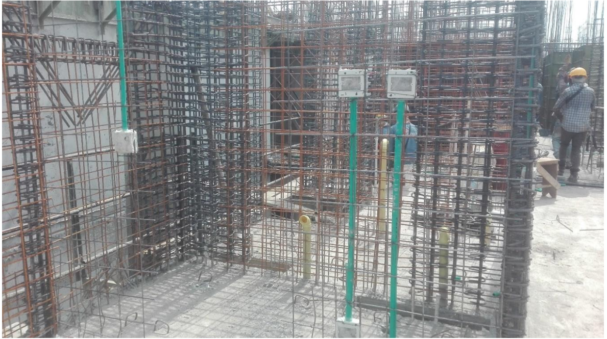
Foto 20. Seguimiento al proceso de armado de las pantallas del apto 808.