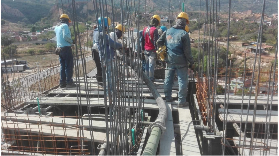
Foto 22. Seguimiento al proceso de fundida de las pantallas del apartamento 901.