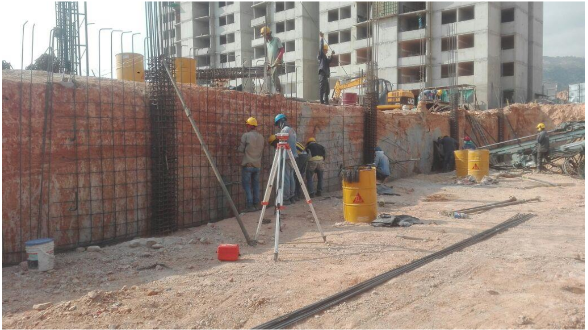
Foto 18. Seguimiento al proceso de armado de refuerzo de muros torre parqueaderos.