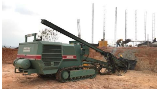
Figura 2. Seguimiento al proceso de perforación de anclajes.

3.1.3 Acero de refuerzo Para garantizar el correcto diseño y proceso constructivo, se debe realizar un seguimiento riguroso a cada uno de los elementos estructurales para dar cumplimiento a lo estipulado en el reglamento NSR-10 3 , verificando que cumplan con los diseños estipulados en los planos estructurales. El seguimiento realizado a estos elementos se llevó a cabo durante la realización de visitas técnicas a las obras, dando apoyo al residente de supervisión técnica.