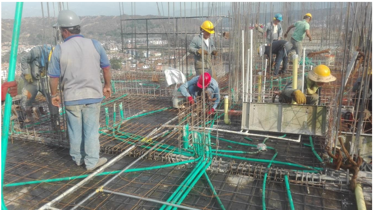
Foto 5. Seguimiento proceso de armado de la placa de entrepiso apto 901.