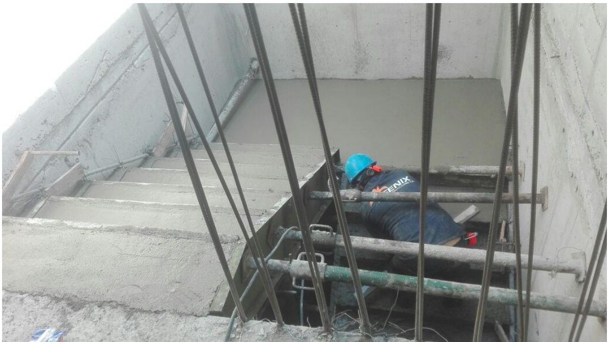
Foto 11. Fundida escalera piso 7 a piso 8.