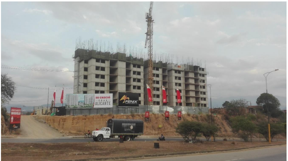
Foto 21. Avance general proyecto Gran Alicante.