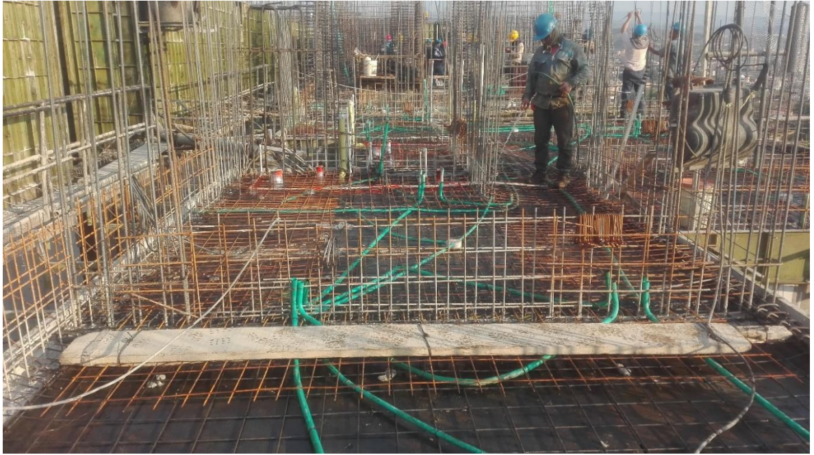
Foto 24. Seguimiento al proceso de limpieza de la placa.