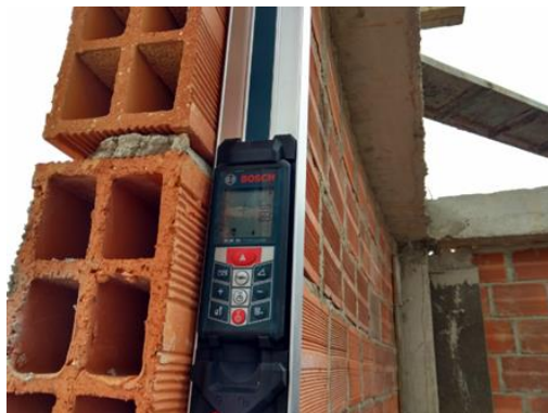
Figura 6. Seguimiento al proceso de armado de mampostería.

Además, se realizó seguimiento a las columnetas y vigas auxiliares utilizadas para confinar los muros de mampostería en los pasillos, en las entradas de los ascensores y las escaleras de emergencias.