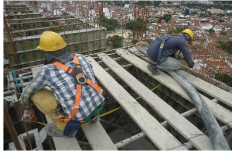
Figura 4. Seguimiento al proceso de armado de formaleta.

3.1.5 Concreto La colocación del concreto en obra es una parte fundamental del proceso constructivo de cada uno de los elementos estructurales, garantizando así que la estructura cumpla con lo estipulado en los planos.