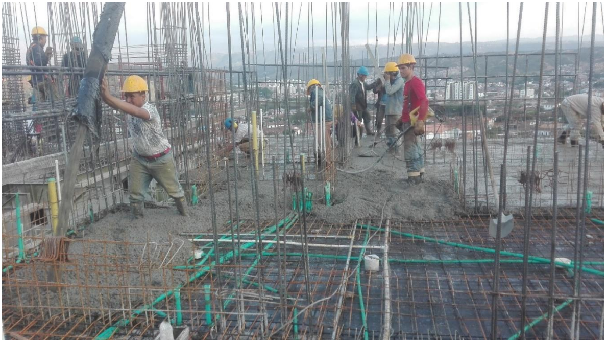
Foto 4. Seguimiento al proceso de fundida de la placa del apartamento 806