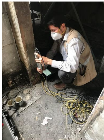
Figura 8. Acompañamiento pruebas UPV Sotomayor.

3.2.3 Impacto Echo (IE) El método Impacto Echo (IE) se lleva a cabo para evaluar la condición de losas, vigas, columnas, paredes, aceras, pasarelas, túneles, presas y otras estructuras. Con el método de Impact Echo vacíos, hormigueros, grietas, descascaramiento y otros daños en el concreto, madera, piedra y materiales de albañilería, se pueden encontrar. También se llevan a cabo para predecir la