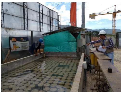
Figura 5. Seguimiento al proceso de curado de los cilindros de concreto.

el asentamiento del concreto) 4 , la toma de muestras de concreto fresco en obra según lo estipulado en la norma NTC 454 (Concreto fresco. Toma de muestras) 5 , la elaboración y el curado de los especímenes de concreto (probetas) (ver figura 5), tal como se indica en la norma NTC 550 (Concretos. Elaboración y curado de especímenes. Concreto en obra) 6 , los cuales se envían al laboratorio para ser ensayados transcurridos 28 días desde su fabricación, según lo establecido en el capítulo C.5 – Calidad del concreto, mezclado y colocación, numeral C.5.6.2.4 el cual dice: “Un ensayo de resistencia deber ser el promedio de las resistencias de al menos dos probetas de 150 por 300 mm o de al menos tres probetas de 100 por 200 mm, preparadas de la misma muestra de concreto ensayada a 28 días o a la edad de ensayo establecida para la determinación de f'c ”(p.C-76), 7 . Si las probetas de concreto no cumplen con la resistencia esperada a los 28 días, deben ser enviados los testigos, que son dos cilindros a 56 días y realizar la prueba con el fin de verificar si a esta edad cumplen con la resistencia esperada.