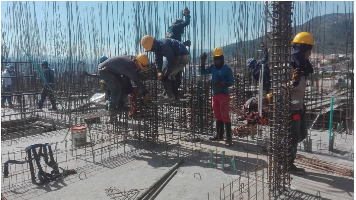
Foto 2. Seguimiento al proceso de armado del refuerzo de las pantallas.