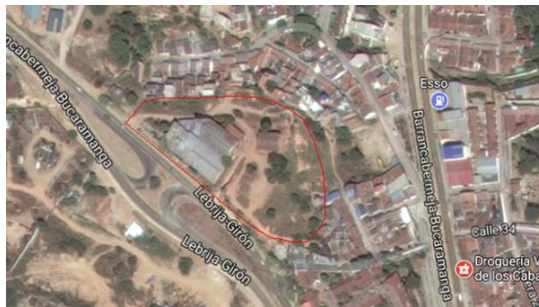
Figura 1. Ubicación del proyecto Gran Alicante.

Se emplea un sistema estructural tipo túnel (pantallas y placas en concreto reforzado), para la torre de apartamentos y sistema estructural tipo pórtico para la torre de parqueaderos, con capacidad especial de disipación de energía (DES), diseñados para soportar cargas verticales y fuerzas sísmicas.