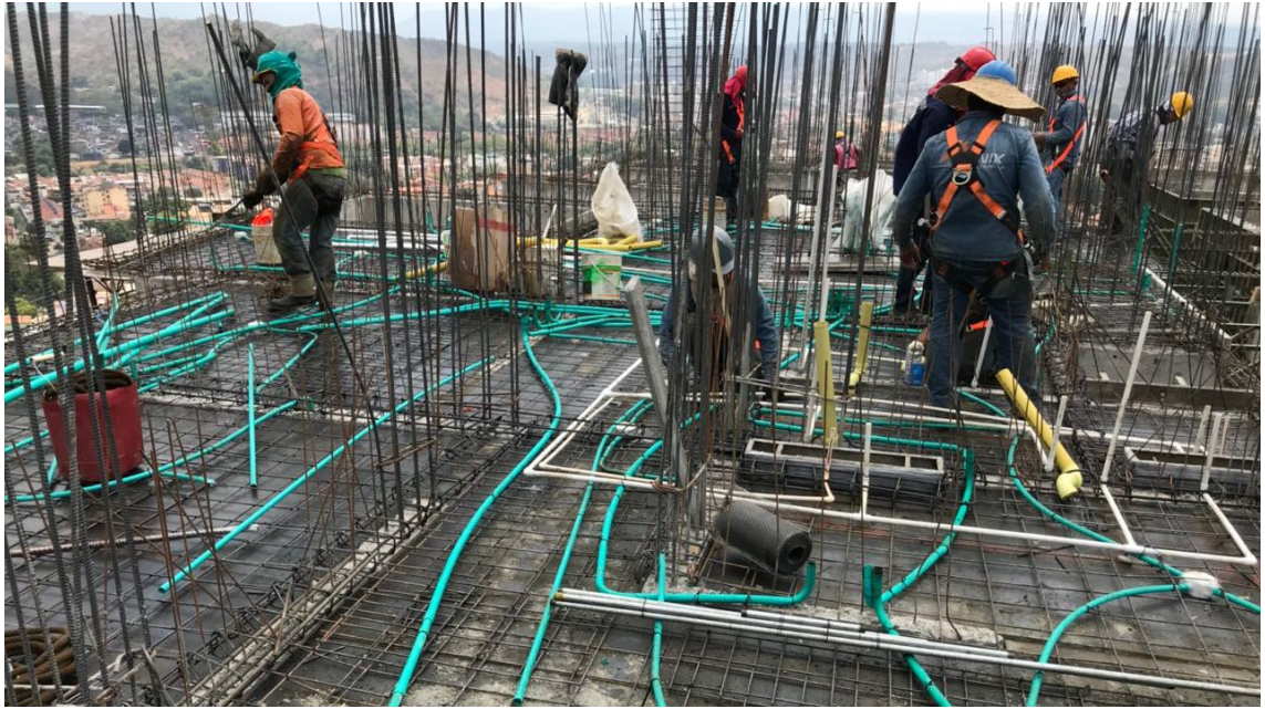
Foto 16. Revisión armado placa de entrepiso apto 1104