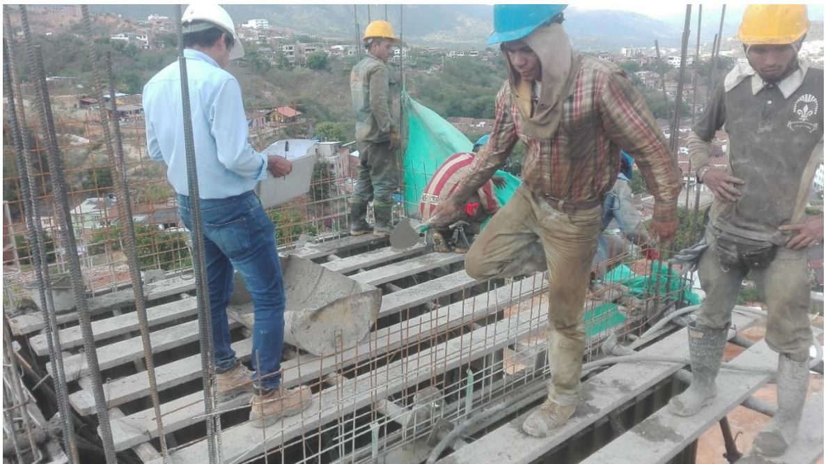
Foto 3.. Seguimiento al proceso de fundida de las pantallas del apartamento 801.