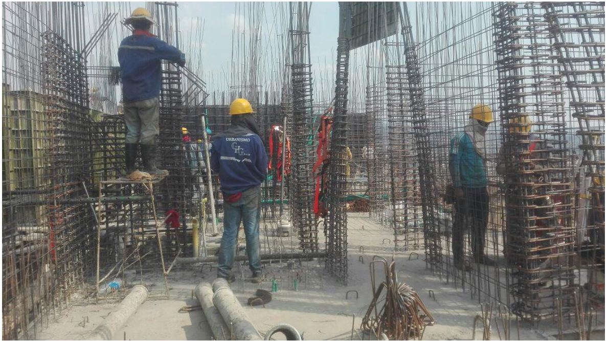
Foto 14. Revisión armado de pantallas apto 1008.