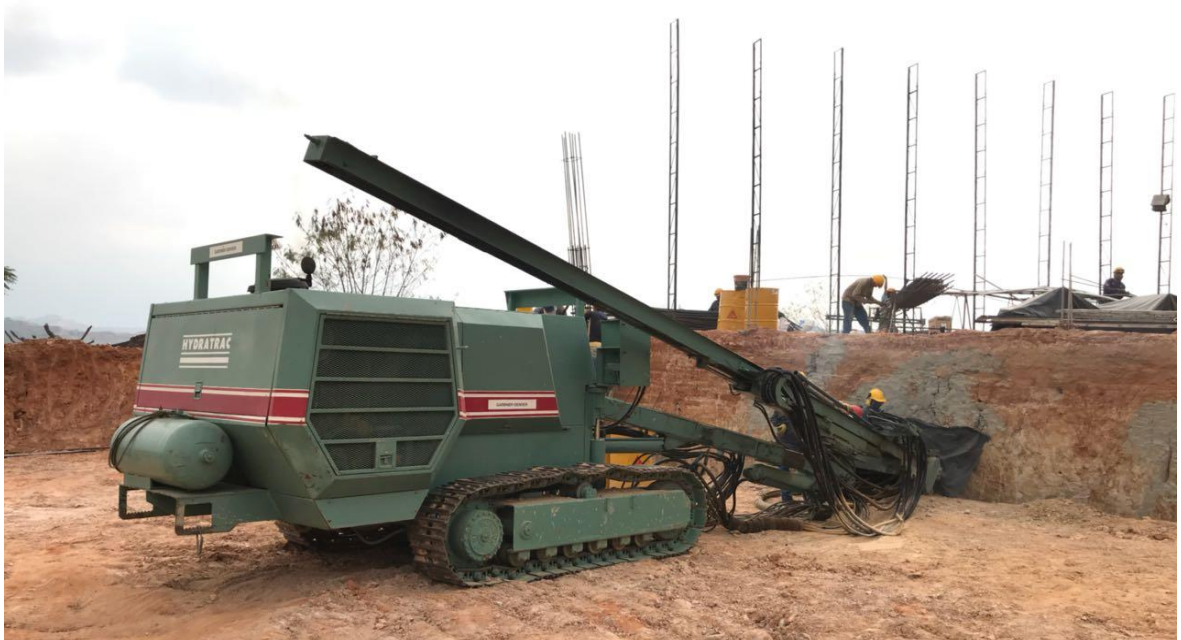
Foto 17. Seguimiento al proceso de perforación para anclajes torre parqueaderos.