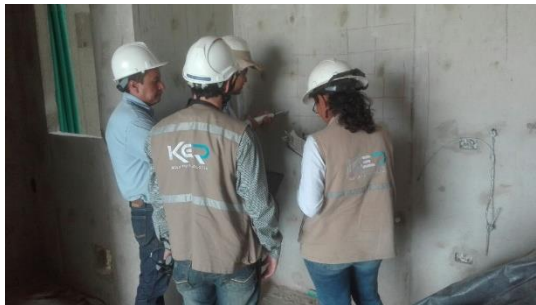
Figura 7. Acompañamiento prueba de esclerometría.

3.2.2 Prueba de velocidad de pulso ultrasónico (UPV) La prueba de velocidad de pulso ultrasónico (UPV por sus siglas en inglés) se realiza para determinar la velocidad de recorrido de la onda a través del material en estudio, la compacidad (que está asociada a la resistencia a la compresión) y las condiciones de integridad en elementos estructurales como: vigas de concreto, columnas, losas elevadas, muros y otros miembros donde existan dos caras de acceso disponible para la auscultación.