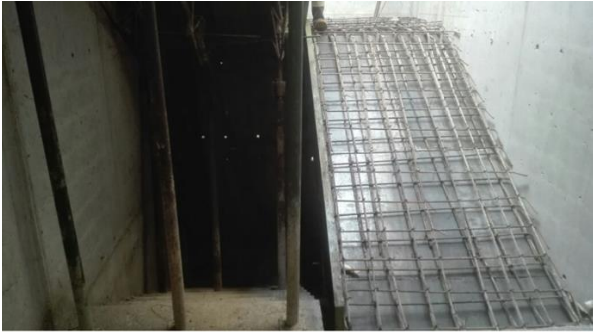
Foto 26. Seguimiento al proceso de armado del refuerzo de la escalera que conduce del piso 7 al piso 8