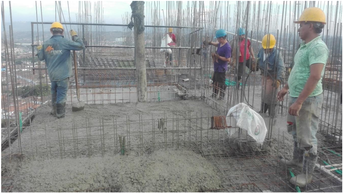
Foto 6. Seguimiento al proceso de fundida de la placa de entrepiso del apto 901.