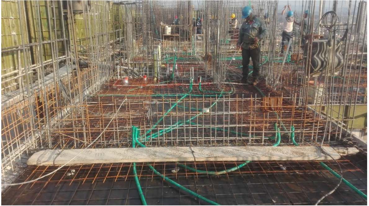
Foto 10. Seguimiento al proceso de limpieza de la placa.