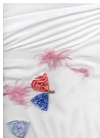
Figura #10 Hilda Vega, Sin Titulo, Detalle, 2005, Técnica Mixta (Pelusas, Alambre de Cobre, Envolturas de Caramelos y Tela).

Llega el momento en que es necesario romper los nexos con la imagen figurativa y explorar más allá del objeto, para descubrir elementos provenientes de la memoria, que posibilitan la creación de una obra consecuente con la naturaleza de la temática, sin ignorar la belleza propia de los encajes, hilos y todos los elementos plásticos provenientes de la textura, color, sutileza y entre otros, provenientes de aquellas labores realizadas desde y alrededor de la mujer.