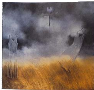
Figura # 2. Patricia Belli. Traje y Paisaje , 1991. Óleo sobre Tela.