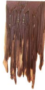
Figura #4. Patricia Belli. Trampas , 1997. Telar.