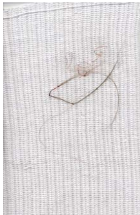
Figura #8 Hilda Vega, Detalle. 2005, Tejido en técnica mixta (Hilos, Lanas, Cabello y Alambre de Cobre, sobre Tejido)

dimensiones variaron haciéndose poco a poco mas grandes, junto con ellas varió la composición original de las obras ya que permitían mayor control en los detalles, a medida que el tamaño crecía, el tiempo y la dedicación necesaria para la elaboración de cada objeto, lo hacían también; los pequeños detalles presentes en cada obra son un testimonio de esto y de el afecto sembrado con cada tejido o puntada en todas la obras.