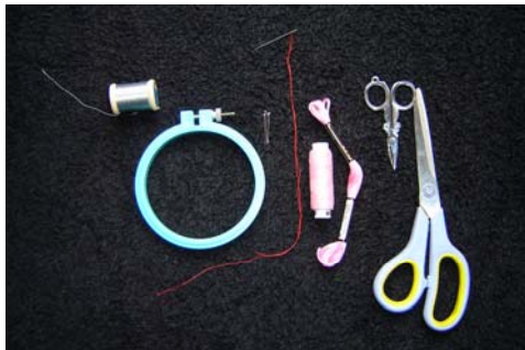
Figura # 9 Materiales (Hilos, Agujas, Tambores de bordado, Alambre de cobre)