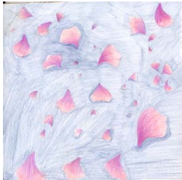
Figura #5. Hilda Vega, Sin titulo, 2005, Dibujo (lápices de color sobre papel).

Los materiales, como las telas y los hilos habían sido utilizados con anterioridad, en la elaboración de obras plásticas, finalmente después de mucho indagar entorno a la temática para el proyecto de grado, se concluyó que la mujer y todo lo relacionado con su entorno desde la perspectiva de la costura sería importante al momento de desarrollar una propuesta plástica coherente con los intereses personales. El tema surge entonces como una forma de introspección entorno a lo femenino y su rol a partir de las labores de costura, tejido y bordado, para convertirse en pretexto de las intenciones artísticas.