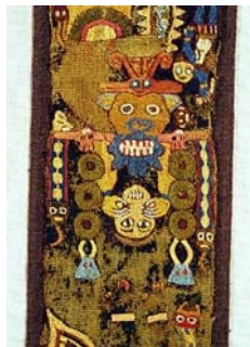
Figura # 1. Tejido de paracas.