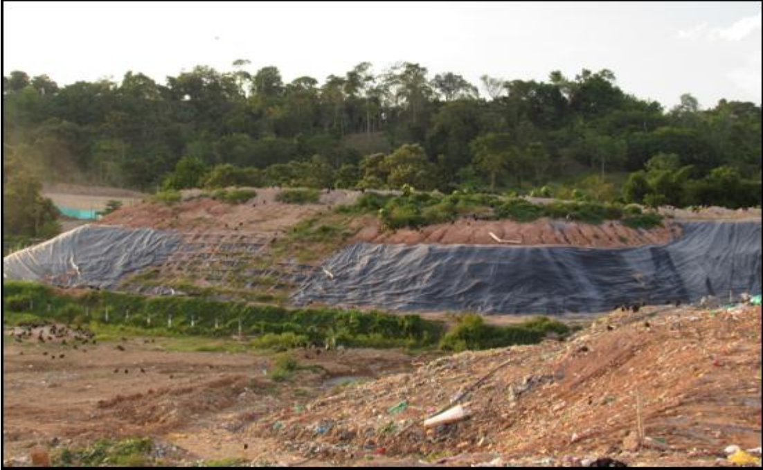
Ilustración 3. Obras de cierre, clausura y restauración ambiental incompletas.