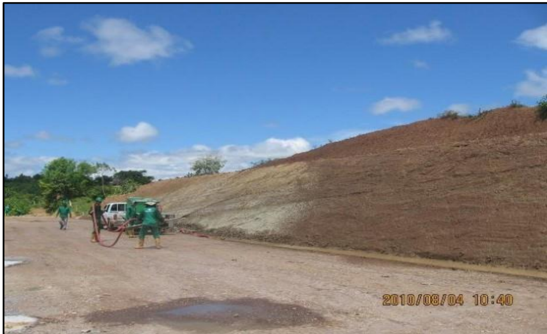
Ilustración 4. Estabilización de taludes con hidrosiembra Complejo Industrial Barrancabermeja.

El aporte del material vegetal se realizara mediante la técnica denominada Hidrosiembra, esta consiste en la proyección sobre el suelo de una mezcla homogénea de semillas, estabilizadores de suelos, fertilizantes u otros elementos, mediante una máquina sembradora. La aplicación se realiza desde una cuba móvil con bomba de presión y boquillas de distribución.