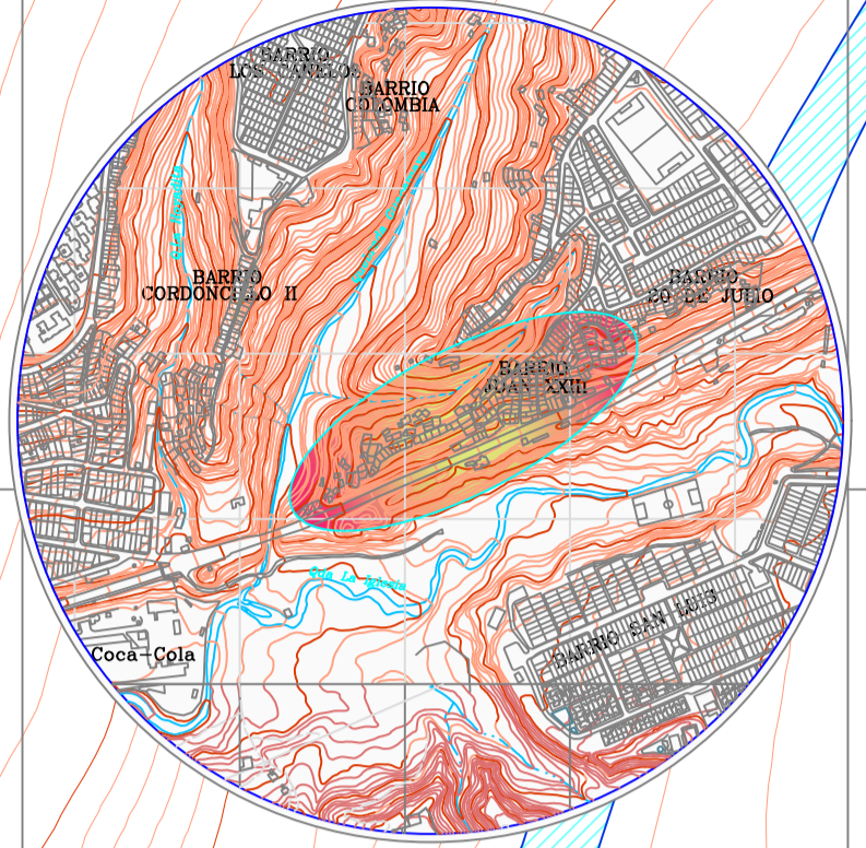
LOCALIZACION GENERAL ESCALA 1:10.000