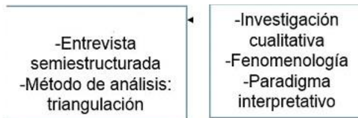
Ilustración 3 Diseño metodológico