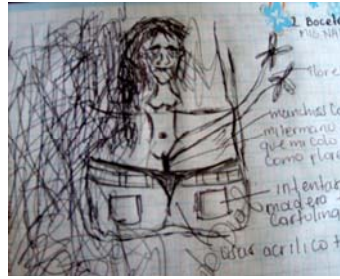
Figura 9. ZAYDE DÍAZ: “Mis Nalguitas de florero”, dibujo sobre papel. 2007.