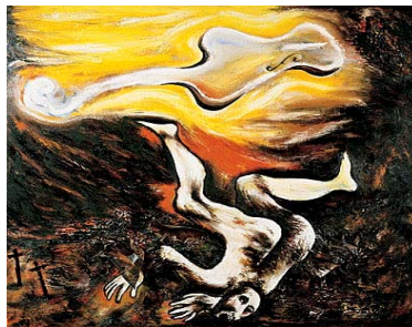
Figura 2. ENZO CUCCHI: “Música ebria”, pintura. 1982.

La manera como el artista aplica cada color, permite que amplíe el espacio pictórico y así sumando una presencia impactante o admiración por el espectador por medio de los colores que el mismo creador usa. En resumen, las imágenes del artista, reaccionan ante las condiciones propias de su lenguaje y tiende a desarrollar nuevas formas de producción que conserva en el recuerdo o el carácter del mismo autor. (Ver figura 2)