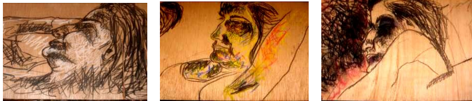
Figura 8. ZAYDE DÍAZ: "Mariana de perfil", Boceto. 2007.

Algunos bosquejos están hechos con pastel, lápiz 8B, color sobre madera triplex; por lo tanto ya no tuve la necesidad de seguir dibujando a mi hermana, ya que los dibujos del proyecto parten de mi autorretrato y la autora concluye que es ella la que está dibujada, pues anteriormente también sucedía que si me perfilaba, pensaba que era mi hermana.