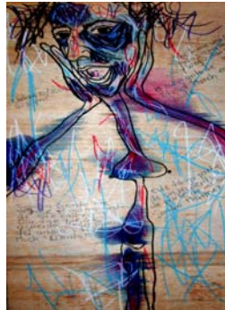
Figura 20. ZAYDE DÍAZ: “El nuevo grito de Eduard Munch en zayde”, dibujo sobre madera. 2007.

Ahora, otro punto que deseo aclarar es que el formato cada vez crece hacia el sentido horizontal y el color se ha vuelto como un acompañante de la autora es decir, el color morado es la representación de su imaginación mezclado con su realidad agregado a su obra.