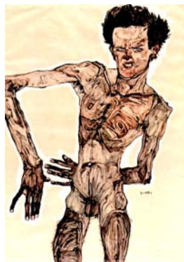
Figura 1. EGON SCHIELE: “Autorretrato desnudo”, pintura. 1911.

Para concluir, con la siguiente obra, el artista hace alusión a lo que hemos mencionado anteriormente sobre que en su vida, el artista tal vez pasó por una enfermedad que le provocó graves estados de salud. (Ver figura 1).