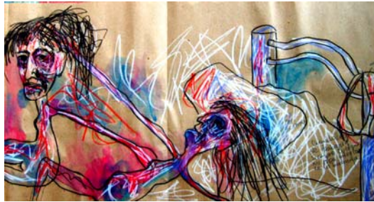
Figura 16. ZAYDE DÍAZ: “Zayde acostada en su cama”, dibujo sobre papel craft. 2007.