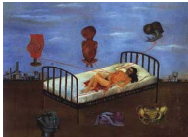
Figura 3. FRIDA KAHLO: “Henry Ford Hospital o La cama volando”, pintura 1932.

Por el contrario los retratos de cuerpo entero, están constituidos por los sucesos dolorosos y dramáticos de la autora, con elementos fantásticos y fuera de la realidad. Indudablemente ello hace que la artista represente y marque la diferencia de toda su obra. La siguiente figura lo expresa. (Ver figura 3)