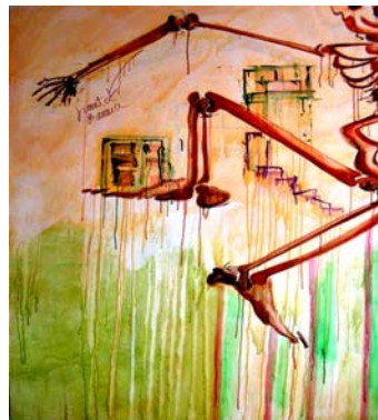
Figura 5. SILVIA ESPINEL: “Juanita Banana”, pintura de 2006.