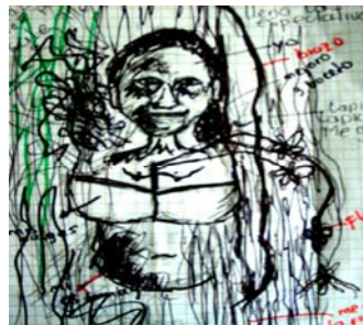
Figura 10. ZAYDE DÍAZ: “Mis Nalguitas de florero II”, dibujo sobre papel. 2007.

El dibujo aparenta una mujer de senos, estomago muy grande y la superposición de otro diseño, como es el caso del rostro de la autora, dejando ver sus senos y desprendiendo un pequeño ramo de flores. Aquí mismo incorporo textos que son escritos tal como los pienso y que es parte esencial de la obra.