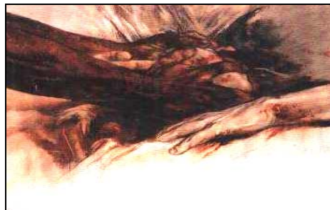
Figura 4. LUÍS CABALLERO: “Autorretrato”, dibujo. 1984.