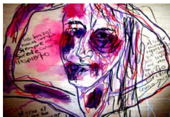
Figura 12. ZAYDE DÍAZ: “Zayde con las manos hacia arriba II”, dibujo sobre madera. 2007.

“Zayde con las manos hacia arriba II” (Ver figura 12) pertenece a la misma obra presentada anteriormente, pero en este caso es trabajado sobre tabla triplex en un formato de 25X23 CMS manejando por primera vez el acrílico en aguadas, lápiz 8B y colores entre claros y oscuros. La idea de manejar el acrílico era con el fin de que la línea no se pierda, ya que mis dibujos son coloreados. Desde que inicie a trabajar para el proyecto siempre pensé que no podía plasmar un dibujo con la misma fuerza como cuando lo hacia por primera vez, pero al observar veo que en ocasiones funciona o que me lleva a realizar nuevas creaciones agregadas al que ya había realizado.