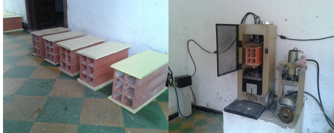
Fotografía 3. Ensayos laboratorio externo.

Con ayuda de una hoja electrónica de Excel, las ecuaciones 1, 2, 3, 4, 5, 6, 7, 8, 9, 10, 11 y los datos de la Tabla 4, se obtienen los valores necesarios para realizar la tabla ANOVA (Tabla 1), a continuación, se resumen los resultados