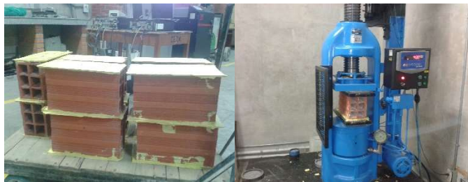
Fotografía 2. Ensayos laboratorio UIS

Con ayuda de una hoja electrónica de Excel, las ecuaciones 1, 2, 3, 4, 5, 6, 7, 8, 9, 10, 11 y los datos de la Tabla 2, se obtienen los valores necesarios para realizar la tabla ANOVA (Tabla 1), a continuación, se resumen los resultados