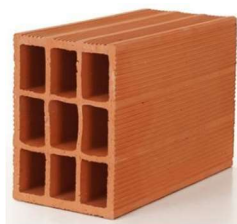
Fotografía 1. Muestra ladrillo H15

Las muestras seleccionadas para el desarrollo de este proyecto fueron ladrillos cerámicos H15 de perforación horizontal de un mismo lote de producción.