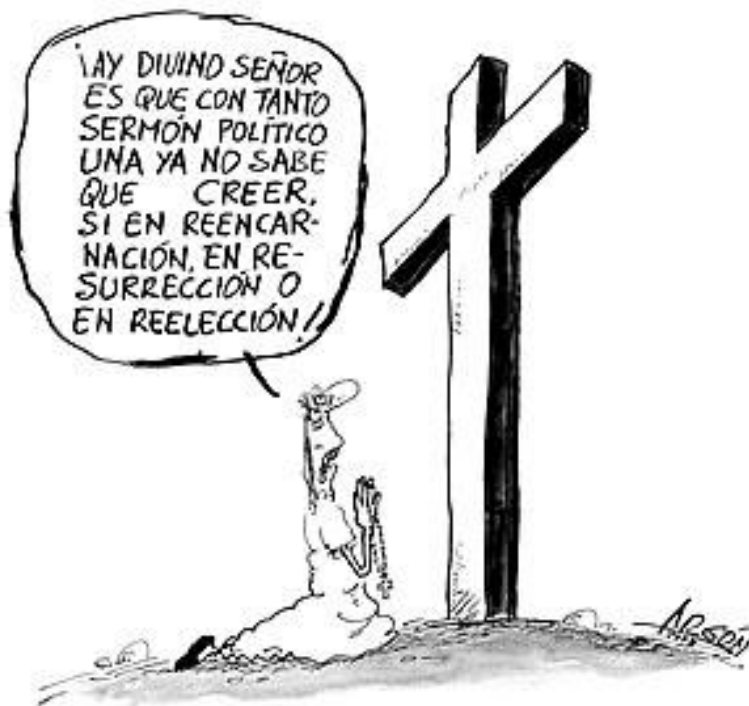
Figura 11. El problema de la reelección presidencial

En síntesis, se puede afirmar que las expresiones culturales latinoamericanas están pasando por un proceso de hibridación que es acompañado por los medios electrónicos de comunicación, donde se propician espacios de innovación, de expansión, de democratización de la cultura que ayudan en la influencia de la conducta de las personas de la sociedad y para la apertura del mercado económico cultural a través de las corporaciones transnacionales.