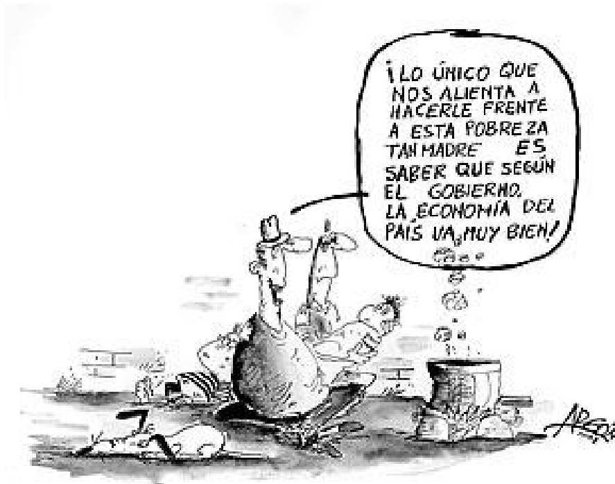
Figura 10. La pobreza y el crecimiento económico del país.

De esta forma, sobresale que la misión de la historieta es “(...) generar nuevos órdenes y técnicas narrativos, mediante la combinación original de tiempo e imágenes en un relato de cuadros discontinuos, (...) a mostrar la potencialidad visual de la escritura y el dramatismo que puede condensarse en imágenes estáticas” 61 , se presentan desarrollos de las técnicas híbridas que han proporcionado atracción en los públicos lectores de diversas clases sociales por un humor que se renueva con estos diferentes desplazamientos, porque rompen cada instante con los cánones tradicionales para retomar desde unas nuevas perspectivas los elementos esenciales de la cultura.