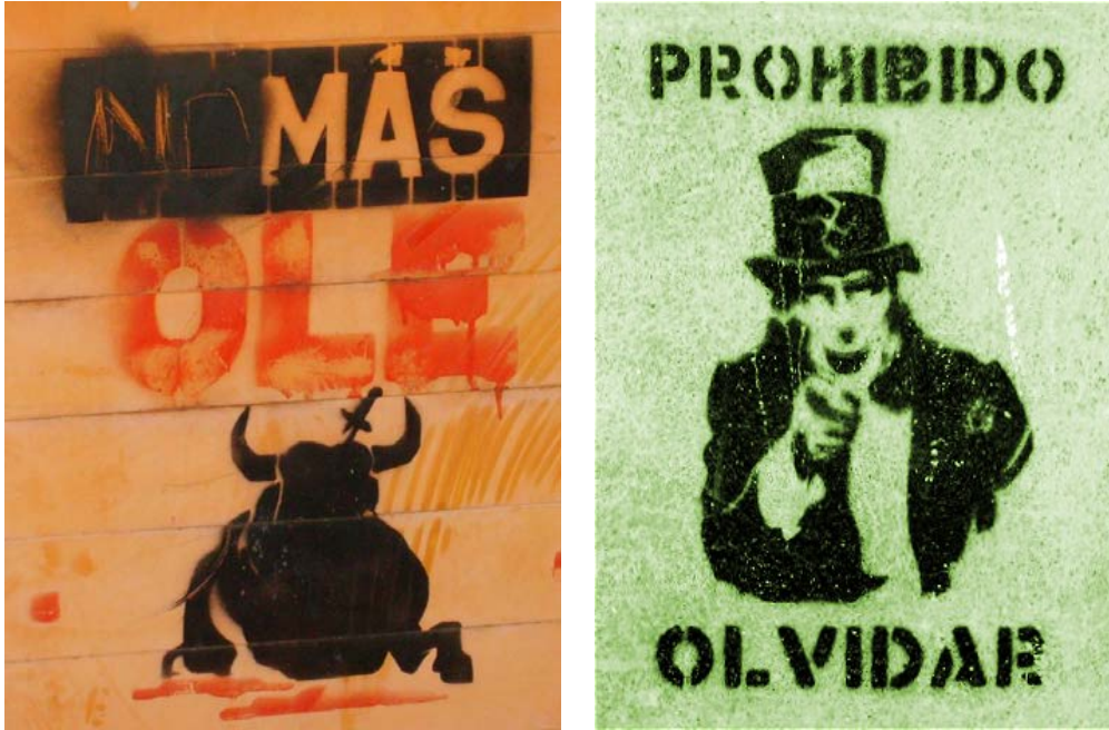
Figura 7. Graffitis que tiene palabras e imagen. Fotografías tomadas por el autor de este trabajo en la ciudad de Bucaramanga

El otro género que se está desarrolla en la sociedad, es la historieta, que se comprende como una mezcla “entre la cultura icónica y la literaria. Participan del arte o el periodismo, son la literatura más leída, la rama de la industria editorial que produce mayores ganancias” 59 , donde se abren campos para expresar el modo de pensar a otros, retornando a leguajes que se puedan comprender de manera inmediata por parte de los lectores. Para ejemplificar este proceso híbrido se presentan las siguientes imágenes: 60