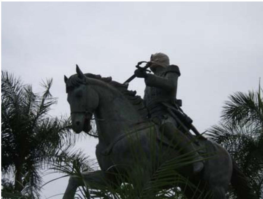
Figura 3. Monumento del Caballo de Bolívar en la Ciudad de Bucaramanga.

diferentes modos de expresión que los individuos utilizan para ser escuchados, como sucede cuando se reutilizan los monumentos emblemáticos, a las tradiciones y los símbolos para transmitir de una nueva manera un mensaje de inconformismo; estos procesos se pueden constatar en las mismas protestas realizadas por los estudiantes UIS, por ejemplo: cuando reutilizan el monumento del “Caballo de Bolívar” como símbolo para manifestar la lucha constante por la libertad, o cuando utilizan las sillas de la universidad para expresar el deseo de una universidad con una alta calidad académica y para todos.