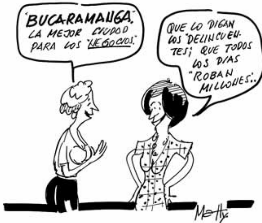
Figura 8. Economía e inseguridad de Bucaramanga.