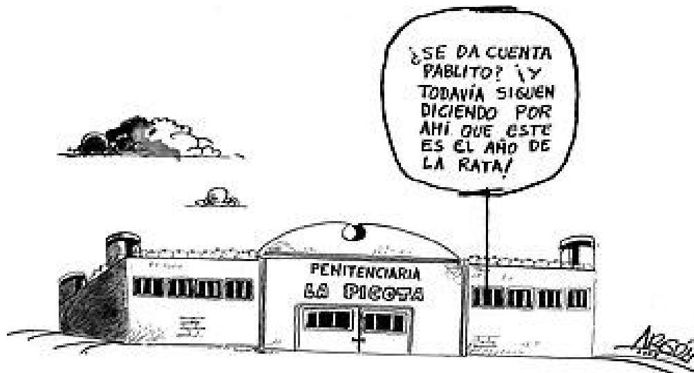
Figura 9. Parodia de la realidad de los políticos colombianos.