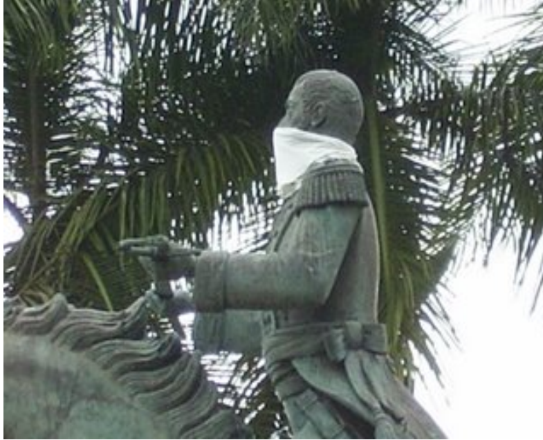
Figura 4. Acercamiento del Monumento del Caballo de Bolívar en la Ciudad de Bucaramanga.

Así pues, la realidad del continente de América Latina, está construida entre lo tradicional y lo moderno, en el que la hibridación trata de desarrollarse con las contradicciones que se presentan en este movimiento, facilitando una nueva forma de ver y comprender la realidad, donde todos tengan las mismas garantías de conocer y participar en los procesos culturales de la sociedad, y que de igual manera “(...) las transformaciones promovidas por los medios modernos de comunicación se entrelaza con la integración de las naciones” 41 , generando como resultado el mejoramiento y el compartir cada vez de los “(...) modos de hablar y vestirse, gustos y códigos de costumbres, antes lejanos y desconectados, se juntan en el lenguaje