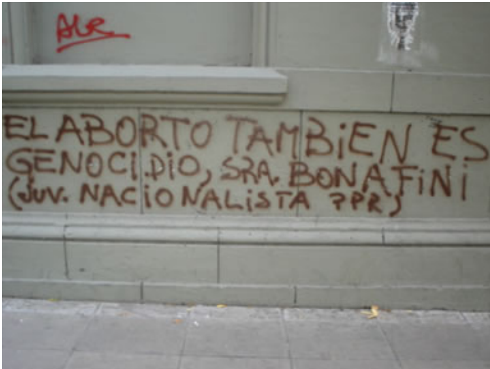
Figura 6. Graffiti en Buenos Aires-Argentina.

El segundo de ellos es en el que “(...) fusionan la palabra y la imagen con un estilo discontinuo: la aglomeración de signos de diversos autores en una misma pared es como una versión artesanal del ritmo fragmentado y heteróclito del videoclip” 58 , que son representativas en el grupo y se sirven de una variedad elementos para expresar los sucesos que están latente en la realidad; además, cada día estas formas de expresar ideas están saliendo de los baños o de los muros de una institución, para instalarse en las calles de las ciudades.