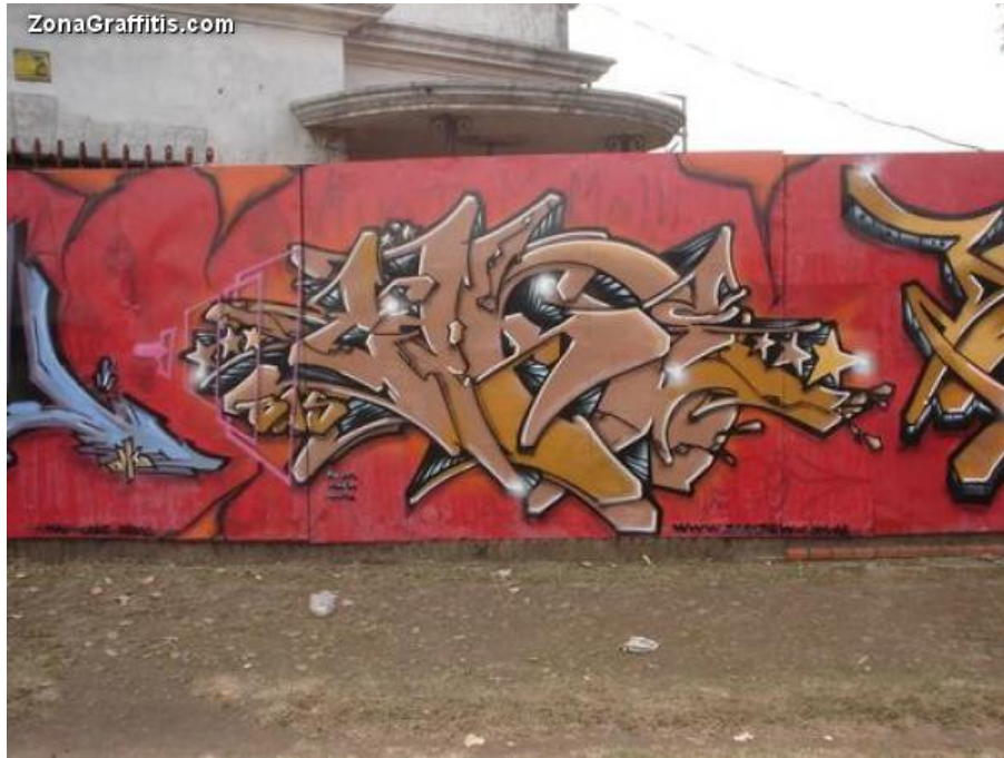
Figura 5. Graffiti de Venezuela.

Por eso, el graffiti es considerado como “una escritura territorial de la ciudad, destinada a afirmar la presencia y hasta la posesión sobre un barrio” 56 , que se crea en las paredes, los vehículos, las puertas y el mobiliario urbano en general, con una variedad de recursos como las pinturas, los aerosoles, los papelógrafos, los clavos, y otros más, para alcanzar verdaderos caminos de expresión que los individuos de la comunidad los utiliza para plasmar de una manera inédita unas “(...) referencias sexuales, políticas o estéticas (...) maneras de enunciar el modo de vida, de pensamiento, de un grupo que no dispone de circuitos comerciales, políticos o massmediáticos para expresarse, pero que a