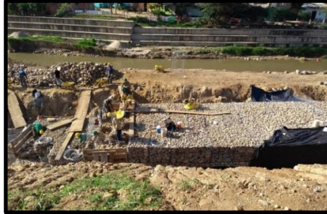
Figura 10. Gaviones.

El sector aledaño al río, se encontraba fallado y hubo gran desestabilización, por tal razón se construyeron gaviones para el control del cauce y así evitar la socavación del río y posibles inundaciones.