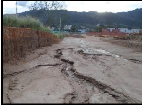
Figura 8. Grietas presentadas en el sector.

Debido a las grietas que presenta el sector, se recomienda implementar un manejo de aguas de escorrentía que evite la aparición de este tipo de cárcavas que afecten la compactación de la obra.