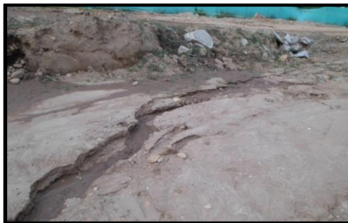
Figura 7. Grietas presentadas en el sector.