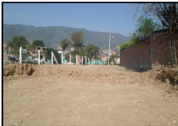
Figura 3. Suelo de sub-rasante característico de la formación órgano.