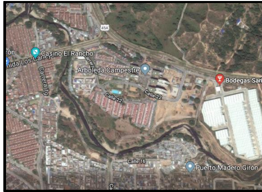
Figura 1. Localización regional del proyecto.