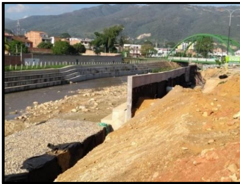
Figura 11. Muro en Concreto Armado.

El sector aledaño al río, se encontraba fallado y hubo gran desestabilización, por tal razón se construyeron gaviones para el control del cauce y así evitar la socavación del río y posibles inundaciones.