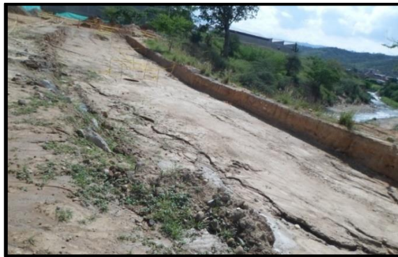
Figura 5. Grietas presentadas en el sector.

En la visita se evidenció la presencia de grietas en el suelo en el sitio donde se encuentra la construcción de la calzada nororiental del proyecto, las cuales se generaron con relación a un proceso de socavación del pie del talud.