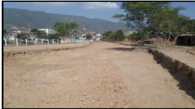
Figura 2. Corte realizado para la conformación de la vía.

A continuación, se presentan imágenes al inicio de la obra: