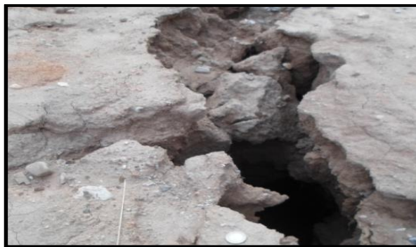
Figura 6. Grietas presentadas en el sector.