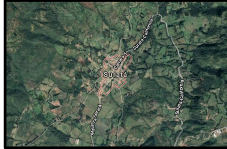
Figura 13. Localización del proyecto.

Suratá en el departamento de Santander. La edificación no cuenta con sótano y según la NSR-10 se clasifica como unidad de construcción en categoría baja.