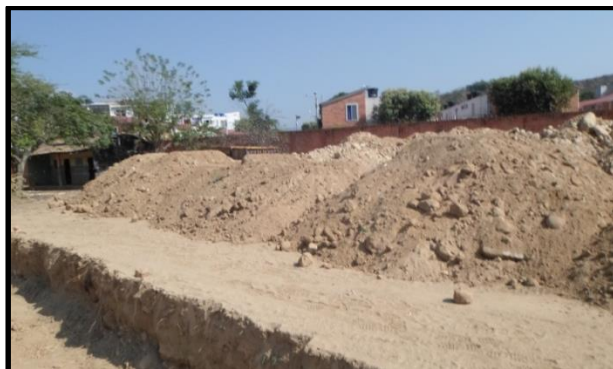
Figura 4. Material cortado sobre el sector.