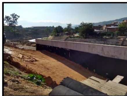
Figura 12. Muro en Concreto Armado.