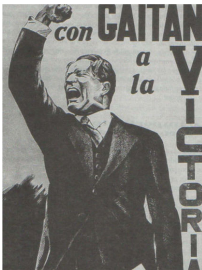
Fotografía 9. Afiche campaña presidencial 1946 231

Bogotá rápidamente quedó empapelada con su imagen; luego, la mayor parte del territorio nacional. Los retratos y afiches del caudillo se convirtieron en un slogan y medio de propaganda electoral. El más conocido y recordado es donde Gaitán aparece de pie, con la mano en alto y empuñada, en señal de desafío.