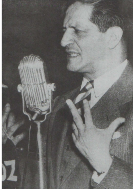
Fotografía 8. Gaitán orador 224 .

Para 1947 el gaitanismo adquirió tal magnitud en Bucaramanga, que las visitas de Jorge Eliécer Gaitán se convirtieron en grandes acontecimientos, previamente preparados: “el sábado 31 de mayo, arribará al aeropuerto Gómez Niño, en un avión de la Lansa, el Dr. Gaitán...Desde el aeródromo partirá un desfile hacia la Plaza del Centenario, atravesando la ciudad...Los directorios gaitanistas designaron distintas comisiones para la organización del desfile y la manifestación que tendrá lugar en la Plaza de Santander, frente al Hotel Bucarica...Las comisiones nombradas fueron las siguientes: de vehículos, de vigilancia, de recepción y de propaganda...” 225 .