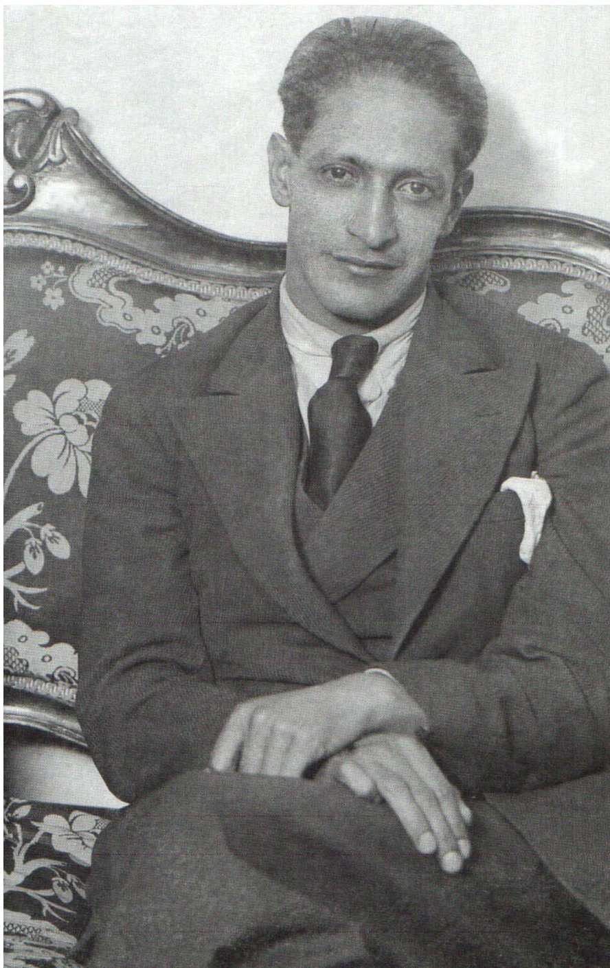
Fotografía 1. Jorge Eliécer Gaitán Ayala 1