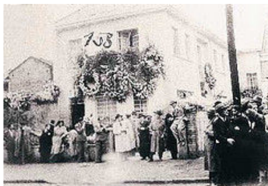
Fotografía 11. Sepelio Jorge Eliécer Gaitán 263 .

Finalmente, el cadáver de Jorge Eliécer Gaitán Ayala fue sepultado el 20 de abril de 1948, en el jardín de su residencia, declarada por el gobierno monumento nacional. “Más de 300.000 personas han desfilado frente al féretro donde yace el cadáver del eximio conductor...La ciudad está llena de banderas a media asta, todas con una cinta negra. El dolor de la ciudad es indescriptible” 262 .