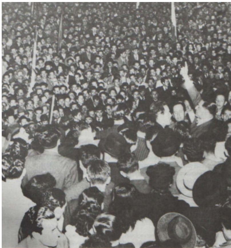
Fotografía 3. Gaitán, jefe único del liberalismo 109 .

En cumplimiento de sus funciones, la junta asesora del jefe del liberalismo nombró directorios para los departamentos de Santander, Caldas, Tolima, Norte de Santander y la intendencia del Meta. La nómina para el directorio de Santander fue la siguiente: