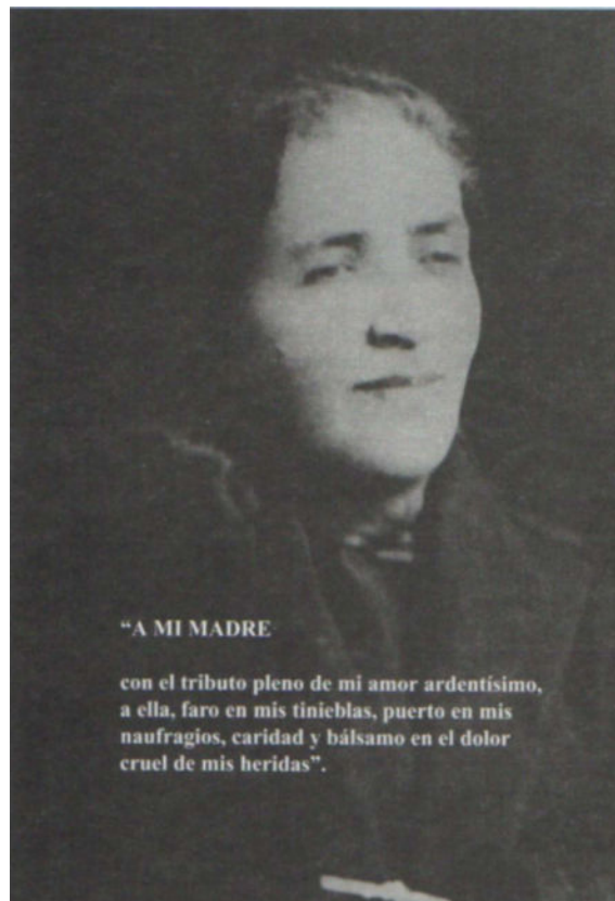
Fotografía 5. Dedicatoria “Las ideas socialistas en Colombia” 154 .