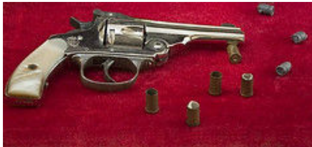
Fotografía 10. Revólver asesinato de Gaitán 250 .

Cuando Gaitán puso su pie derecho en el primer escalón para salir a la calle, un individuo “sacó un revólver calibre 38 largo, de los usados por la policía nacional, y le hizo cuatro disparos en rápida sucesión. El primer disparo entró por el occipital, a la altura de la nuca; el segundo por la espalda; el tercero a la altura del riñón y el cuarto, fue al aire” 249 . Al recibir los disparos, Gaitán se dobló de espaldas hacia la entrada del edificio, quedando automáticamente en estado agonizante.