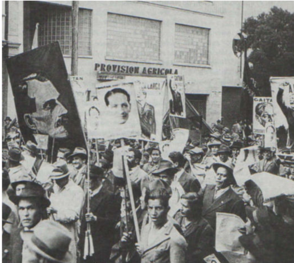
Fotografía 2. Gaitanismo 41

porque considera que el movimiento que sostiene no está basado en las próximas elecciones, sino en algunos fines de conveniencia nacional...” 40 .