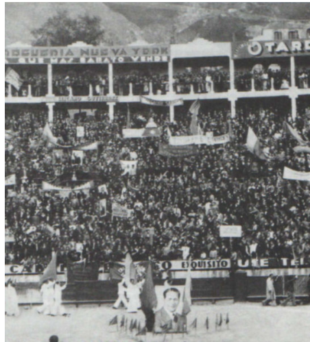
Fotografía 7. Convención gaitanista, Plaza de Toros de Santamaría 193 .

El 18 de enero de 1947, en la Plaza de Toros de Santamaría, se llevó a cabo una convención popular gaitanista con el objetivo de designar candidatos a las inmediatas elecciones parlamentarias; durante su desarrollo se presentaron los