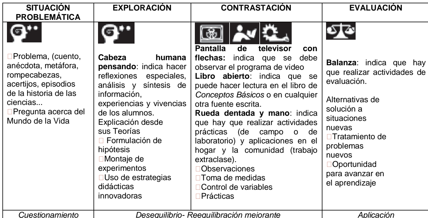
Cuadro 2. Descripción de las Guías de Aprendizaje.

La Guía de Aprendizaje está relacionada con el Módulo de Conceptos , este contiene la información requerida por los alumnos para el proceso de aprendizaje.