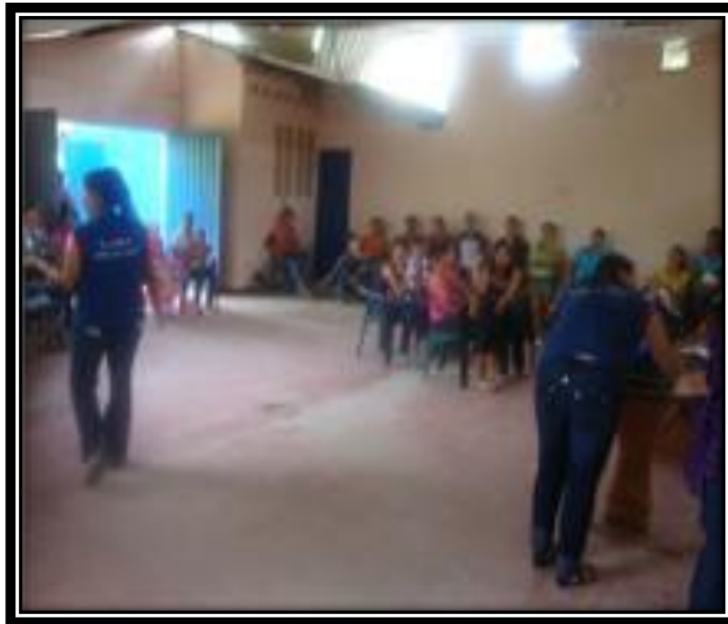
Capacitación realizada en la Hormiga sector perteneciente a Ruitoque bajo

En el municipio de Floridablanca, se manejó la temática de Violencia Intrafamiliar.