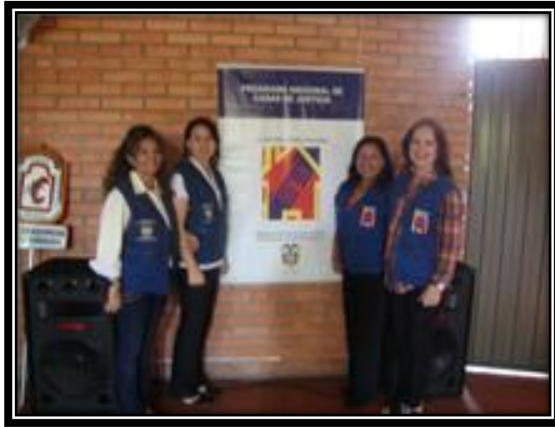
Capacitación a funcionarios de Casa de Justicia sobre Trata de personas