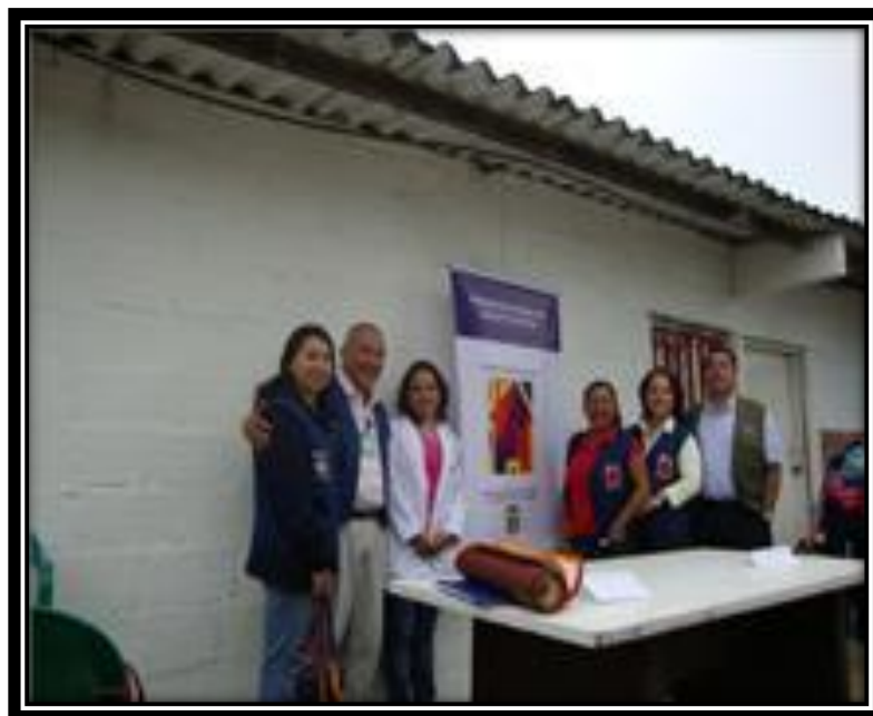
Brigada rural Colegio Gustavo Duarte Alemán km 16 vía a Pamplona.