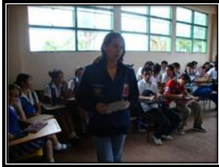
Brigada Rural en el Colegio Gustavo Duarte Alemán km 16 vía a Pamplona.