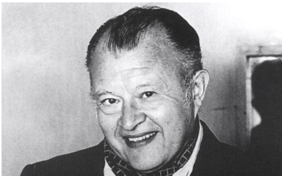
Figura 1. Jaime León