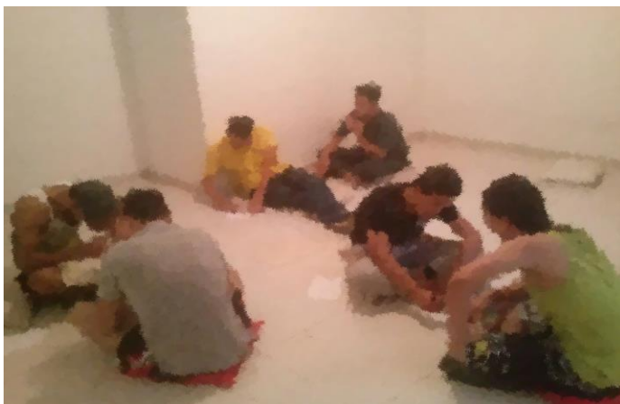
Figura 3: Taller de arte con el Sena.

En esta etapa o fase del proceso de Intervención, se realizó capacitación con el Sena, mediante un convenio gestionado por el profesional en formación. El taller fue de 140