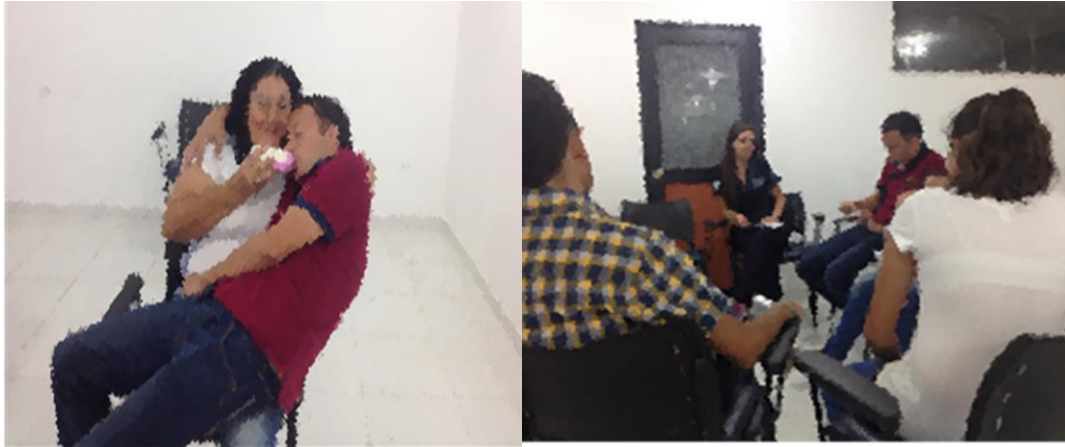
Figura 4: Taller reflexivo con Padres de Familia en Bucaramanga. Biblioteca Gabriel Turbay.

El contexto cultural Colombiano valida el pegar o insultar a los hijos e hijas como modelo de crianza. Aunque las madres y los padres en la mayoría de los casos tienen la loable intención de educar, está probado que la violencia no educa. Estas acciones pueden ser efectivas en el corto plazo, pues el niño, niña o adolescente cumple el mandato de los adultos en el momento, pero el motor de esa respuesta es el temor. El joven no aprende lo que sus padres, madres o cuidadores desean que entienda e incorpore a su conducta, tampoco a autocontrolarse. Por otro lado, la violencia se constituye en una forma de resolución de conflictos aceptada por la familia y esto trasciende el ámbito doméstico, más aún cuando por la condición de adicto del hijo, se genera una exclusión y rechazo de los padres. A causa de esta forma de violencia para criar. El objetivo de los talleres fue aprender o practicar formas alternativas de poner límites a los niños y niñas, adolescentes y jóvenes. Sin pegarles o agredirlos verbalmente.