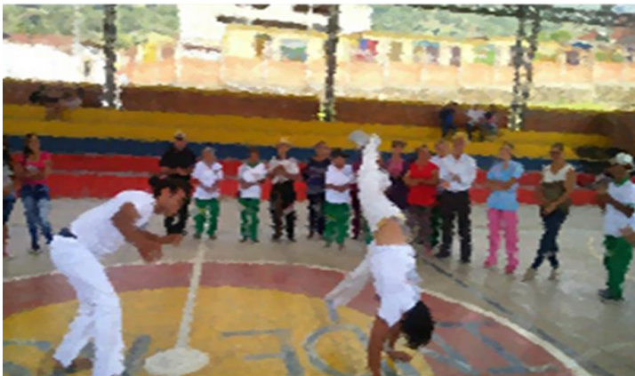
Figura 1: presentación de capoeira en el Municipio de Matanza.