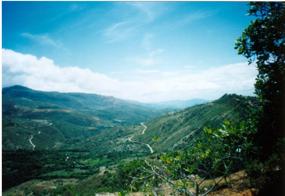
Foto 2. Relieve del municipio

Se elaboró el levantamiento topográfico en la zona directa del relleno sanitario, mediante el método de la poligonal en circuito. La cartera topográfica se encuentra en el anexo 1.