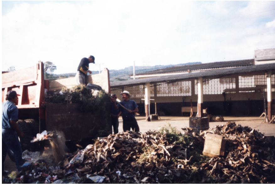
Foto 5. Recolección de residuos en la plaza de mercado