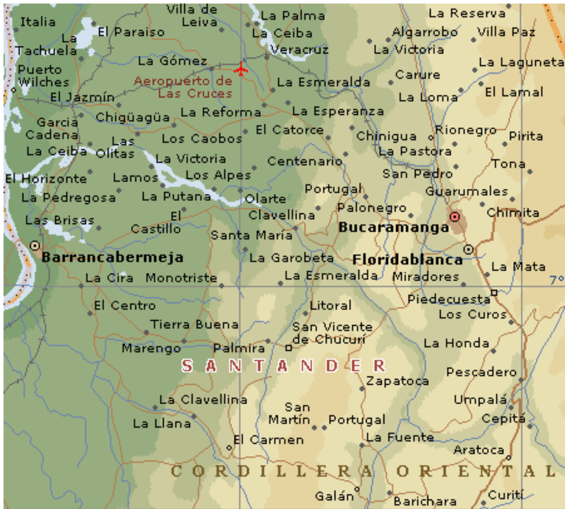
Figura 1. Localización general del Municipio de Zapatoca