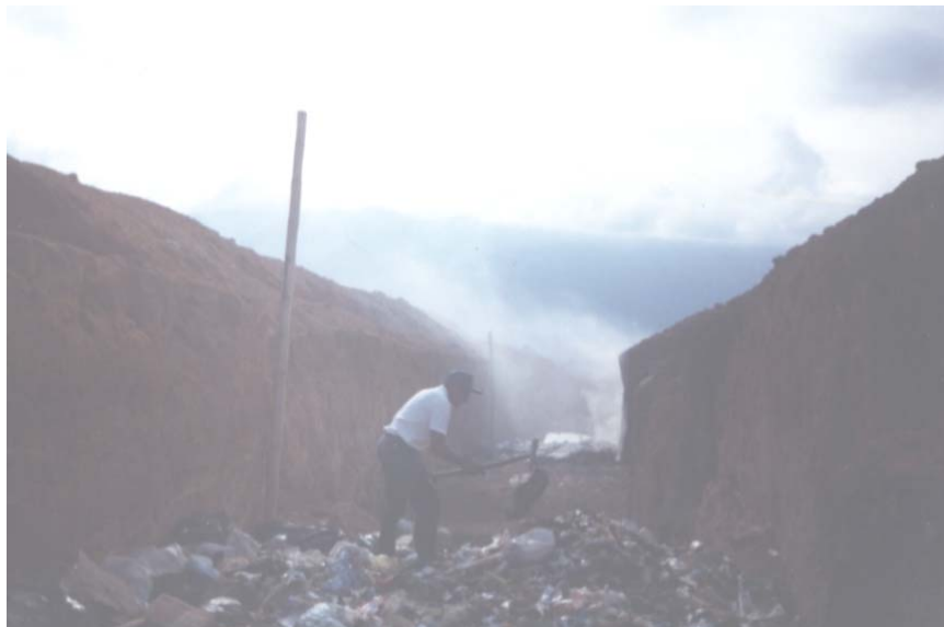
Foto 6. Preparación de la Celda Diaria