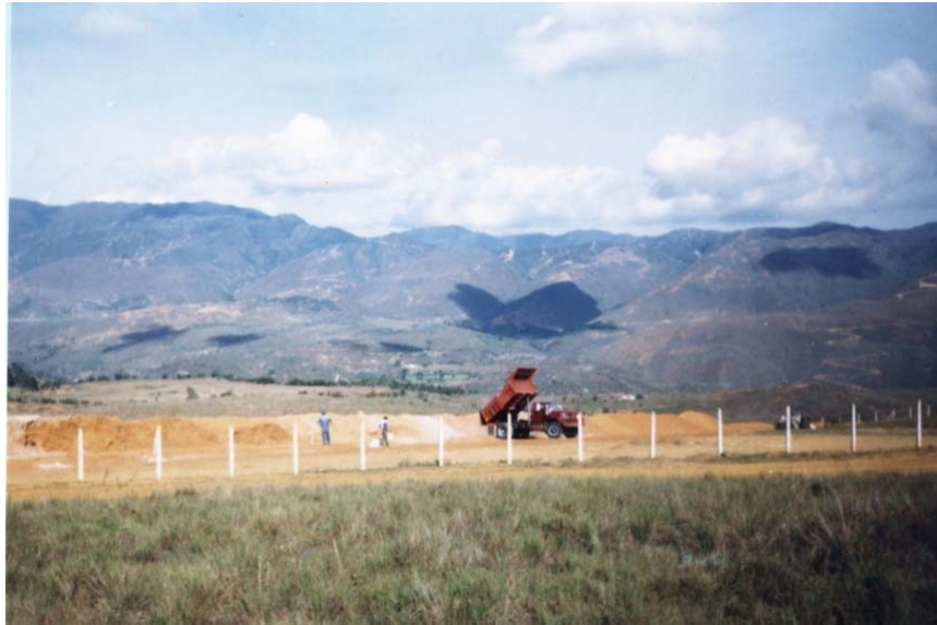
Foto 1. Ubicación General del Relleno Sanitario

área superficial de 0.815 Ha, que corresponde al lote encerrado con un perímetro de 404 m, además comprende las zonas aledañas al relleno en un radio aproximado de 500 m.