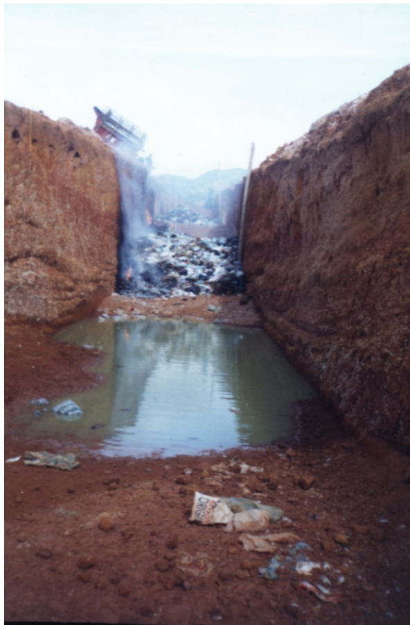
Foto 3. Suelo Impermeable

Según se observó en el apique de cuatro (4.0) metros de profundidad, las arcillas predominan en el perfil. Se realizó un ensayo de permeabilidad en el fondo del mismo por el método del pozo barrenado, sin revestimiento y con nivel freático profundo, agregando agua al pozo. El nivel de agua dentro del pozo no cambió en 24 horas de observación, lo que indica valores de permeabilidad muy bajos, lo cual le da al suelo una clasificación de impermeable a muy impermeable. Esta situación se comprobó con la observación de la propia excavación de la celda para depositación de desechos, donde se encontró agua depositada de varias semanas, con permanencia de su nivel y formación de algas.