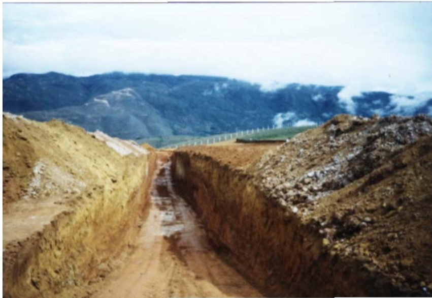
Foto 7. Zanja Tipo

La dimensión de cada zanja es de 4 m de ancho por 4 m de profundidad por 80 m de longitud aproximadamente, dependiendo de la longitud del lote.