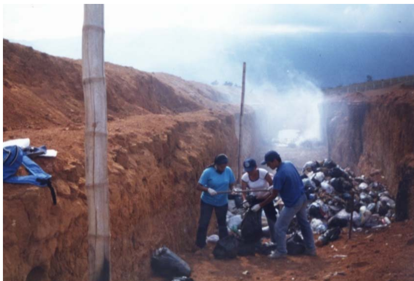
Foto 8. Composición física de los residuos sólidos