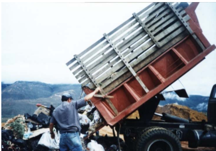
Foto 4. Vehículo recolector en la disposición final

método se utiliza actualmente una cuadrilla de cinco personas la cual consta de dos operarios que se encargan directamente de la recolección puerta a puerta; otros dos sobre el vehículo recolector que la reciben, (para ésta actividad están dotados de un par de guantes de cuero, cada uno) La acomodan y realizan un reciclaje superficial, y el conductor del vehículo: Volqueta marca Dodge modelo 76, la cual tiene una capacidad de 6 a 9 ton. Aproximadamente.